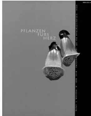
Pflanzen fürs Herz, 264 pp., reich illustriert (350,- ATS)