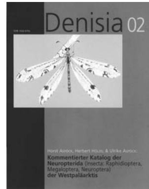
Kommentierter Katalog der Neuropterida (Insecta: Raphidioptera, Megaloptera, Neuroptera) der Westpaläarktis H. ASPÖCK, H. HÖLZEL & U. ASPÖCK, 618 pp., illustr. (480,- ATS bei Abo/ regulär 960,- ATS)