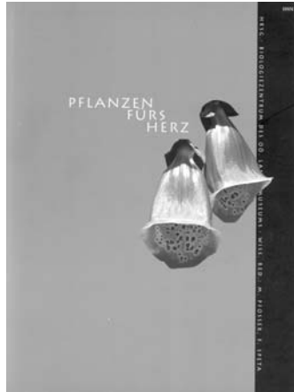
Ausstellungskatalog Pflanzen fürs Herz 260 pp., illustriert (€25,44)