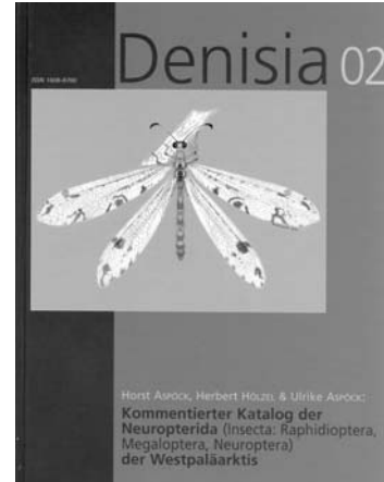
Katalog der Neuropterida (Insecta: Raphidioptera, Megaloptera, Neuroptera) der Westpaläarkt 612 pp. 6 Abb. (€69,77). Für Abonnenten d. Schriftenreihe Denisia €35.-