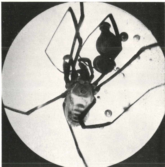
Abb. 2. Sabacon bachofeni n. sp. in Stück Nr. A 110, in Dorsalansicht (etwa 10fache Vergrößerung). Außer zwei kleinen Luftblasen finden sich rechts oben neben dem Tier zwei größere zusammenhängende Blasen, die mit weißlicher Trübung (Emulsion) gefüllt zu sein scheinen.