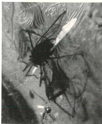
Abb. 1. Nemastoma succineum n. sp. in Stück Nr. 27 (in 7facher Vergrößerung). Die Lage des Tieres für die Photographie ist so gewählt, daß der charakteristische Nemastoma -Palpus entscheidend zu erkennen ist.

Stück Nr. 51 (ein trapezoides Stück von 9 mm größter Dicke mit vier Seitenkanten von 25:20:33 18 mm Länge) hat neben drei Fliegen und einer Ameise eine Phalangiide eingeschlossen, die wir Liobunum inclusum n. sp. nennen. Bei diesem Tier beträgt die Körperlänge 2,3 mm und die Länge des Femurs am 2. und 4. Bein 8,5 bzw. 4,5 mm. Deutlich erkennbar sind auch der unbewehrte, glänzend-glatte Tuberculum oculorum, die unbewehrten Palpen mit kammzähni ger Endkrallen und ohne mediale Apophysen an Patella und Tibia.