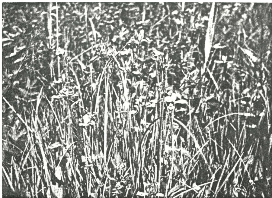
Abb. 1. Iris sibirica in den Orter Wiesen

(zu S. 276 ff. Bild 1: Fot. Huemer; die übrigen vom Verfasser)