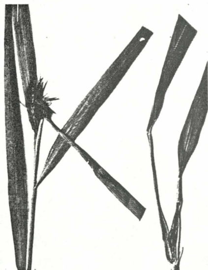
Abb. 2. Rechts Galle, links Wachstumsretardation und Mißbildung an einem Schilf von Ort