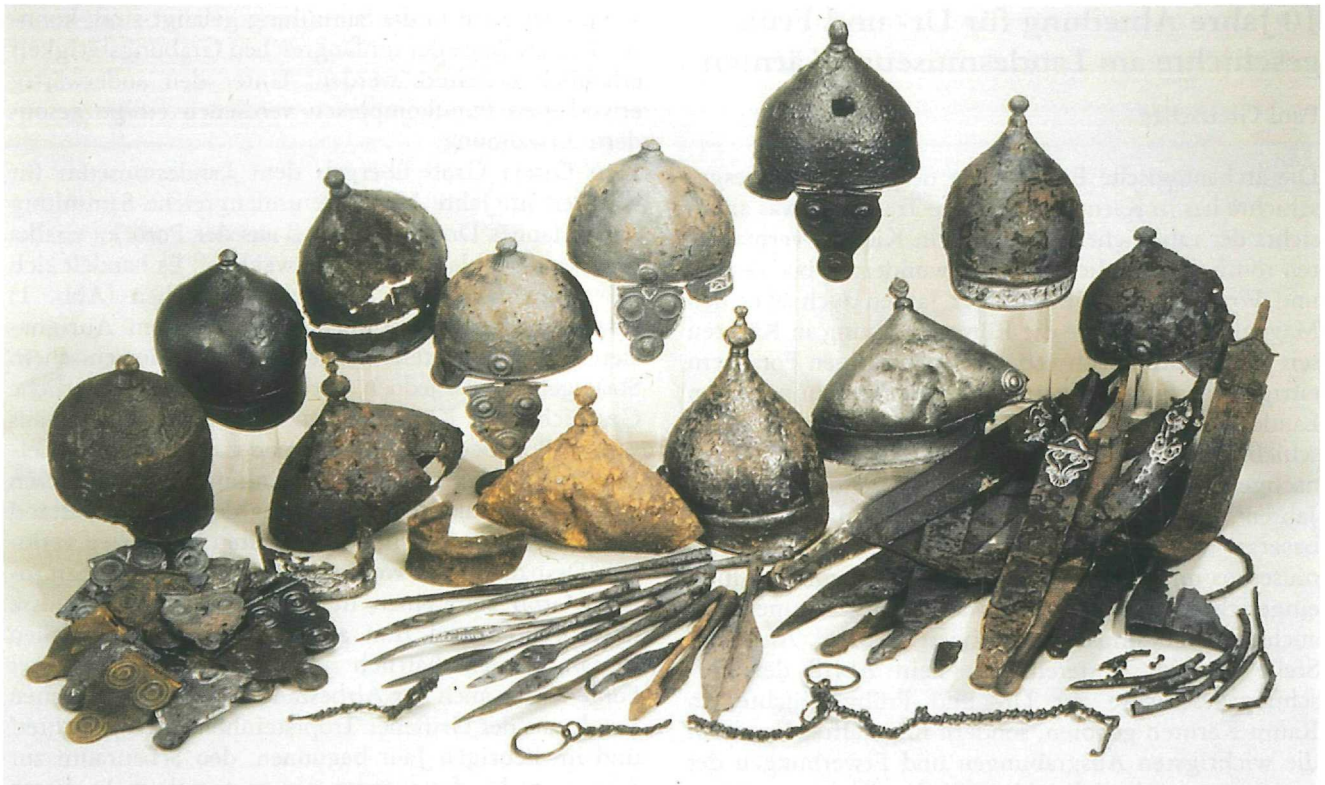
Abb. 2: Förker Laas Riegel, keltischer Waffenweihfund; Aufn. Römisch-Germanisches Zentralmuseum Mainz

Die Waffen und Trachtelemente des bedeutenden früh-eisenzeitlichen Kriegergrabes von Villach galten lange als verschollen. Nachdem sie in Berlin wieder aufgetaucht waren, gelang es über das Römisch-Germanische Zentralmuseum in Mainz zu beschaffen, sodaß das Grab nunmehr in seinen wesentlichen Teilen gewissermaßen wieder zusammengeführt ist.