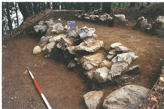
Abb. 7: Maria Saaler Berg, zweischalige Webrmauer aus späteltischer Zeit

Während der vergangenen zehn Jahre wurden natürlich auch durch Kollegen verschiedene Fundkomplexe erstmals oder neu bearbeitet, teilweise auch restauriert. Das Bild der Kupferzeit im Kärntner Raum wurde durch die Arbeiten von G. Vahlkampff zum Rabenstein