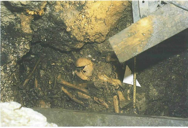
Abb. 8: Durezza Schachthöhle bei Warmbad Villach, Fundsituation