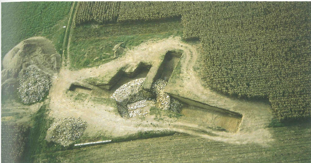
Abb. 4: Waisenberg, späthallstattzeitliches Königgrab mit zwei "steinernen Betten" und schützender Steinpackung

Tetracharmen enthielt, insbesondere solche des Prägerherren Copo 13 . Leider bleiben auch hier Vollständigkeit und Fundumstände im Dunkeln, sodaß wichtige Daten für die Landesgeschichte unerhellte bleiben müssen. Dennoch stellt der Fund eine wesentliche Bereicherung der Keltensammlung am Landesmuseum für Kärnten dar.