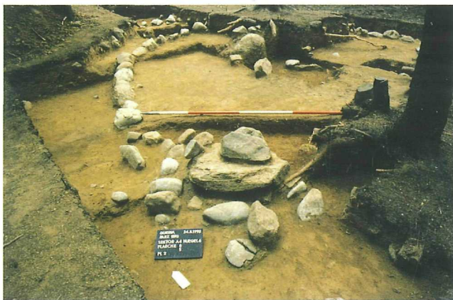
Abb. 5: Gurina/Schmeißer Boden, Grabhügel 6/Nachbestattung im symbolischen Zugang

tung. Deren Restaurierung wurde freundlicherweise vom Römisch-Germanischen Zentralmuseum in Mainz übernommen und ist zwischenzeitlich abgeschlossen. Ein zweiter Prunkgrabhügel ist von der fortschreitenden Beackerung schwer bedroht und sollte umgehend ausgegraben werden!