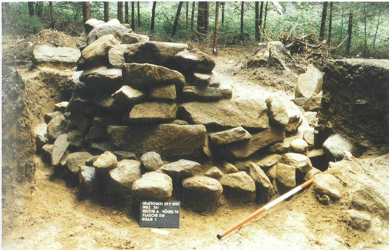
Abb. 6: Gratschach/Michaeler Teich, Grabbügel 13/Steinbau über der Grabkammer

ehesten ins Spiel gebracht werden, will man beim derzeitigen Stand der Kenntnis der Siedlungsarchäologie im Kärntner Raum der Noreia-Frage nachgehen. Neben diesen siedlungstopographischen Feldforschungen insbesondere zur Eisenzeit konnte im Jahre 1996 in Zusammenarbeit mit dem Museum der Stadt Villach und mit Mitteln des Fonds zur Förderung der Wissenschaftlichen Forschung in Wien im Bereich des Tscheltschnigkogels über Warmbad Villach eine aufregende Fundstelle untersucht werden. Nachdem Villacher Höhlenforscher in der Schachthöhle Durezza auf einen Knochenkegel gestoßen waren, wurden die verbliebenen Schichten archäologisch untersucht (Abb. 8). In Zusammenarbeit mit E. und S. Reuer, A. Galik und M. Pacher konnten die Überreste von rund 150 Menschen und 100 Haustieren sowie einige wenige Trachtelemente der Späthallstattkultur geborgen und untersucht werden. Die Forschung denkt zum einen an eine Sonderform der Bestattung, geht zum anderen davon aus, derlei Komplexe als Opferspalten zu interpretieren.