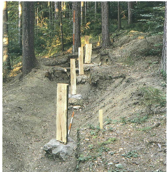
Abb. 3: Gracarca, Fundamentsteine eines eisenzeitlichen Hauses; Zustand nach Ende der Grabung; Aufn. P. Gleirscher

In Malta/Koschach war schließlich 1997 ein keltischer Münzschatzfund ans Licht gekommen, der 60 norische