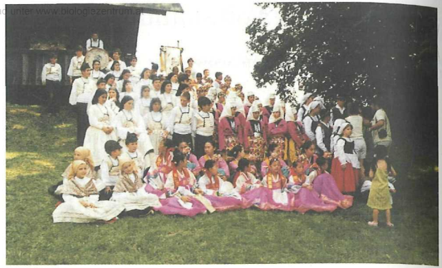
Abb. 4: Internationales Kindervolkstanzfest am 13. Juli 2002; Aufn. J. Schwertner

Mit der Umgestaltung des „Festplatzes“, die auch ein Versetzen der Badstube notwendig machte, wurden der Charakter, die Größe und die neue Funktion der Harpe noch deutlicher herausgestrichen. Diese neue Naturarena