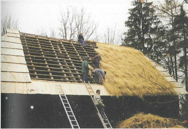
Abb. 1: Eindecken des Skorjanzstadels

Der Bericht für die volksskundliche Abteilung im Hause fällt für den Berichtszeitraum wie schon in den letzten Jahren leider kurz und bündig aus, jedoch mit einer großen Änderung und einem absolut positiven Lichtblick für die Zukunft. Dem Verfasser wurde mit Ende des Jahres 2002 ein wissenschaftlicher Mitarbeiter zur Seite