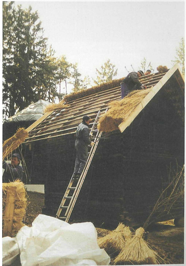
Abb. 2: Eindecken des Mörtlbauerkastens mit Roggenstroh

Im März wurde mit dem Aushub für den Keller des Bundwerkstadels begonnen. Hiefür mussten ca. 200 m 3 zum Teil felsiges Material abgebaut und verführt werden. Gleichzeitig mussten Künetten zum Unterbringen von Wasser, Kanal und Strom gegraben werden. Nach Verlegen der Leitungen und Rohre konnte die Fundamentplatte gegossen und kurz darauf mit dem Aufziehen der aufgehenden Mauern begonnen werden. Mit dem Aufbringen der Massivdecke und dem Einbau der Stiege konnten die groben Maurerarbeiten nach fünfwöchiger