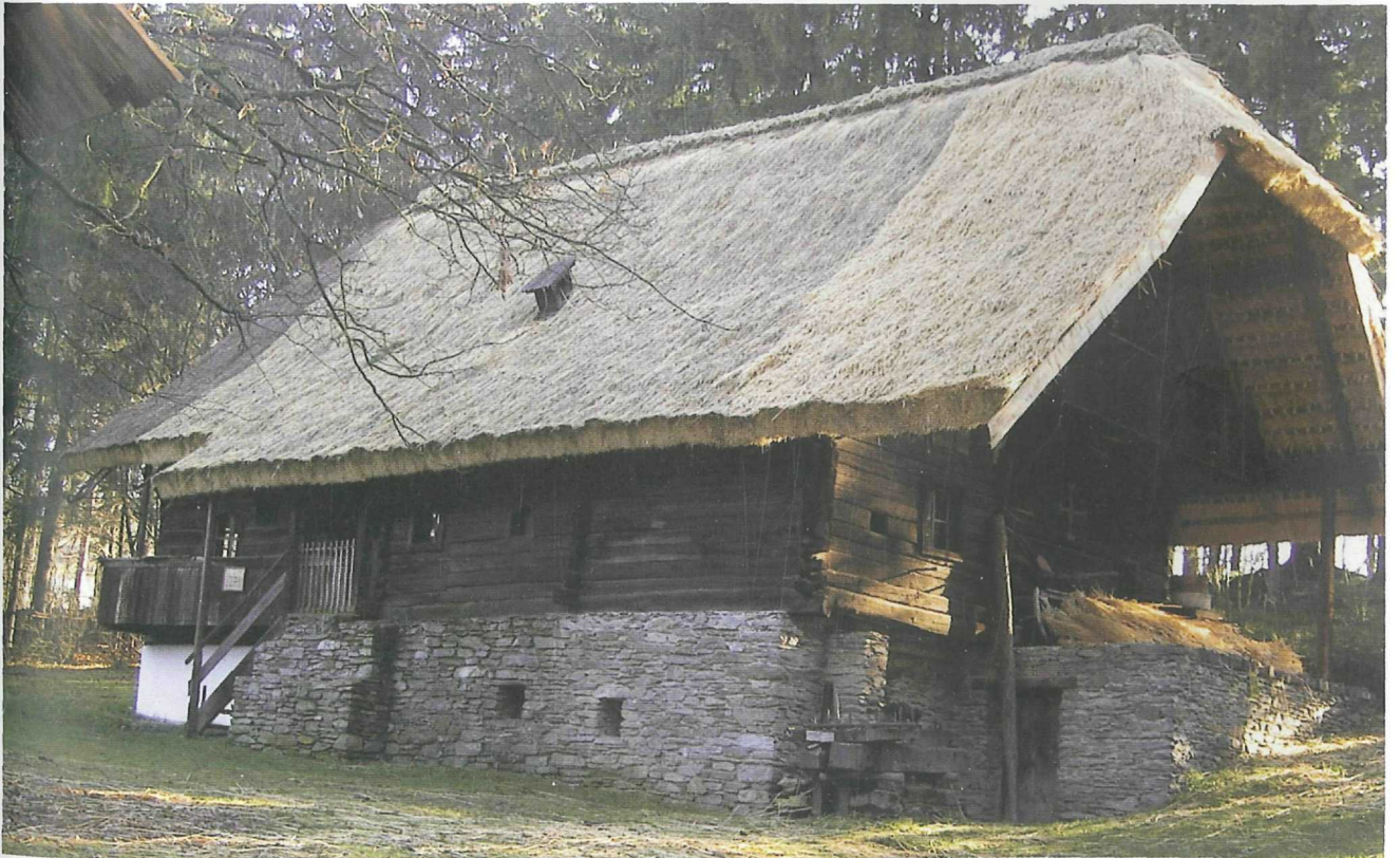
Abb. 7: Hanebauerhaus nach der Dachrenovierung im Herbst 2002