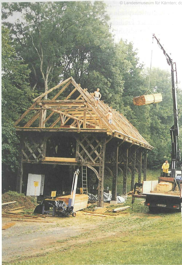
Abb. 3: Aufbau der Feldharpe aus dem Lavanttal

Arbeit abgeschlossen werden. Gleichzeitig wurde von einer Zimmerei der ehemalige „Lemischstadel“ in Eggen am Kraigerberg fachgerecht abgetragen, ins Museum überführt und dort bis zum Wiederaufbau zwischengelagert.