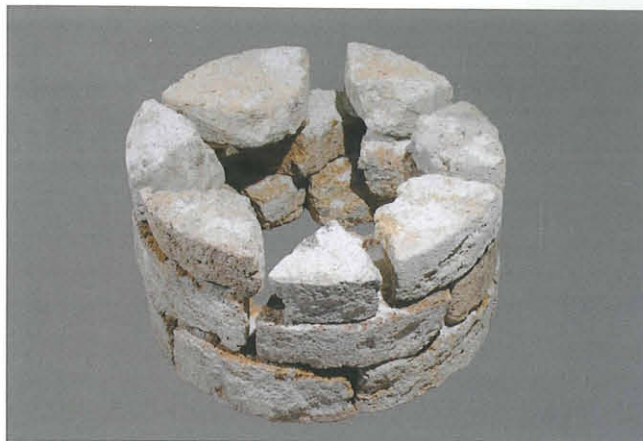
Abb. 9: Bestandteile der Kalktuffsäulen.

Nachstehender Befund konnte ermittelt werden: Westlich des Eingangs in die Magdalensbergkirche wurde ein antiker Felshorizont angefahren, auf dem noch Reste eines maximal 5 cm starken ortsfremden Lehmbo-