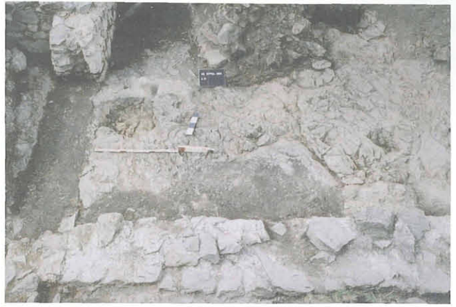
Abb. 5: Südwestecke des Raumes XI aus Süden.