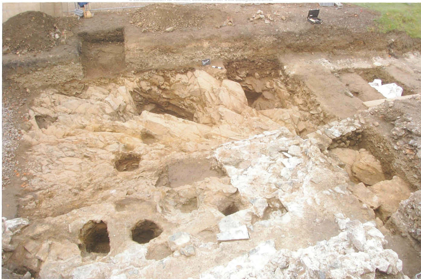
Abb. 8: Holzpfostenbau mit Felsgruben. Blick aus Osten.

Porticus 8 als auch an eine architektonische Gliederung durch weitere Räume denken. Als Dachlösung bietet sich somit ehest möglich ein West-Ost ausgerichtetes Satteldach an. Südlich des Gebäudes verblieb bis zur Befestigungsmauer mit Vorwerk ein 2–4 m breiter und nach Osten abfallender Freiraum.