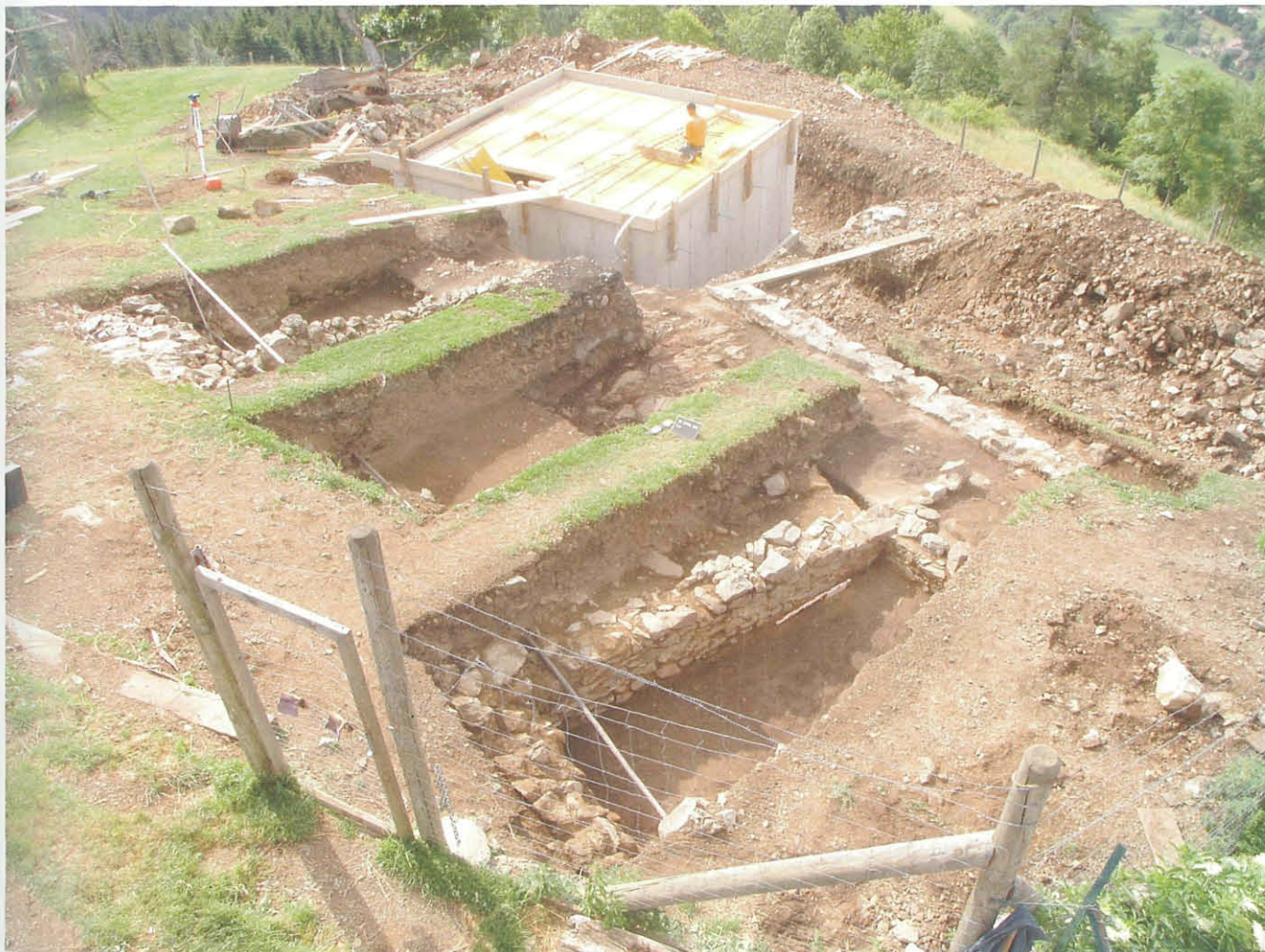
Abb. 1: Überblick über die Grabungsfläche und den Troadkasten Keller aus Nordwesten.

Die unter Gesichtspunkten des Landschafts- und Denkmalschutzes äußerst fragwürdige Errichtung eines zur Gästebeherbergung umgebauten und folglich zur Aufnahme von Sanitäreinrichtungen unterkellerten „Troadkastens“ auf den Parzellen 1264 und 1265/1 der KG