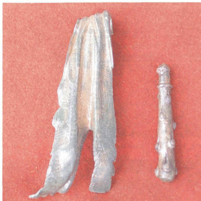
Abb. 6: Teile einer Herculesstatuette.

Der Nordwesten des Gebäudes, ein quadratischer Raum (R XI) mit einem lichten Seitenmaß von 6,6 m, konnte vollständig ergraben werden (Abb. 2 und Abb. 4). Die Süd-, West- und Ostmauer zeigen Stoßfugen und Fugenverputz, wohingegen die Südostecke des Raumes nicht mehr vorliegt. In der Westmauer blieb die 0,7 x 1,7 m große hölzerne Türschwelle anhand der Negativabdrücke ihrer Schwellhölzer im Mörtelbett noch deutlich erkenn-