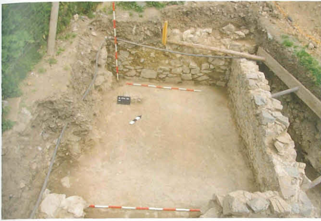
Abb. 3: Raum XIII aus Süden.