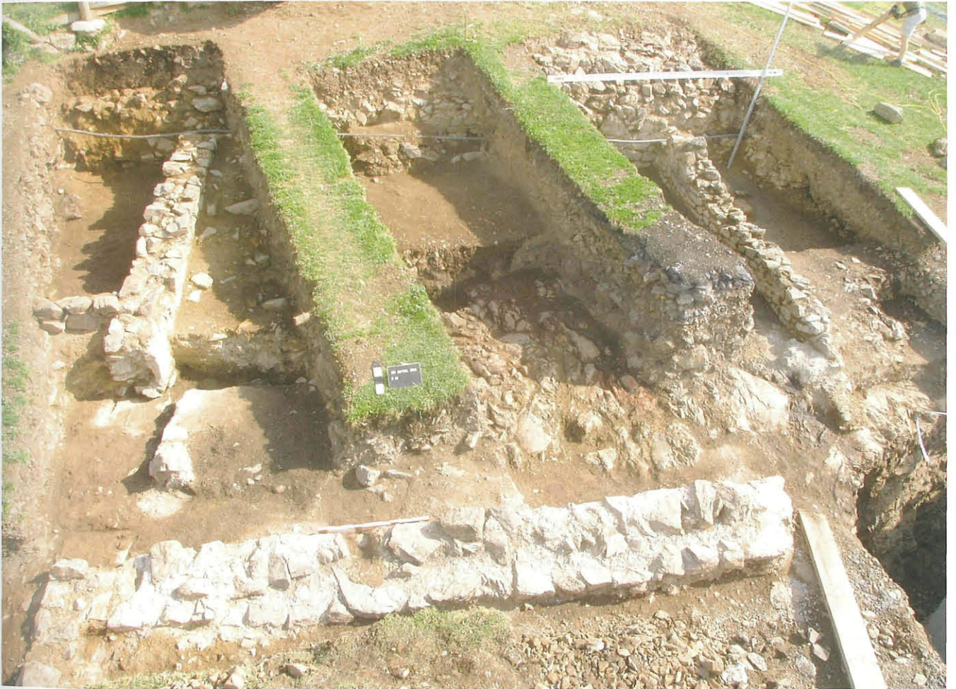
Abb. 4: Raum XI aus Südwesten.

schnitten im Jahre 2003 sondiert und fortan als Raum II der Gipfelbebauung geführt 5 .