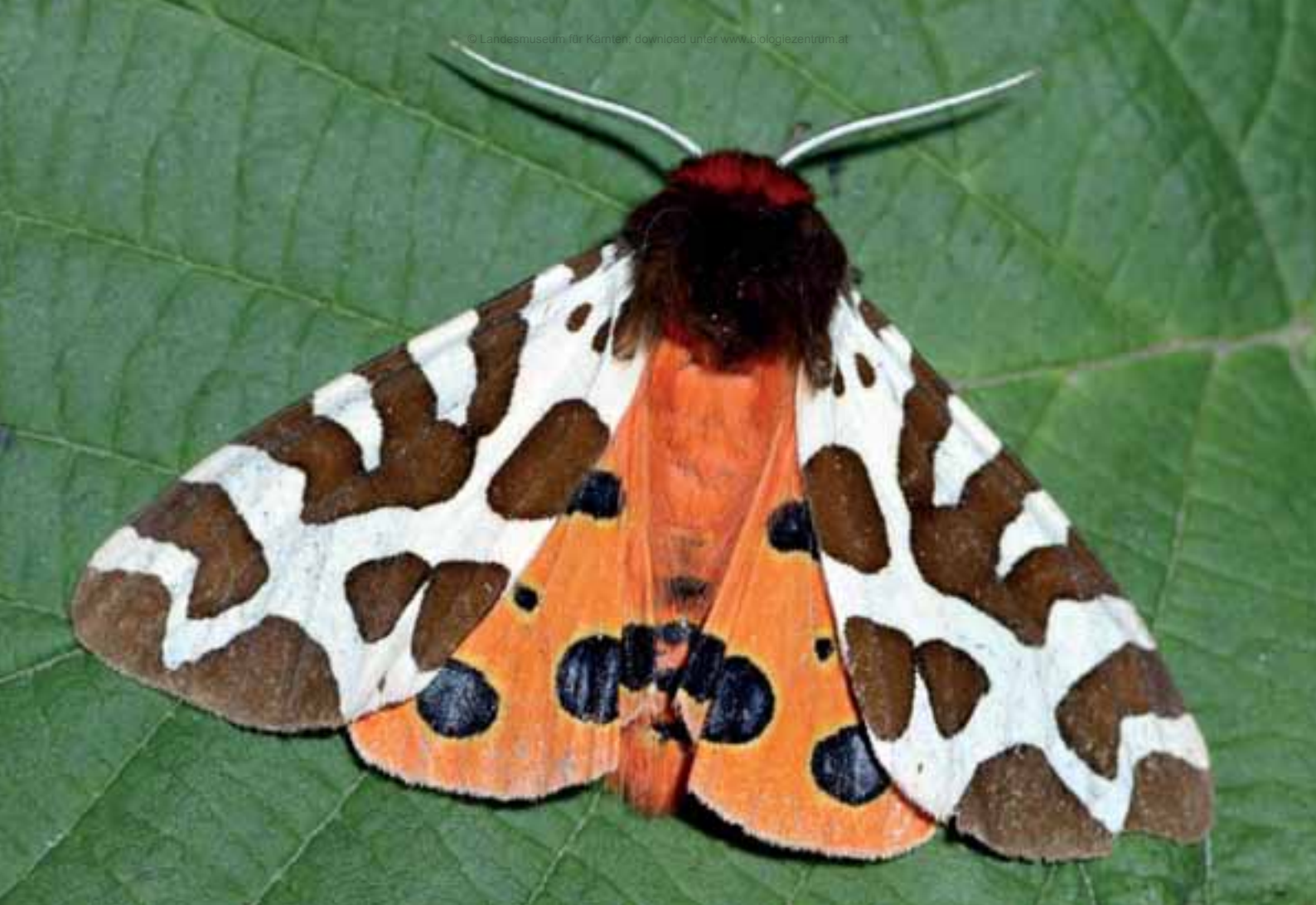
Abb. 1: Der Braune Bär ( Arctia caja ) kann als Charakterart von krautigen Fluren in Mittelgebirgslagen angesehen werden.