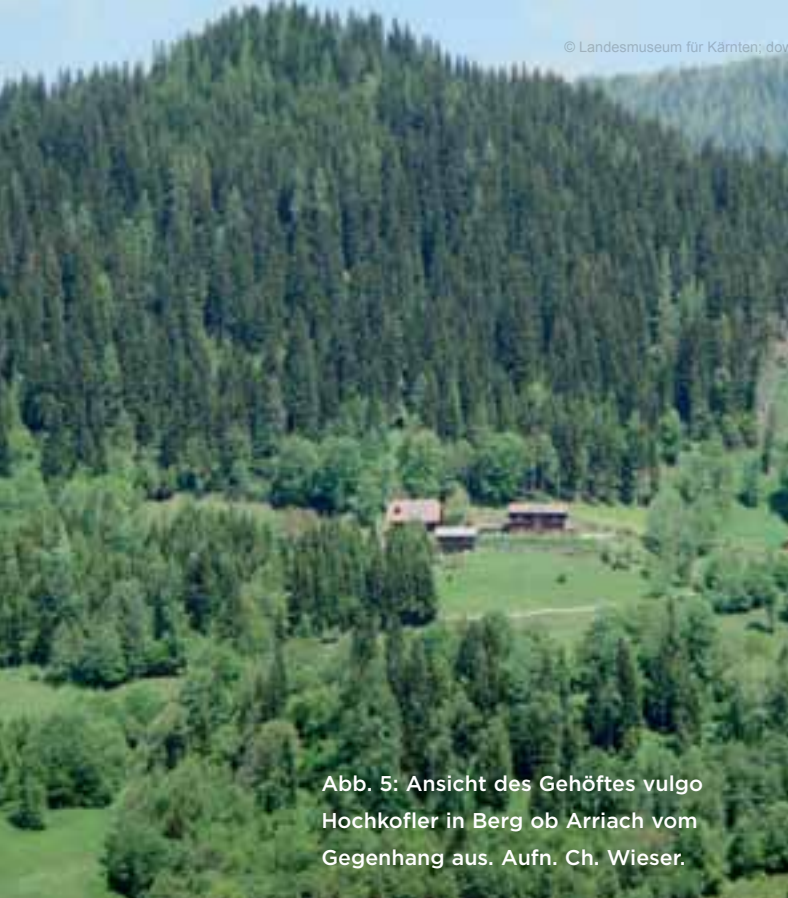
Abb. 5: Ansicht des Gehöftes vulgo Hochkofler in Berg ob Arriach vom Gegenhang aus.