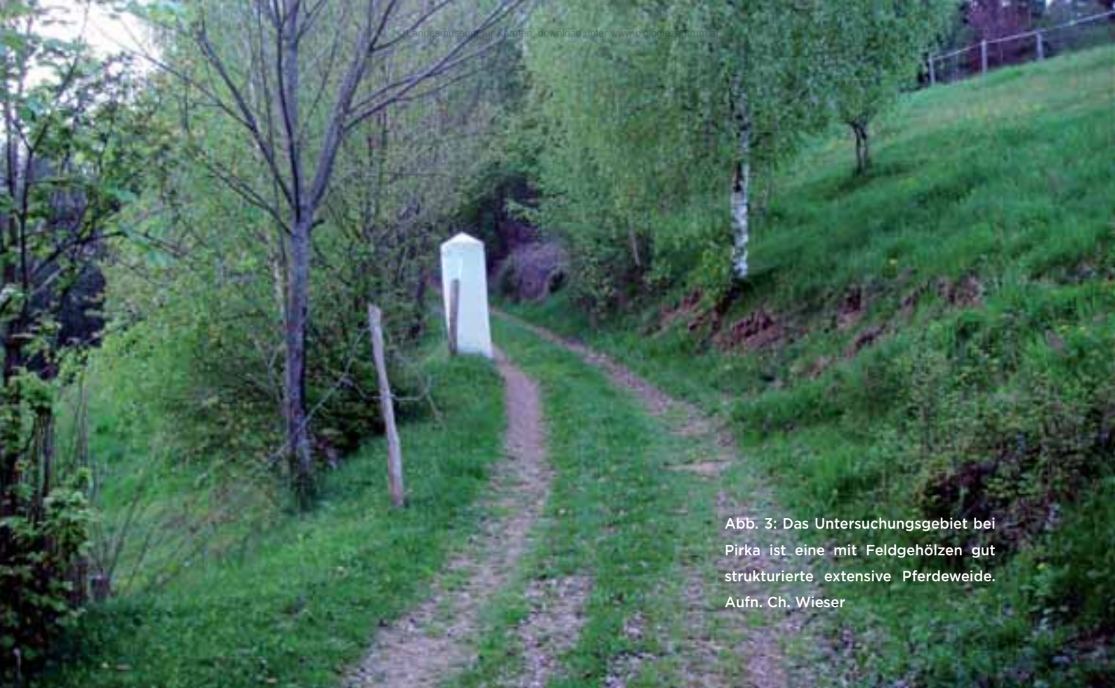
Abb. 3: Das Untersuchungsgebiet bei Pirka ist eine mit Feldgehölzen gut strukturierte extensive Pferdeweide.