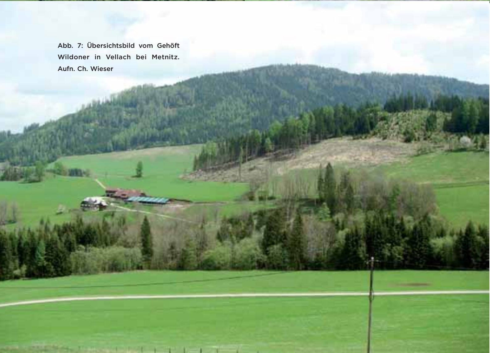
Abb. 7: Übersichtsbild vom Gehöft Wildoner in Vellach bei Metnitz.