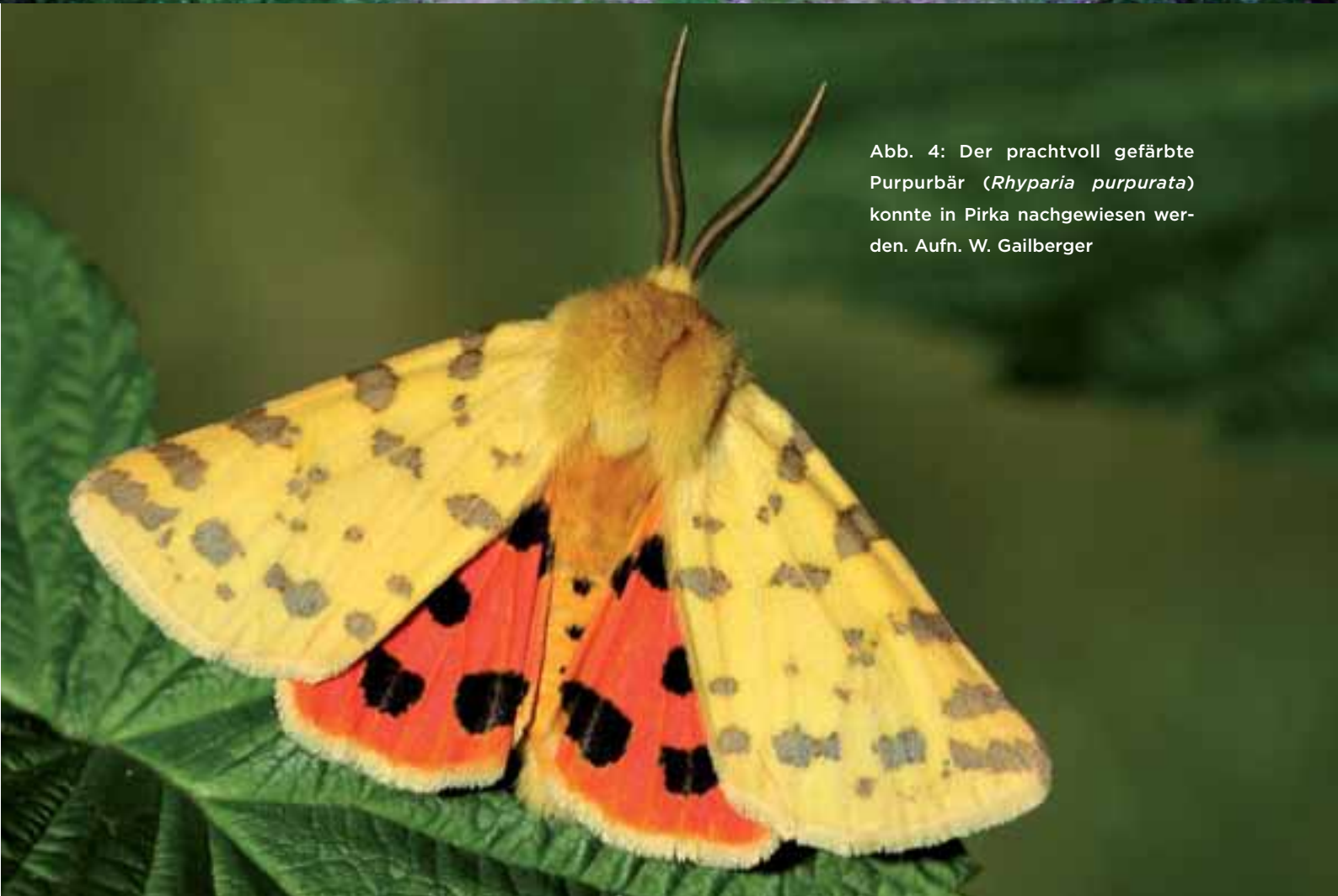
Abb. 4: Der prachtvoll gefärbte Purpurbär ( Rhyparia purpurata ) konnte in Pirka nachgewiesen werden.