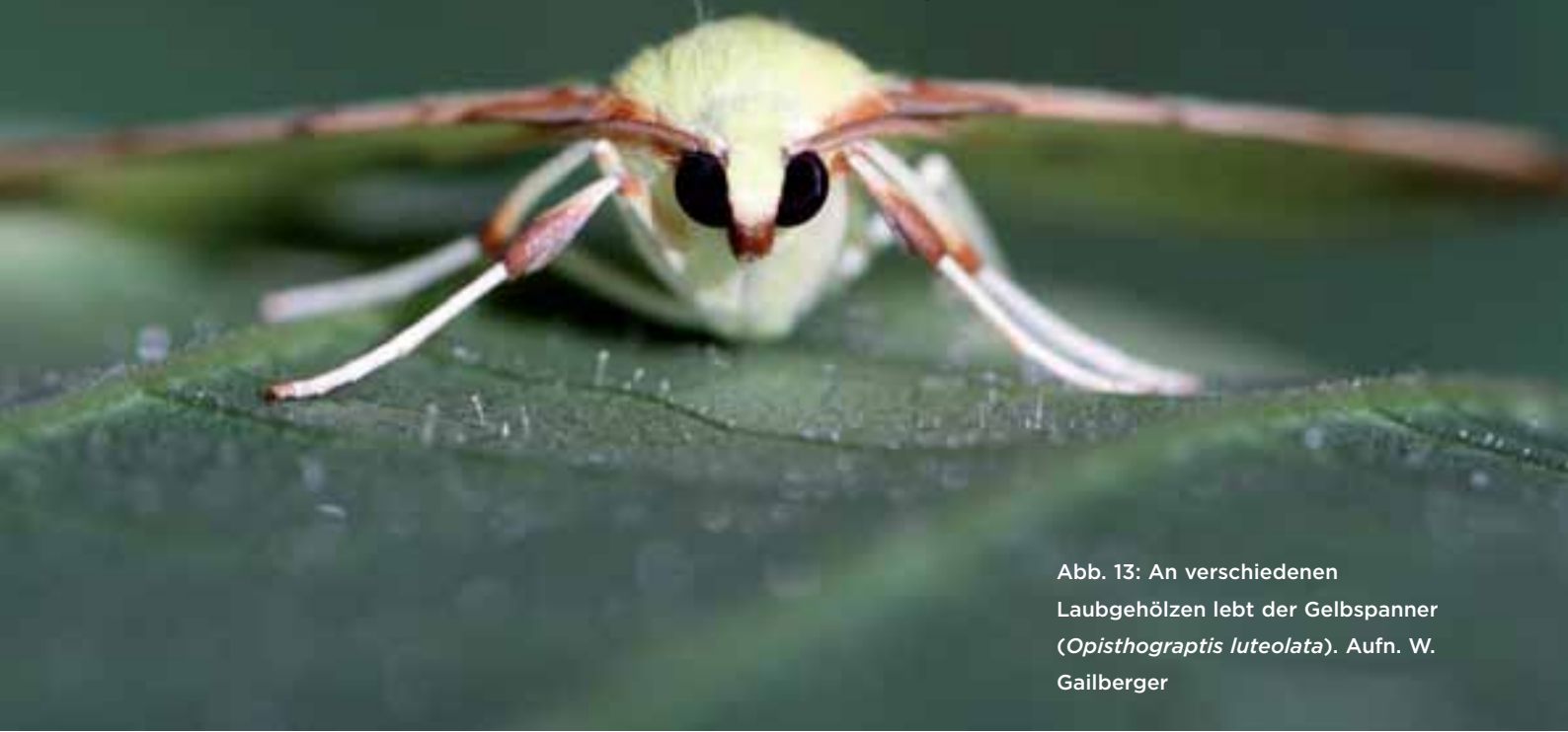
Abb. 13: An verschiedenen Laubgehölzen lebt der Gelbspanner ( Opisthograptis luteolata ).

widerspiegeln mit ihrem Artenspektrum typische montane Mittelgebirgslagen und füllen massive Lücken in den Verbreitungsbildern einzelner Arten auf. Extensiv genutzte landwirtschaftlich geprägte Kulturlandschaft bietet offensichtlich einer großen Zahl von Arten eine Überlebensmöglichkeit und beinhaltet auch so manche faunistische Überraschung, wie getätigte Landesneufunde unterstreichen.