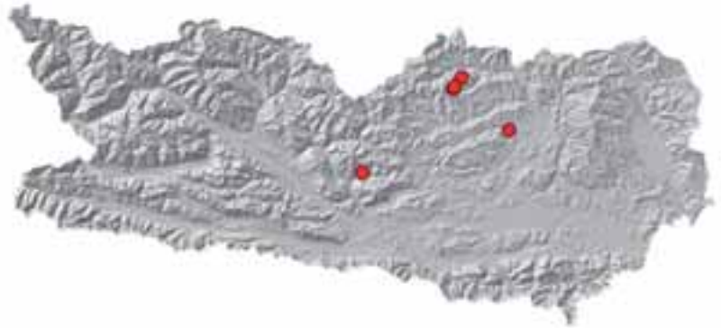
Abb. 2: Übersichtskarte von Kärnten mit den rot eingezeichneten Untersuchungsgebieten.

Zur Abdeckung „weißer Flecken“ in den Verbreitungskarten der Schmetterlinge Kärntens wurden in den Jahren 2010 bis 2012 drei Lebensräume in mittlerer Höhenlage als Erhebungsgebiete ausgewählt. Im Gegensatz zu den meist gut erforschten „hot spots“ der Biodiversität sind in den vermeintlich kommunen Lebensräumen große Wissenslücken festzustellen. Spezielles Augenmerk wurde dabei auf die Erfassung der Artengarnituren und auf Vertreter in Kärnten bisher