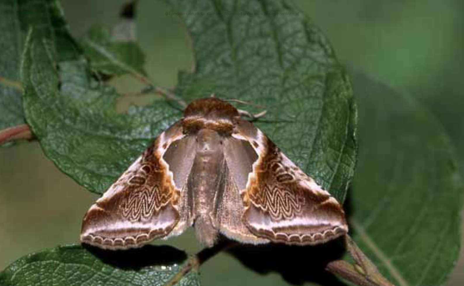
Abb. 9: Ein Schmuckstück an Farbe und Zeichnung ist der in allen drei Untersuchungsgebieten nachgewiesene Achat-Spinner ( Habrosyne pyritoides ).

Das Gehöft Wildoner liegt südlich von Metnitz im Streusiedlungsgebiet von Vellach an der Nordflanke der Gurktaler Alpen in einer Seehöhe von knapp über 1000 Meter. Im Anschluss an die als Grünland bewirtschafteten Flächen in Hofnähe wurde vor allem der feucht-schattige Grabenbereich eines Zubringers zum Vellachbach untersucht. Eine Überschildung von Grauerlen, Eschen und Bergahorn charakterisiert die ansonsten vorrangig krautige Vegetation im Unterwuchs. Ergänzend dazu erfolgten punktuelle Aufnahmen auf der südwestlich davon in einer Seehöhe von etwa 1370 m gelegenen Lameralm (Koordinaten 46°56'5.72"N 14°10'53.45"E).