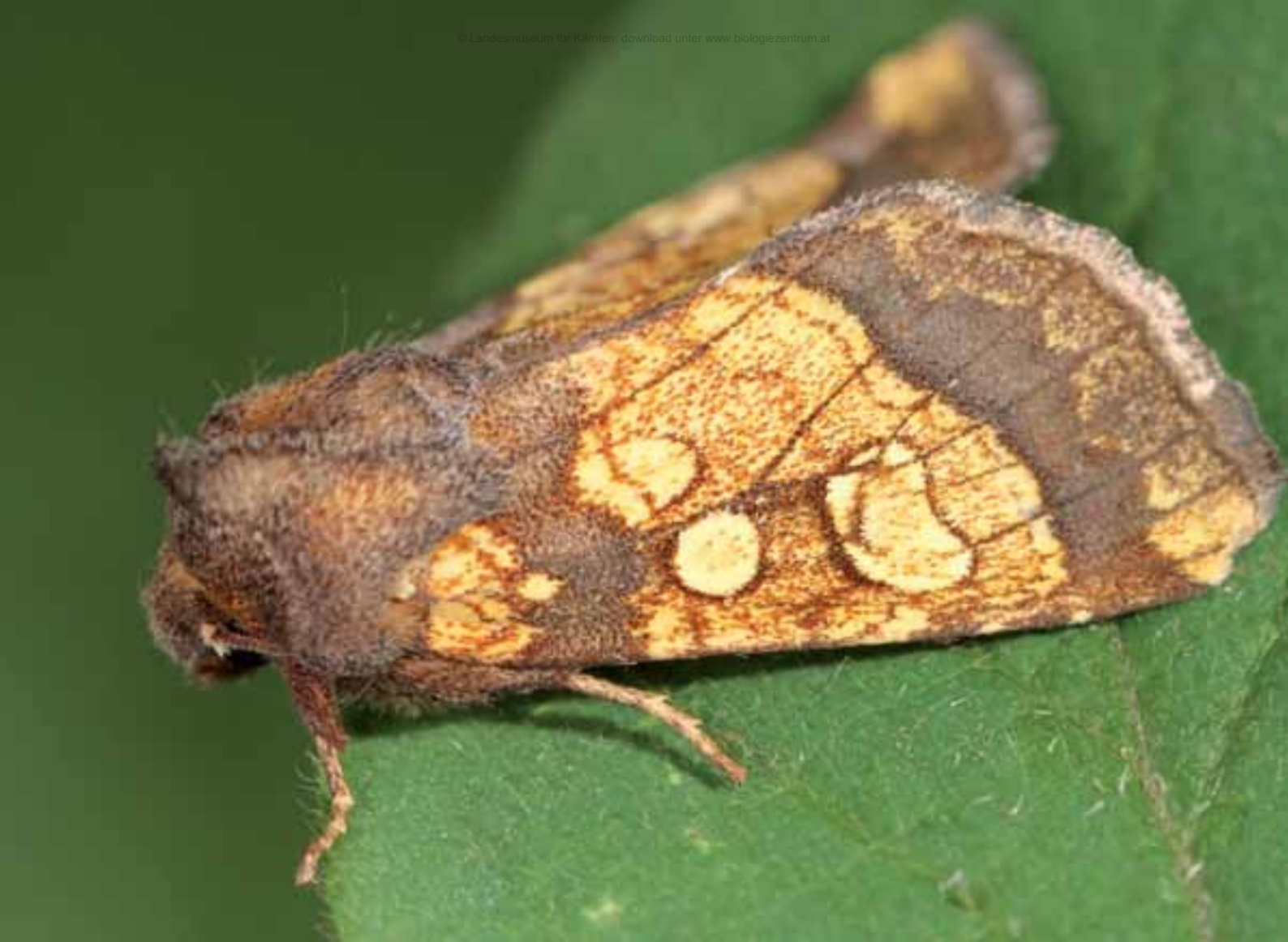
Abb. 8: Die Kletteneule ( Gortyna flavago ) findet im Raupenstadium als Stängelminierer gute Bedingungen im Graben südlich von vlg. Wildoner.

und Sträucher wird der Saum speziell durch Birkenbewuchs charakterisiert. Der Untersuchungsbereich umfasst die strukturierte Weide und den westlich angrenzenden Nadelmischwald. Die nur extensiv genutzte Weide weist einen hohen Blütenreichtum auf. Nördlich angrenzende landwirtschaftliche Flächen werden durch eine intensive Grünlandbewirtschaftung genutzt. Im Süden geht die Weide hangabwärts in Nadelmischwald über, östlich schließt die Ortschaft Pirka an. Insgesamt ist der Bereich als