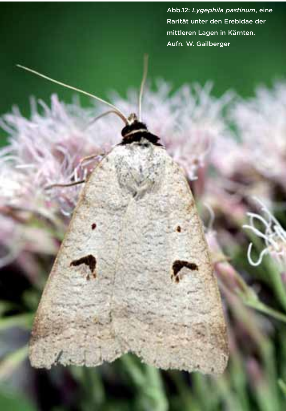
Abb.12: Lygephila pastinum , eine Rarität unter den Erebidae der mittleren Lagen in Kärnten.

In den letzten Jahrzehnten wurden für die Erstellung einer „Schmetterlingsfauna“ Kärntens das Hauptaugenmerk auf Sonderstandorte, sogenannte „hot spots“ der Biodiversität gelegt. Der Großteil der Landesfläche wird allerdings von faunistisch weniger spektakulären Gebieten eingenommen. Die drei vorgestellten Untersuchungsflächen