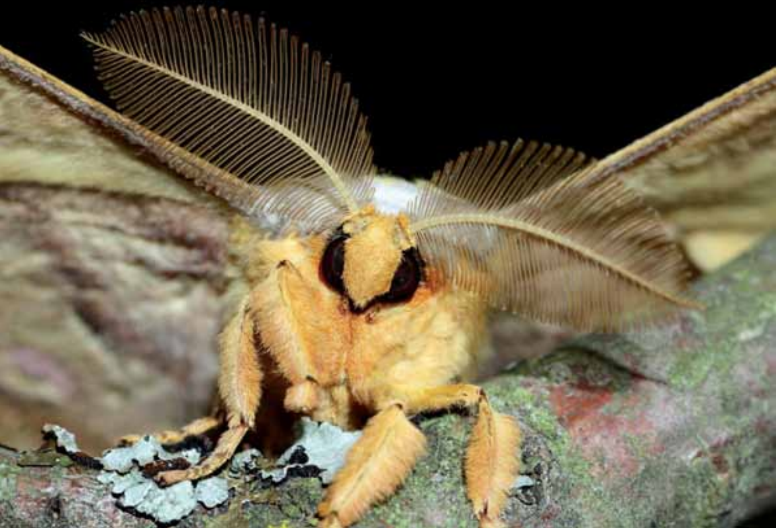
Abb. 10: Der Japanische Seidenspinner ( Antheraea yamamai ) findet bei Pirka seine derzeit nordwestlichste Ausbreitungsgrenze.

Erstnachweis der Art für Österreich zu werten. Die sichere Artzuordnung erfolgte über BOLD. Die Raupe lebt vermutlich an Cardamine (BENGTSON et al. 2011). Bezeichnend ist die Fundstelle der vor allem nördlich verbreiteten Art im Bereich eines versumpften Quellhorizontes mit Erlen und Eschenbestockung.