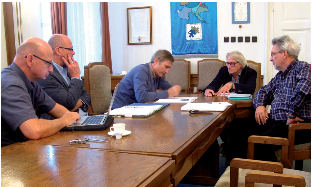
Abb. 5: Arbeitssitzung der Projektgruppe in Szombathely im Jahre 2017.

Gemeinsamen Bericht ihrem lieben Freund und Kollegen zu widmen. Mit dem Ausstieg Sloweniens erlitt die Gruppe den nächsten Rückschlag bei der Fertigstellung des Berichtes. Schließlich gelang es den verbliebenen Vertretern der Mitgliedsregionen Steiermark, Ungarn, Kroatien, Friaul-Julisch Venetien und Kärnten doch noch, die Arbeit zu Ende zu führen und im 5. Gemeinsamen Bericht über Tourismusarchitektur zu präsentieren. Die Publikation in fünf Sprachen und einem Seitenumfang von knapp 200 Seiten skizziert die Entwicklung der Tourismusarchitektur mit Aufkommen der Mobilität und dem Wunsch nach Ortsveränderung in der Freizeit. Auch wurde der Frage nachgegangen, ob und wie sich die Ausbreitung des Eisenbahnverkehrs auf den Tourismus ausgewirkt hat. Hat der Wunsch der Menschen nach mehr Mobilität dazu geführt, dass man in der zweiten Hälfte des 19. Jahrhunderts den Ausbau des Eisenbahnnetzes massiv vorantrieb, oder führte umgekehrt diese Entwicklung erst zum Aufkommen des Tourismus? Untersuchungen und Recherchen zeigen, dass diese Frage nicht so einfach zu beantwor-