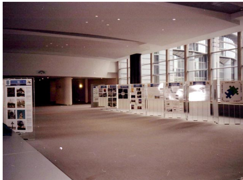
Abb. 2: Wanderausstellung der Projektgruppe Historische Zentren im Europaparlament in Brüssel im Jahre 1999.

Mit dem Beginn der Arbeiten zur Erstellung eines dritten gemeinsamen Berichtes zum Thema ländliches Bauen und Volksarchitektur wurde der Beschluss gefasst, den Vorsitz nicht mehr