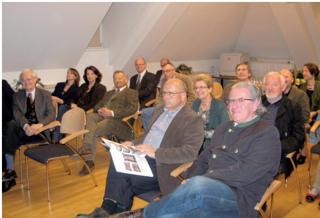
Abb. 4: Präsentation des 4. Gemeinsamen Berichtes im Sitzungssaal der Marktgemeinde Maria Saal.

Unter dem Vorsitz Kärntens wurden im Zuge der zweimal jährlich stattfindenden Tagungen viele Arbeitersiedlungen und -wohnstätten besichtigt. Diese Exkursionen trugen sehr viel zum gegenseitigen Verständnis bei und bestärkten die Teilnehmer in ihren Grundgedanken über die Wichtigkeit einer diesbezüglichen Dokumentation, da viele dieser Baudenkmäler zum Teil dem Verfall preisgegeben sind. Unter der Mitwirkung von Kärnten, Steiermark, Oberösterreich, Ungarn, Kroatien, Friaul-Julisch Venetien und Slowenien konnte der 4. Gemeinsame Bericht über die Arbeiterviertel und Arbeiterstädte zwischen 1750 und 1950 im Jahre 2011 mit einem Seitenumfang von 200 Seiten in sechs Sprachen der Öffentlichkeit präsentiert werden. Noch im selben Jahr wurde ein neues Projekt – es sollte das letzte der Projektgruppe Historische Zentren sein – in Angriff genommen, namentlich eine Untersuchung von Tourismus-