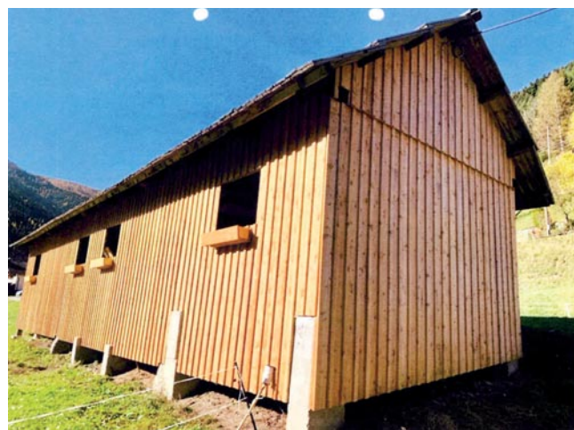
Abb. 2: Holzfassade eines Nebengebäudes in der Gemeinde Ebene Reichenau.

Das Jahr 2020 stellte auch für das Institut für Volkskunde eine besondere Herausforderung dar. Nach der Übersiedlung der Abteilung von Maria Saal nach Klagenfurt im Spätherbst 2019 wurde zum Beginn des Jahres das Büro eingerichtet und der Betrieb wieder aufgenommen. Mit dem Beginn der Corona Pandemie wurde den Mitarbeiterinnen und Mitarbeitern des Hauses empfohlen, ihre Tätigkeit ins Homeoffice zu verlegen. In dieser Zeit konnten viele Hundert Dias und Fotos katalogisiert werden und sind in der für diese Zwecke vor vielen Jahren eigens erstellten Access-Datenbank abrufbar. Da es für