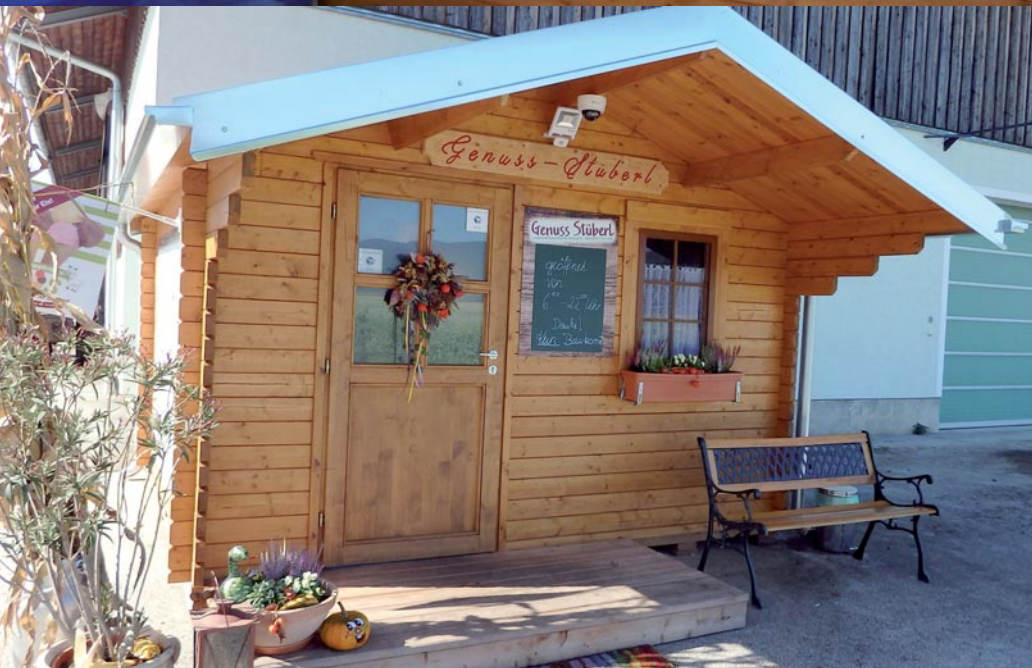
Abb. 4: Genuss-Stüberl Kucher und Innenansicht in Hollern, Gemeinde Pischeldorf.

markter einen Weg gefunden, ihre Produkte an den Mann/die Frau zu bringen, ohne selbst ständig anwesend sein zu müssen. Anhand von selbst erstellten Formularen wurden die Objekte auf ihre Infrastruktur bewertet, die angebotenen Produkte samt Produzenten aufgezeichnet und in Datenblättern und Tabellen dokumentiert, wobei sich die Erhebungen auf den Bereich Klagenfurt - Klagenfurt Land konzentrierten