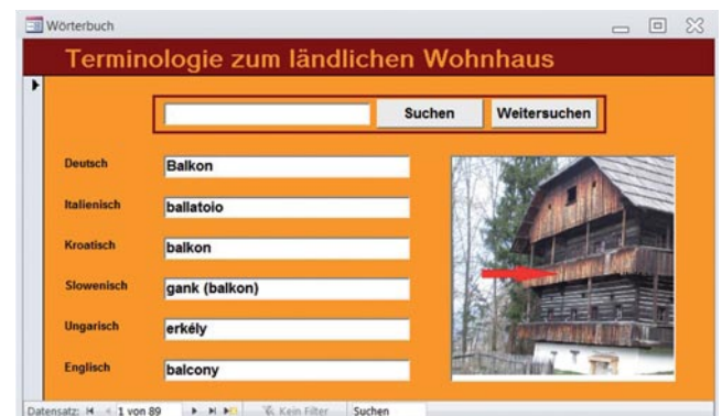
Abb. 3: Beispiel eines Begriffes aus dem Terminologie-katalog. © J. Schwertner

Im Zuge der Auswertungen hat Dr. Schwertner vorgeschlagen, die Ergebnisse in Form von Karten darzustellen, um diese auch grafisch besser verständlich darzustellen. Somit war es möglich, verschiedene Gebäudeelemente über den gesamten Alpen-Adria-Raum darzustellen und wissenschaftliche Schlüsse daraus zu ziehen. Weiters wurde vom Verfasser ein Katalog von Fachbegriffen erstellt, der vor allem Übersetzern die Arbeit erleichtern sollte. Dieses Glossar ist auf der Homepage der Alpen-Adria-Allianz zu finden.