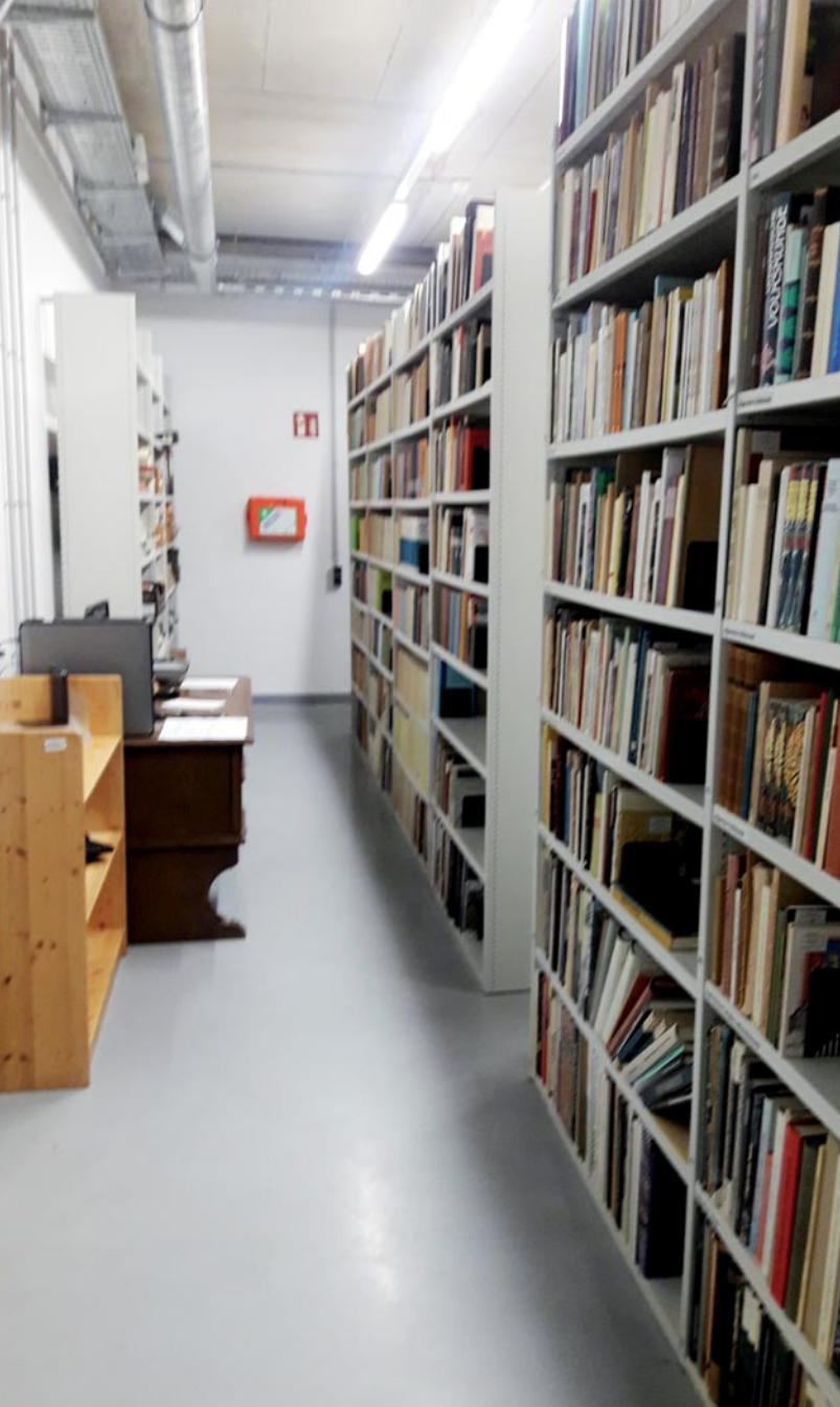
Abb. 1: Die Bibliothek Oskar Moser an ihrem neuen Standort im SWZ des Landesmuseums Kärnten.

die Fotothek leider nur sehr spärliche Unterlagen gibt, gestaltet sich die Katalogisierung zum Teil sehr schwierig, da die Diastreifen und Fotos zum Teil nur sehr oberflächlich beschriftet sind und es oftmals zeitintensiver Internetrecherchen bedarf, um die dargestellten Objekte eindeutig zuzuordnen zu können.