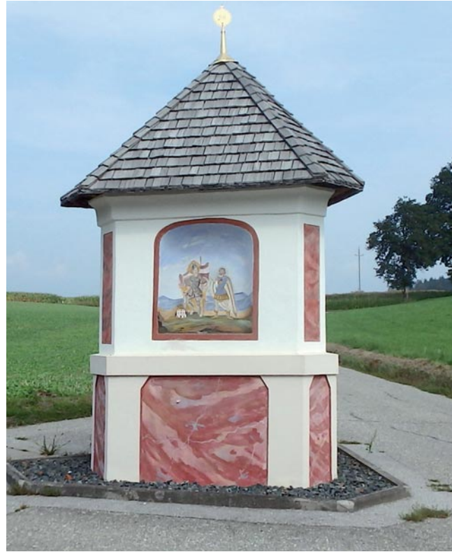
Abb. 3: Bildstock in Stuttern vor und nach der Renovierung. Aufn. J. Schwertner, 2008 bzw. 2020

Die Betreuung und Begutachtung förderwürdiger Projekte für den Verein Kärntner Holzstraße konnte im Berichtsjahr nur bedingt durchgeführt werden. Aufgrund der Ausgangsbeschränkungen war es leider nicht möglich, alle teilnehmenden Gemeinden zu bereisen und so wurde die Förderung vieler Projekte auf das Jahr 2021 verschoben. Nichts desto trotz konnten in den Gemeinden Sirnitz, Straßburg, Ebene Reichenau, Gurk und Weitensfeld wiederum interessante Objekte besichtigt werden.