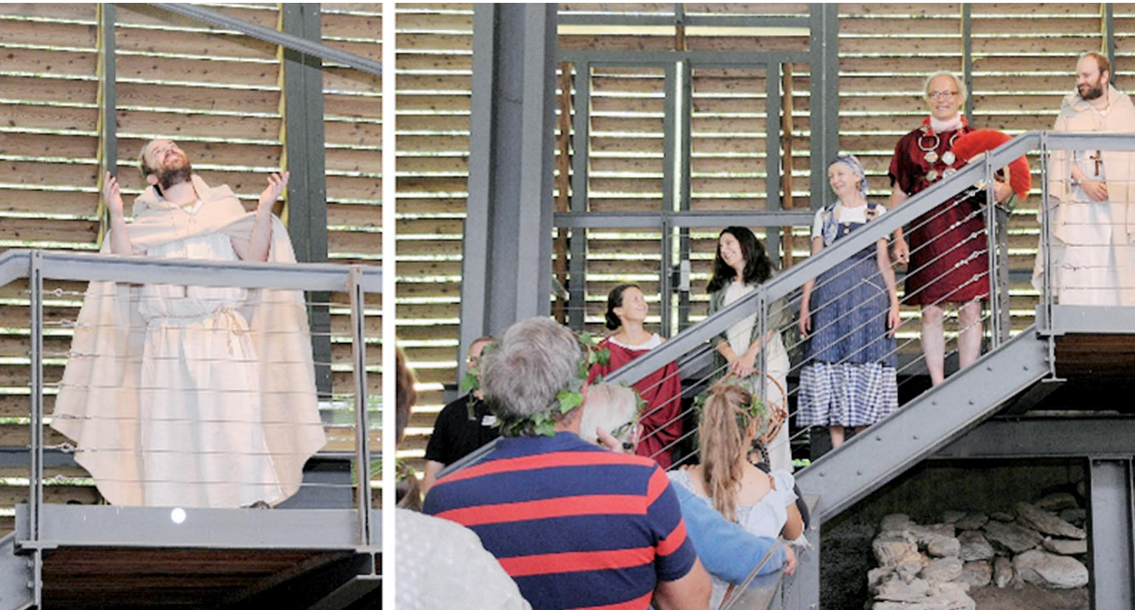
Abb. 5: Station 5 im Schutzbau der Bischofskirche.

dreifach werden. So durfte das Team der Abteilung für Vermittlung trotz der gesetzlichen Beschränkungen über 60 BesucherInnen willkommen heißen. Der Mut der VermittlerInnen,