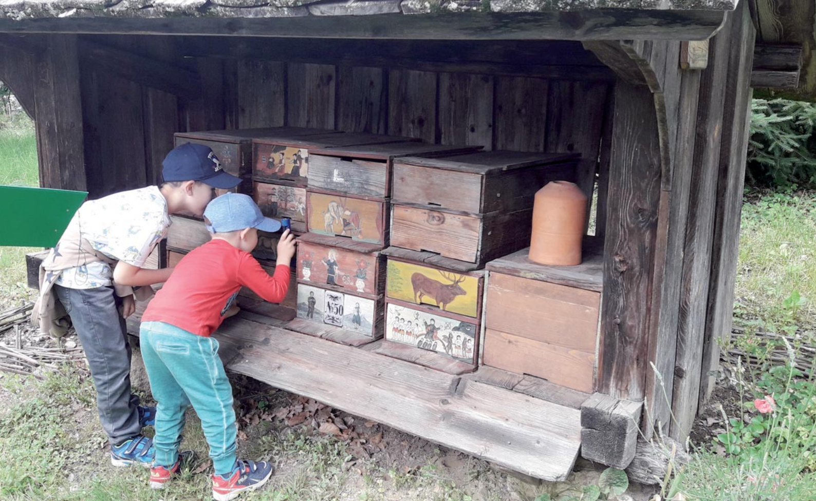
Abb. 4: Privater Probedurchlauf.

Gärten je nach Jahreszeit und Wachstumsphase etwas unterschiedlich aus.