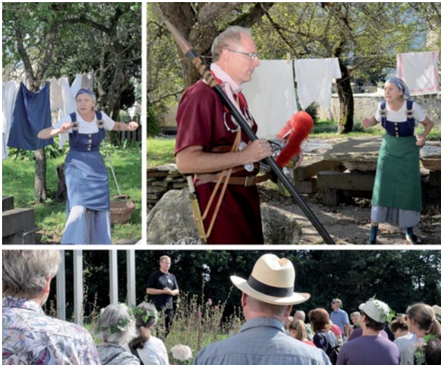
Abb. 3: Station 3 im Außenbereich des Museumsstadels.