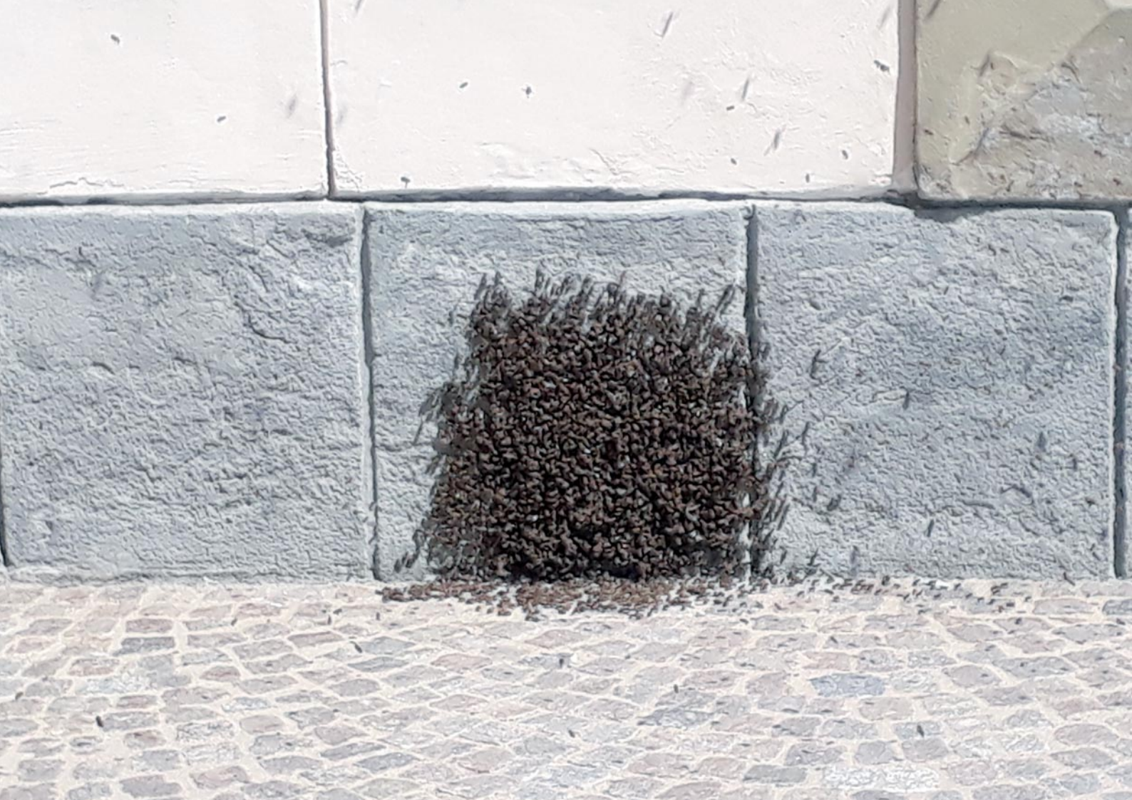
Abb. 3: Ausschwärmende Bienen zur Wiedereröffnung des Wappensaales, Pfingsten 2020.

de. Zum Zeitpunkt des Festakts schien „Corona“ noch vor den Toren des Landes und noch nicht ganz angekommen zu sein. Einzig das Aufstellen zahlreicher Hand-Desinfektionsmittel-Spender für die Festgäste ist rückblickend betrachtet als „Auftakt“ für das zu deuten, was Menschen weltweit und den Museumsbetrieb im Wappensaal das gesamte verbleibende 2020er Jahr beeinflussen und auf nie dagewesene Weise verändern sollte.