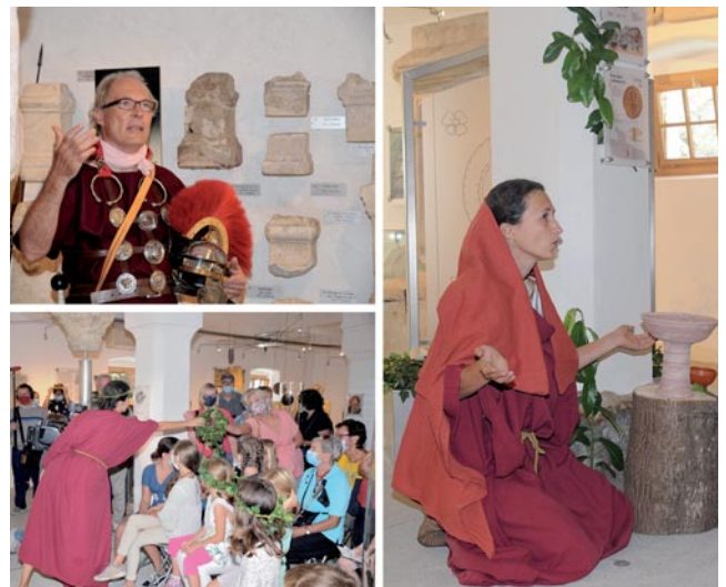
Abb. 2: Station 2 im UG des Römermuseums.