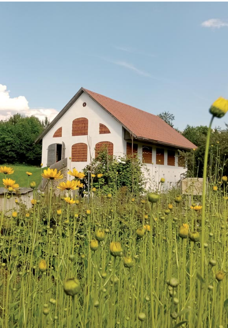
Abb. 1: Im Wandel der (Jahres)zeiten: Das Römermuseum im Sommer 2020, wie man es kennt.

Landesmuseums Kärnten überhaupt öffnen werden. Nur die zahlreichen Mauereidechsen, die im Umfeld des Kassensbereiches ihren Lebensmittelpunkt haben, zeigten sich völlig unbeeindruckt und begannen, wie jedes Jahr, mit den ersten wärmenden Sonnenstrahlen ihr aktives Leben. Doch ging es dann tatsächlich am 30. Mai auch in Teurnia, nach einigen wenigen Vorbereitungs-tagen, wieder in die neue Sommersaison. Mit ausreichend Desinfektionsmöglichkeiten und diversen Hinweistafeln für unsere BesucherInnen und einer neuen Plexiglasabtrennung an der Kassa, die zudem auch außen neu gestrichen wurde, sollten wir gerüstet sein. Und