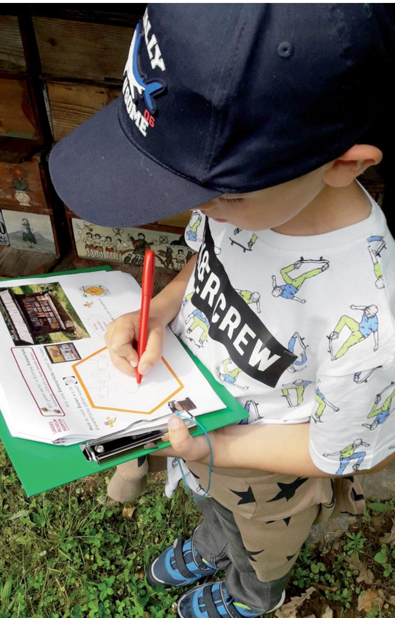
Abb. 1: Kind zeichnet eine Antwort.

Das Freilichtmuseum Maria Saal zählt zu den attraktivsten außerschulischen Lernorten Kärntens. Neben der langjährig erprobten Rätselrallye „Der Schatzjäger“ für jüngere und ältere BesucherInnen werden im Freilichtmuseum zahlreiche Workshops zu spezifischen Themen angeboten und sehr gerne angenommen. Die Rätselrallye „Der Schatzjäger“ kann selbständig und ohne Begleitung durch Vermittlungspersonal im Gelände absolviert werden. MitarbeiterInnen des Teams der Abteilung für Vermittlung stehen für Fragen gern zur Verfügung. Die Auflösung mit Hilfe einer Tabelle für die Entschlüsselung des Codes kann im Kassabereich bei den KollegInnen erfragt und durchgeführt werden. Als Belohnung gibt es für die TeilnehmerInnen das spannende Wühlen in der Schatzkiste – ein bunter „Edelstein“ kann gefunden und mit nach Hause genommen werden. Die angebotenen Themen-Workshops, die sowohl im Freigelände als auch im Seminarstadel abgehalten werden, ermöglichen interessierten BesucherInnen und/oder SchülerInnen einen lebendigen Wissenserwerb durch praktisches Arbeiten. Das heißt, dass in den Programmen einerseits Zeit gegeben ist, um Dinge erzählt und vor Ort gezeigt zu bekommen. Andererseits wird auch mit den Händen gearbeitet und gefertigt, um Gehörtes und Gesehenes in der Anwendung zu erproben oder in ein Werkstück zu bringen. Der hier beschriebene, neu entwickelte „Rätselhafte Rundgang“ möchte SchülerInnen Gelegen-