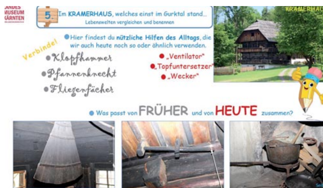
Abb. 2: Methodik und Originalfotos.

Rundgangs besprochenen Treff- bzw. Haltepunkte an. Die mögliche Gehroute ist zusätzlich eingezeichnet. Sollten sich mehrere Gruppen gleichzeitig im Gelände auf Tour begeben, so können die Treff- bzw. Haltepunkte nach Absprache mit den Betreuungspersonen und VermittlerInnen in der Reihung abgeändert werden. Die Arbeitsblätter können selbständig variiert werden und sind nicht zwingend aufeinander aufbauend. Dennoch wird bei jeder Arbeitsunterlage der Altersgruppe entsprechend darauf geachtet, dass der Einstieg in die Beschäftigung mit dem Thema „das Alltagsleben unserer Urururgroßeltern“ möglichst spielerisch und anregend ausfällt. Der zweite Teilbereich beinhaltet die eigentlichen Arbeitsblätter, die thematisch und bildlich auf die Objekte und Häuser des Freilichtmuseums abgestimmt und dementsprechend gekennzeichnet sind.