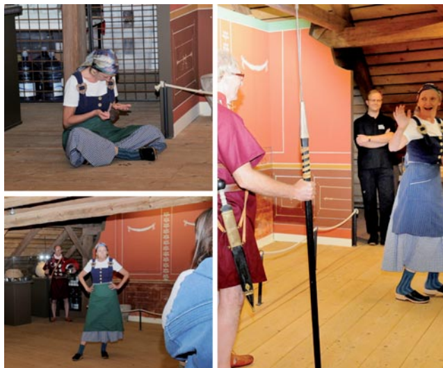
Abb. 1: Station 1 im OG des Römermuseums.

Trotz der Coronakrise und den damit verbundenen Vorgaben, die für alle im Besucherservice und in der Vermittlung tätigen MitarbeiterInnen eine Herausforderung sind, rief die Veranstaltung ein reges Interesse hervor. Im Vergleich zum Vorjahr konnte die Besucherzahl sogar ver-