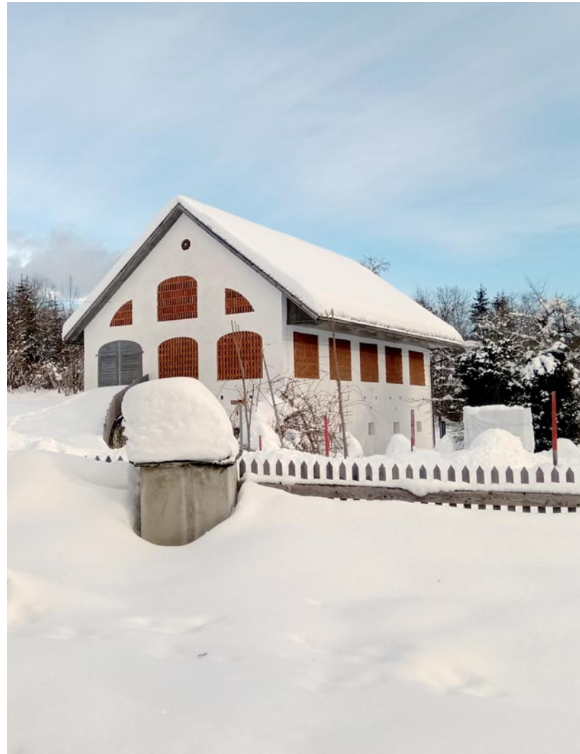
Abb. 2: Im Wandel der (Jahres)zeiten: Das Römermuseum im Rekordwinter 2020, wie es nur wenige Besucher erleben.