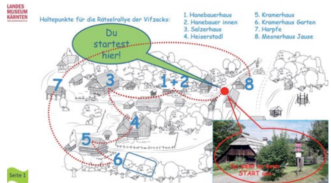
Abb. 3: Übersicht mit Haltepunkten.

Objektes zu verbinden und sich über die Anwendungsmöglichkeiten und Nutzung desselben untereinander auszutauschen. Der Orientierungssinn wird angeregt, indem Häuser betreten werden und die einzelnen Räume und Stallzellen gefunden und benannt werden sollen. Eine topographische Karte von Kärnten bietet älteren SchülerInnen die Gelegenheit, ihren Wohnort und Objekte aus dem Freilichtmuseum in der Karte zu verzeichnen.