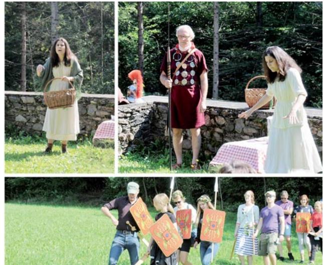
Abb. 4: Station 4 im Freiluftbereich der nahen Stadtvilla.