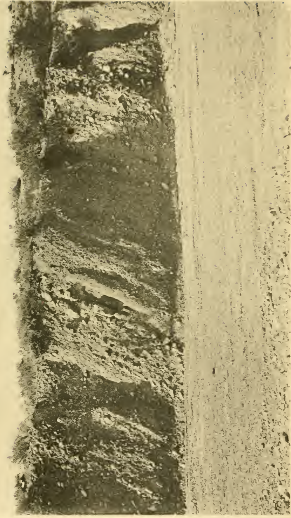
Lithdruck v. Max Jaffo, Wien

Stratigraphische Tabelle von Österreich (Paläozoikum bis Quartär) 1908