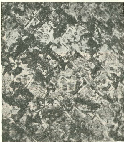
Fig. 2. Anschliff nach (100), geätzt mit rauchender HCl. Vergrößerung 60fach. Man sieht den Zonenbau der Teiloktaederchen, ihre regelmäßige Anordnung sowie die leeren Räume des Würfelbaues.

wieder nachsahen, ob dabei nichts weggerissen wurde. Solche Löcher sind in den Fig. 2 und 3 sichtbar; sie kamen in jeder Würfeltiefe zum Vorschein.