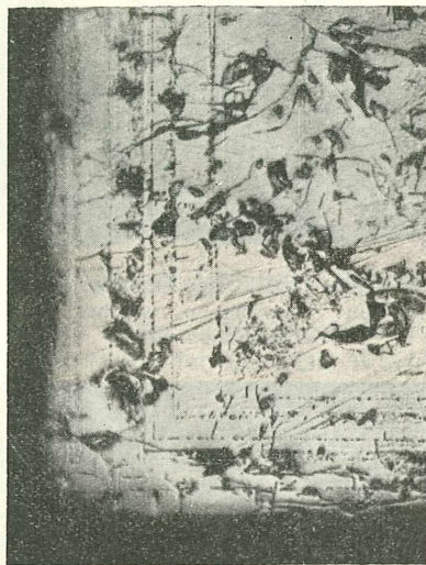
Fig. 3. Anschliff nach (100), geätzt mit rauchender HCl. Anwachszonenbau an einer Würfecke; auch die Löcher des Pseudomorphosengerüsts sind wieder zu sehen. Der Zonenbau setzt hier durch die Teiloktaederfluchten ungestört hindurch. Vergrößerung etwa 40fach.

Bei stärkerer Vergrößerung erkannten wir, daß sie von den Flächen der kleinen Magnetitoktaeder und deren Kanten begrenzt sind. Die Magnetitoktaederchen selber sind vollständig frisch, es