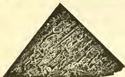
Burlington. Fig. 5.

die Abdrücke der im k. k. Hof-Mineralien-Cabinete aufbewahrten Exemplare Fig. 4 u. 5. Ich hatte das Auerbach'sche Tula-Eisen nur mit schwacher Ätzung, dann mit stärkerer versehen, so dass über die Natur der Masse kein Zweifel übrig bleibt. Das Burlington-Eisen war schon 1819 gefunden, aber grösstentheils zu Ackerbaugeräthen verarbeitet. Es hatte an die 150 Pfund gewogen, wurde aber bis auf etwa 12 Pfund verarbeitet, von welchen Herr Prof. Shepard in Newhaven noch ein Stück von 4 Pfund 10 Unzen besitzt. Das Schicksal der beiden Eisen war also ziemlich gleich, erleichtert vielleicht durch übereinstimmenden Aggregationszustand. Die Bestandtheile des Burlington-Eisens sind übrigens nach Rockwell Eisen 92.291, Nickel 8.146, Summe 100.437, nach Shepard Eisen 95.200, Nickel 2.125, unlöslich 0.500, Schwefel und Verlust 2.175 (Liebig und Kopp's Jahrbuch 1847—1848, S. 1309); der Anblick zeigt, dass verschiedene Stücke nicht nothwendig den ganz gleichen Gehalt besitzen müssen. Überhaupt sind aber die Stückchen des Burlington-Eisens im k. k. Hof-Mineralien-Cabinete viel reiner als das Tula-Eisen, und namentlich ohne das in feinen sandartigen Theilchen eingeschlossene Silicat.