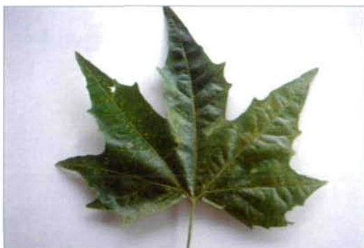
Abb. 3: Befallenes Platanenblatt, Oberseite mit typischer beginnender Gelbfärbung entlang der Blattrippen

Die Arten der Gattung Corythucha leben in ihrem natürlichen neotropischen bzw. nearktischen Verbreitungsareal an zahlreichen Pflanzenfamilien wie Fagaceae, Betulaceae, Hippocastaniaceae, Juglandaceae, Moraceae, Musaceae, Rosaceae, Tiliaceae, aber auch an Asteraceae, Euphorbiaceae, Malvaceae, Solanaceae und Urticaceae (WADE 1917). Nur zwei Arten ( C. ciliata und C. confraterna ) zeigen eine Bindung an Platanus- Arten, vorwiegend P. occidentalis , aber auch P. racemosa und P. wrighti .