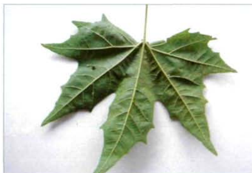
Abb. 4: Unterseite mit saugenden Corythucha ciliata an den Blattrippen

Die nun in Europa eingewanderte C. ciliata ist bisher auf Platanus occidentalis L., aber vorwiegend auch auf dem in Europa weitverbreiteten gepflanzten Hybriden (z.B. P. acerifolia WILLD.) beobachtet worden, es ist jedoch bisher kein sicherer Nachweis für die im Ostmediterraneanraum weit verbreitete Platanus orientalis bekannt geworden.