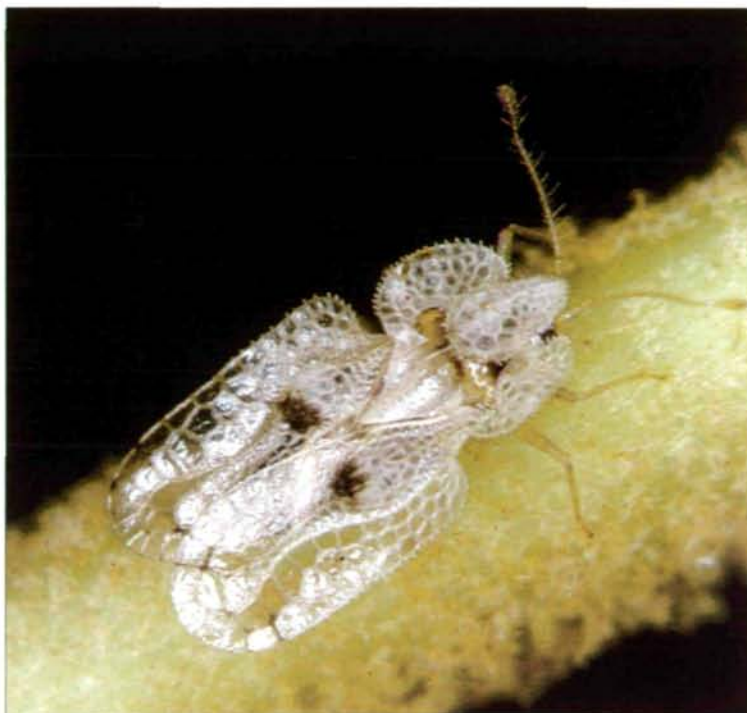
Abb. 1: Corythucha ciliata , Imago

Norditalien (BINAGHI 1970) und gelangt 1970 auf die Balkanhalbinsel, wo sie in Zagreb gefunden wird (MACELJSKI & BALARIN 1972a), erscheint dann 1972 bereits in Rijeka und Ljubljana (MACELJSKI & BALARIN 1972b) und ist 1973 in ganz Istrien vorhanden (MACELJSKI & BALARIN 1974). Nachweise aus der Po-Ebene, der Lombardei, Ligurien und der Toskana folgen (DIOLI 1975), aber auch aus Piemont (ARZONE 1975) Apulien und Calabrien (MONACO 1975).