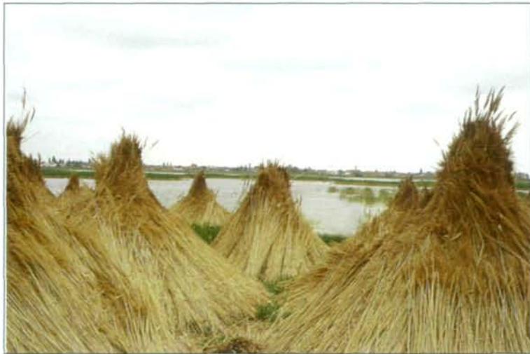
Abb. 5: Im Illmitzer Zicksee konnte im Mai 1995 der Anostrake Chirocephalus carnuntanus wiederentdeckt werden. [Der Holotypus (=Belegexemplar der Erstbeschreibung) dieser Art, die seit 1963 bei uns als verschollen galt, stammt aus Österreich (Parndorf, Bgld., 1877)].

Ein weiterer, ebenfalls in den Weißen Salzlacken vorkommender Feenkrebs, Chirocephalus carnuntanus , galt in Österreich bereits seit 1963 als ausgestorben (LÖFFLER 1993). Im April 1995 konnte der von BRAUER (1877) bei Parndorf im Nordburgenland entdeckte anostrake Urzeitkrebs in zwei Weißen Lacken des Seewinkels (Abb. 5) wiederentdeckt werden (EDER & HÖDL 1995). Über die Biologie des seltenen Chirocephalus carnuntanus ist bisher wenig bekannt; er scheint allerdings nicht ausschließlich auf Sodalacken angewiesen zu sein wie die beiden Branchinecta -Arten, da er auch in weniger salzhaltigen Gewässern vorkommt.