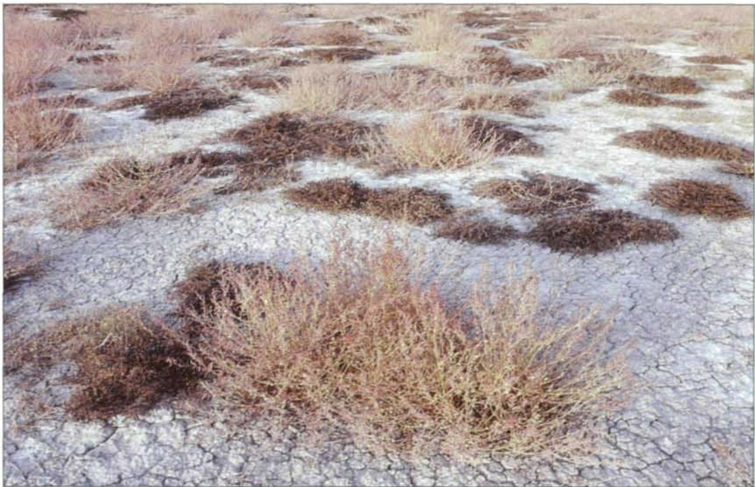
Abb. 1: Nur wenige Pflanzenarten, wie hier die Salzkresse Lepidium crassifolium sind an die salzigen Böden der austrocknenden Lacken angepaßt. 12.10.1990.

Das Gebiet des Seewinkels war vor rund 16 Millionen Jahren vom Urmeer Tethys bedeckt. Im Zuge der Alpenhebung kam es zu Absenkungsvorgängen und einer Trennung vom Weltmeer. Das entstandene Binnenmeer wurde ein Brackwassermeer und vertrocknete vor rund 3 Millionen Jahren endgültig. Weitere Absenkungsvorgänge führten dazu, daß die Donau