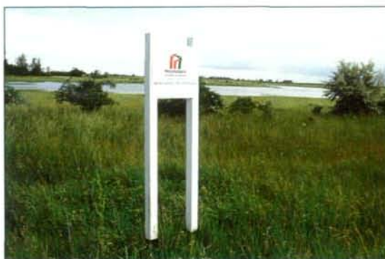
Abb. 9: Am 29.11.1992 wurde das Nationalparkgesetz beschlossen, am 12.2.1993 trat es in Kraft und am 24.4.1994 wurde der „Nationalpark Neusiedler See - Seewinkel“ offiziell eröffnet. Schilder und Aufseher („Ranger“) ermahnen die Touristen, auf vorgegebenen Wegen zu bleiben. Kleine Neubruchlacke, 2.7.1995.