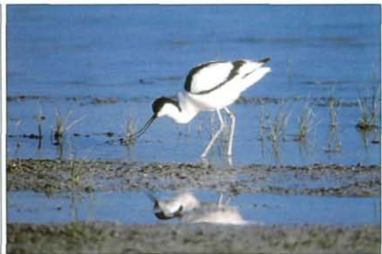
Abb 4: Der Säbelschnäbler ( Recurvirostra avosetta ) und andere Watvögel stellen mit Vorliebe den anostraken Urzeitkrebse der Gattung Branchinecta nach.

Säbelschnäbler seinen geschwungenen Schnabel durch das seichte Wasser (Abb. 4). Andere Arten ändern ihre sonst üblichen Verhaltensweisen der Nahrungssuche, um der Feenkrebse habhaft zu werden. WINKLER (1980) errechnete, daß ein Dunkler Wasserläufer ( Tringa erythropus ) pro Tag etwa 15.500 Kiemenfußkrebse fressen müßte, um seinen Kalorienbedarf zu decken.