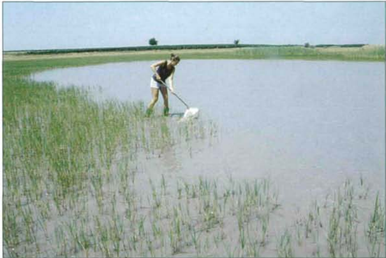
Abb. 7 (unten): Triops cancriformis in seinem Habitat (Kaiserlacke, 10.7.1995). Im seichten Wasser sind die Krebse eine willkommene Beute für Watvögel, die damit gleichzeitig für die Verbreitung der widerstandsfähigen Zysten („Dauereier“) sorgen.

Abb. 6: Die „Kaiserlacke“ südwestlich der Birnbaumlacke, 10.7.1995. Der hier vorkommende, bis zu 11 cm große Rückenschaler Triops cancriformis ist die größte heimische Urzeitkrebseart und tolerant gegenüber erhöhten Salzkonzentrationen und Temperaturen.