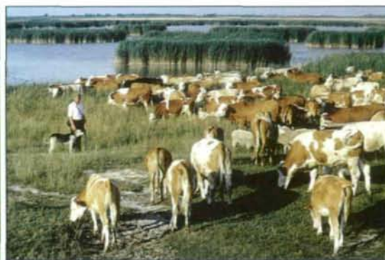
Abb. 10: Ein Rinderhaltungs-Projekt des WWF sorgt für die Erhaltung der Kulturlandschaft der „Hutweiden“ und ihrer zoologischen und botanischen Artenvielfalt.

Noch um 1855/58 belief sich die Fläche der Hutweiden des Seewinkels auf 6.310 ha, heute werden rund 815 ha, insbesondere im Bereich der Langen Lacke, wieder extensiv beweidet (Dick et al. 1994). Viehtritt und Beweidung halten die Ausbreitung des Schilfs in Grenzen und schützen damit auch die Vorkommen der Urzeitkrebse vor Beschattung und Verlandung.