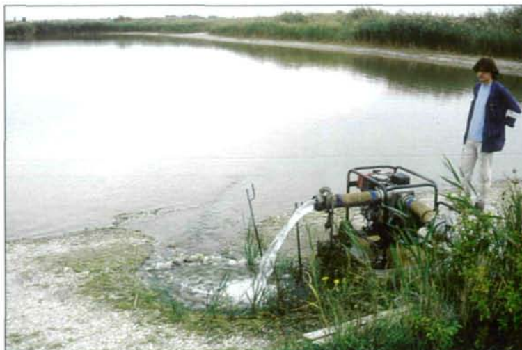
Abb. 8: Menschliche Eingriffe, wie hier Baggerung und künstliche Wasserzufuhr für die Fischzucht wurden zahlreichen Seewinkel- „Lacken“ und ihrer Fauna zum Verhängnis. Hernsee, 14.9.1995.

Schutzgebiete, sodaß zahlreiche brachliegende Flächen in Anlehnung an die traditionelle Wirtschaftsweise wieder beweidet werden konnten. Ein Rinderhaltungsprojekt des WWF in Apetlon (Abb. 10) sorgt heute für den Erhalt der „Hutweiden“ (der Name bezieht sich auf das Hüten der Viehherden), die eine außergewöhnliche botanische und zoologische Artenvielfalt beherbergen.