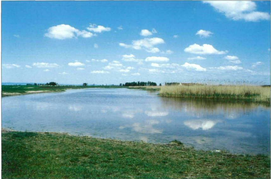
Abb. 2: Flache, alkalische und meist milchig-weiße „Lacken“ charakterisieren die Landschaft des Seewinkels. Westliche Wörthen-Lacke, 8.5.1994.