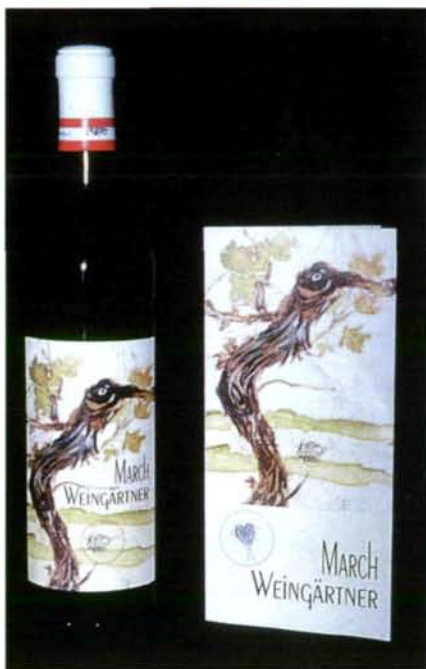
Abb. 11: Die Weinbauern an der March wählten die notostraken Urzeitkrebse ihrer Region ( Lepidurus apus und Triops cancriformis ) zu ihren Markenzeichen. Die seltenen Urzeitkrebse werden dadurch zusätzlich weiten Bevölkerungsteilen bekanntgemacht.

Zurecht, ist doch die Region der March-Auen mit 10 von 14 aktuell nachgewiesenen Arten Österreichs bedeutendstes Urzeitkrebse-Refugium. Mittlerweile können die „Urzeitkrebse“ bereits zu den Aushängeschildern der Marchregion gezählt werden.