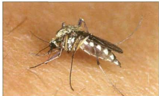
Abb. 9: Stechmückenweibchen benötigen für die erfolgreiche Ausbildung ihrer Eier eine Blutmahlzeit. In vorübergehenden, prädatorenarmen (z.B. fisch- und/oder molchfreien) Stillgewässern finden die aquatischen Stechmückenlarven ideale Entwicklungsmöglichkeiten, sodaß es gelegentlich - vor allem in den nährstoffreichen Auen- zu für den Menschen unerträglichen Massenauf-treten von Stechmücken kommen kann.