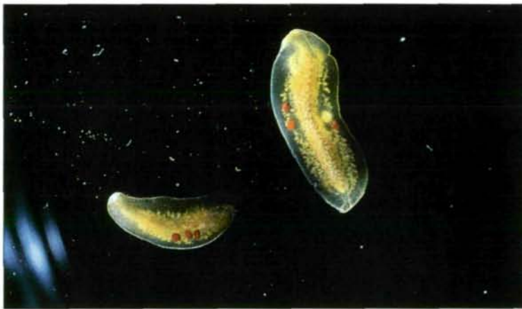
Abb. 5: An den beiden etwa 12 mm langen Individuen des rhabdocoelen Strudelwurms Mesostoma ehrenbergi sind bereits die für das Überleben der Trockenphase unumgänglichen dunkelroten Dauereier zu erkennen.