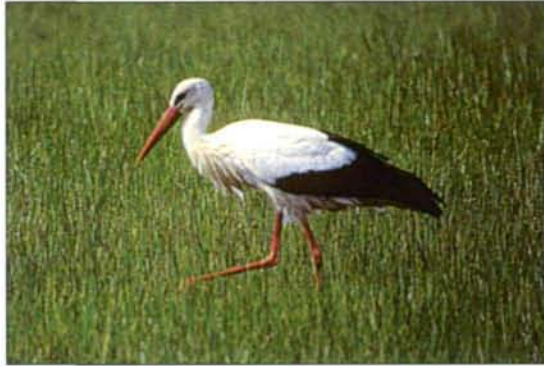
Abb. 7: Weißstorch ( Ciconia ciconia ). Lebensräume von Urzeitkrebse wie z. B. Überschwemmungswiesen sind wichtige Jagdgründe für diese gefährdete Vogelart. Illmitz, April 1995.

Ein Beispiel für eine allgemein beliebte und auch geschützte Tierart, deren Schutz aber vielerorts Probleme bereitet, ist der Weißstorch (Abb. 7). Im Burgenland wurden zwar zahlreiche Wagenräder als Nisthilfen auf den Häusern angebracht – die Storchbestände gingen aber trotzdem bedenklich zurück. Warum? Man hatte zu wenig beachtet, daß Störche nicht nur brüten, sondern auch fressen müssen: zahlreiche feuchte Wiesen und Senken, wichtige Nahrungsgebiete der Weißstörche, waren trockengelegt worden (RANNER 1995).