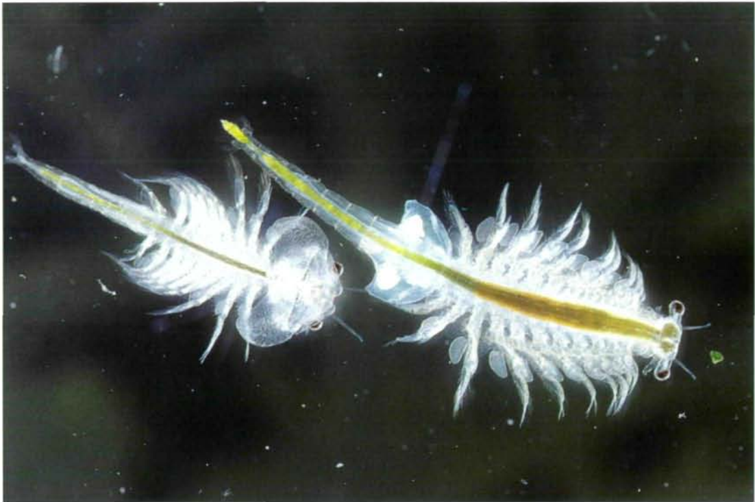
Abb. 1: Männchen (links) und Weibchen des Salinenkrebse Artemia salina . Salinenkrebse sind die wirtschaftlich bedeutendsten „Urzeitkrebse“. Ihre Dauereier werden kommerziell geerntet und getrocknet. Zwei Tage nach dem Übergießen mit Salzwasser schlüpfen die Larven („Nauplien“), die als Lebendfutter bei der Aufzucht mariner Nutz- und Zierfische und in „shrimp“-Farmen verwendet werden. Schätzungsweise werden weltweit jährlich an die 2000 Tonnen (!) Salinenkrebse-Dauereier umgesetzt.

gesetzt. Zahlreiche Aquarianer schätzen A. salina als Zierfisch-Lebendfutter – diese Form der Nutzung hat aber vergleichsweise nur verschwindend geringe wirtschaftliche Bedeutung.