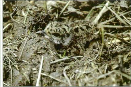
Abb. 8: Kiebitz ( Vanellus vanellus), Jungvogel. Kiebitze brüten vorwiegend am Rande astatischer Gewässer, wo die jungen Nestflüchter ausreichend Nahrung vorfinden. (Bei Zurndorf, Bgld.) 22.6.1995.