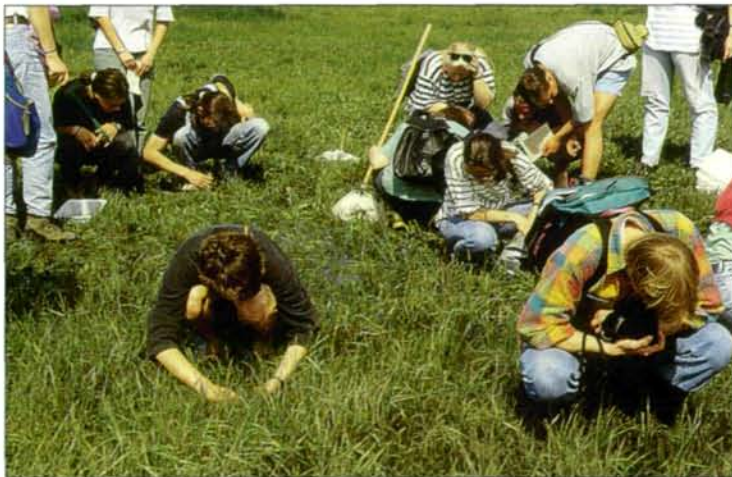
Abb. 2: Studentenexkursion des Zoologischen Instituts der Universität Wien zu den Urzeitkrebse-Tümpeln an der March. Dammwiese bei Marchegg. Bedeutendstes Vorkommen des spinicaudaten Muschelschalers Imnadia yeyetta in Österreich. 28.4.1994.

Die Ökologie der Urzeitkrebse ist ein hervorragendes Beispiel für Anpassung an extreme Umweltbedingungen. Seit 1970 werden alljährlich bei Lehrexkursionen des Instituts für Zoologie der Universität Wien in die March-Auen diese „Extremobionten“ als typische Vertreter