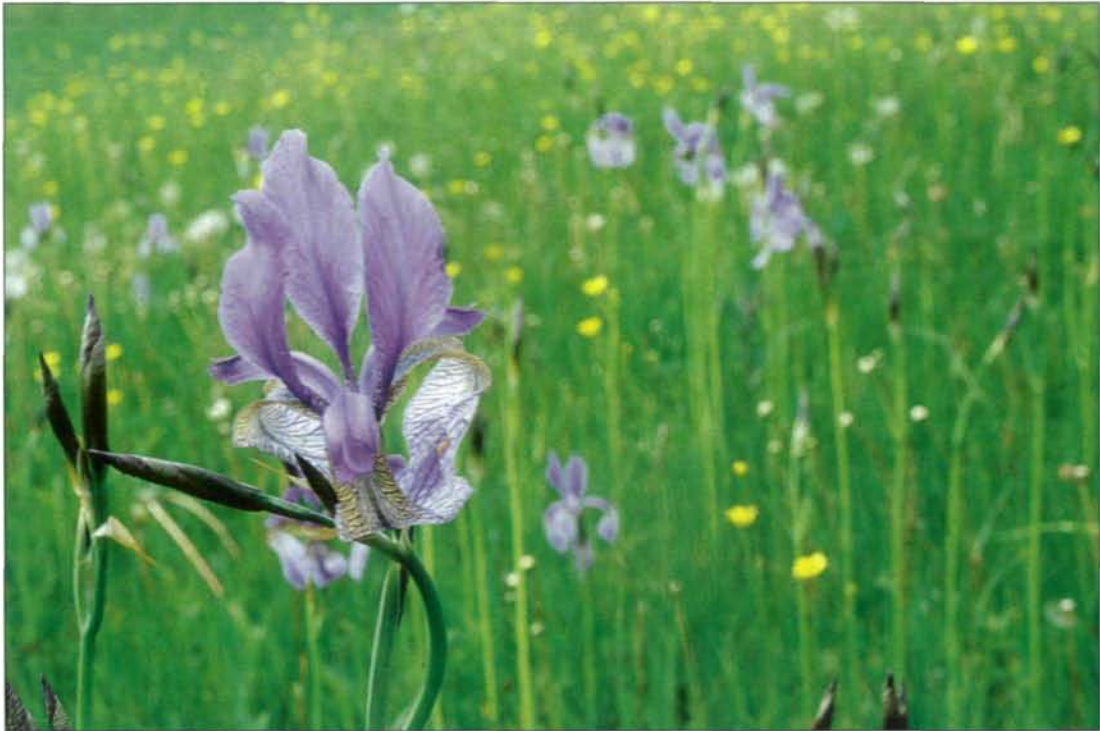
Abb. 3: Sibirische Schwertlilie ( Iris sibirica) auf einer überschwemmten Wiese, die zugleich der Urzeitkrebbsart Lepidurus apus als Lebensraum dient. Baumgarten an der March. 11.5.1994.

nun Schutzmaßnahmen für einzelne attraktive Arten gesetzt werden, also beispielsweise Naturschutzgebiete geschaffen werden, so profitieren davon nicht nur die Zielarten, sondern eine Vielzahl anderer, teils wenig bekannter und möglicherweise ebenfalls gefährdeter Tier- und Pflanzenarten (Abb. 3). „Umbrella species“ sind also sozusagen „Schutzschirme“ für andere Arten (NEWT 1993).