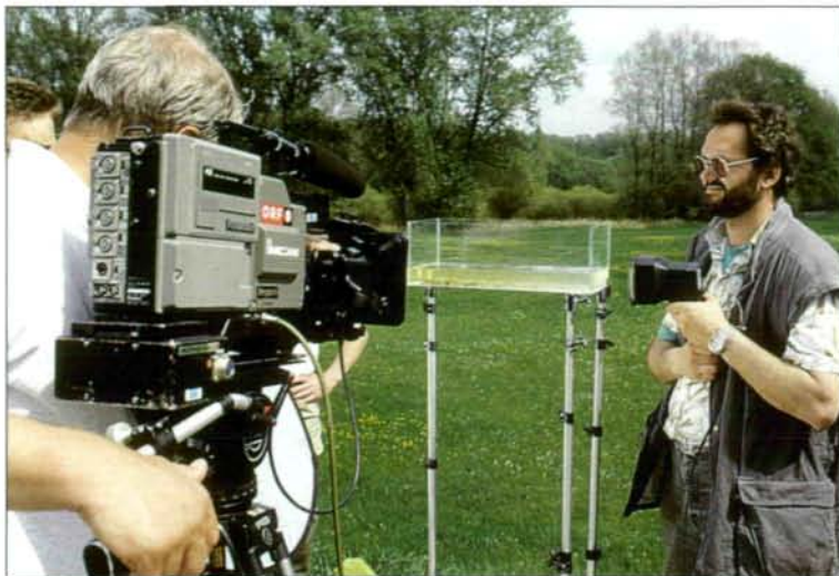
Abb. 10: Öffentlichkeitsarbeit ist notwendig, um erfolgreich Schutzmaßnahmen für scheinbar unattraktive Tiergruppen vorschlagen zu können. Aufnahmen von Lepidurus apus für die Wissenschaftssendung „Wissen aktuell“ am 4.5.1993 im Österreichischen Fernsehen (ORF), Marchauen, 30.4.1993.