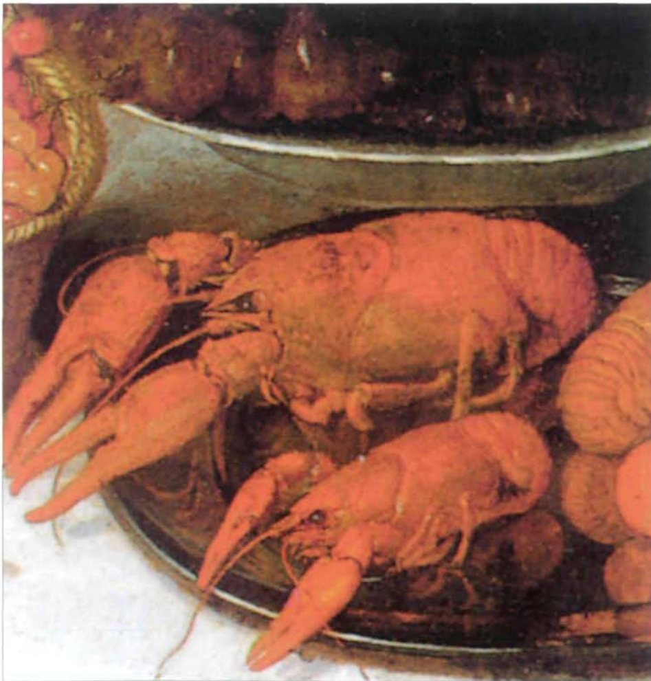
Abb. 1: Gemälde von Georg FLEGEL.

„Bei der Tafel wurden zuerst aufgetragen auf einer weiten Schüssel Hühnchen, genauer gesagt mehrere fette Hennen in Suppen, welche mit Eiern und Gewürzen hergestellt und gefärbt war. Mit kräftigen Appetite haben wir sie verzehrt, sodaß nur die Knochen übrigblieben. Zum zweiten hatten wir viele ausgezeichnete Fische in Wein gekocht; bei diesen griffen wir zu, als wäre es das erste Gericht gewesen. An dritter Stel-