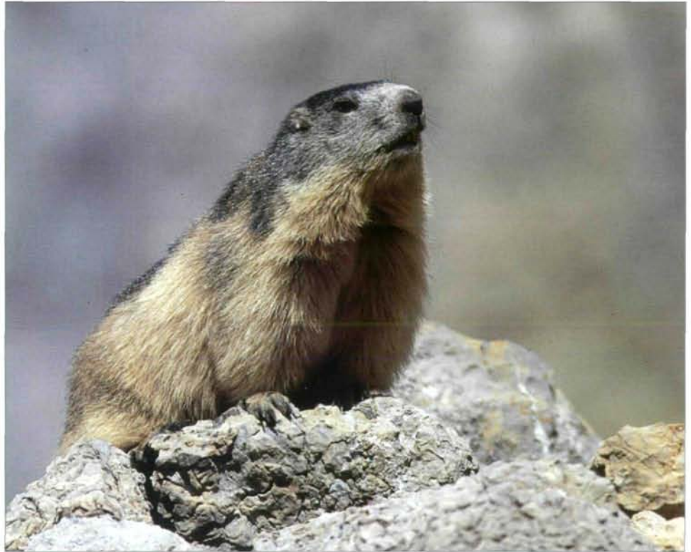
Abb. 4: Spanisches Alpenmurmeltier beim Sichern.

als eingebürgert und stuft es daher nicht in einer der Bedrohungskategorien ein. Da infolge der föderalistischen Organisation des Staates Wildtiermanagement eine Aufgabe verschiedener regionaler Regierungsstellen ist, kann jede Region ihre eigenen Gesetze erlassen und die nationale und internationale Naturschutzgesetzgebung anpassen. Jede der drei spanischen Pyrenäenregionen hat dem Alpenmurmeltier einen anderen Status zugeordnet. Navarra stuft es als eingebürgerte, nicht bedrohte Art ein. Aragon klassifiziert Murmeltiere als „von speziellem Interesse“. Katalonien hat es als jagdbare Wildart deklariert, verbietet aber die Jagd. Der jeweilige Status wird sich möglicherweise ändern, wenn sich in den nächsten Jahren die Dichte der Vorkommen erhöht und mehr Informationen über diese Art vorliegen. Zusammenfassend