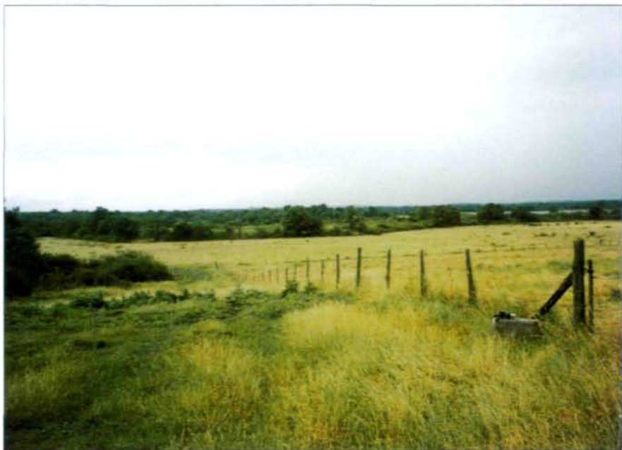
Abb. 1a, b: Die „Brenne“ ist eine vor allem für die Teichwirtschaft (a) und Viehzucht (b) genutzte natürliche Senke.

Schafzucht erlauben, sind die ursprünglichen Sumpfbereiche heute nur mehr in Relikten vorhanden. Aufgrund der wasserundurchlässigen Böden ergab sich eine Nutzung der Brenne für