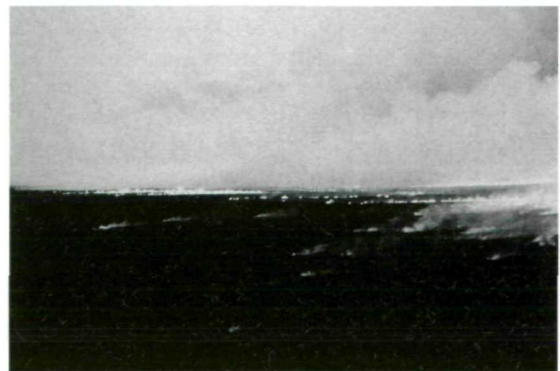
Abb. 2: Brände spielen seit jeher eine prägende Rolle für die Vegetation am Schießplatz Großmittel (ca. 1960).

„Es war eine glühende Hitze, als ich aus der Stadt (Wiener Neustadt, Anm.) ging, die (...) zu einem solchen Grad der Beklemmung stieg, daß ich nie so etwas erstickendes gefühlt habe. Der Wind, der mich anwehte, war ein Sirecco und dörte die Quelle meines Athems noch mehr aus. Es war, als trocknete das Mark in meinen Gebeinen, und meine Kniee wollten nicht mehr fort. (...); kein Haus, kein Baum bis vor Neunkirchen. Hier wäre ich beinahe verzagt und sehnte mich kindisch nach dem Turme, den ich nicht mehr ferne erblickte, wohin ich aber mit wankenden Knieen nur fortstümperte.“ (ARNDT 1801)