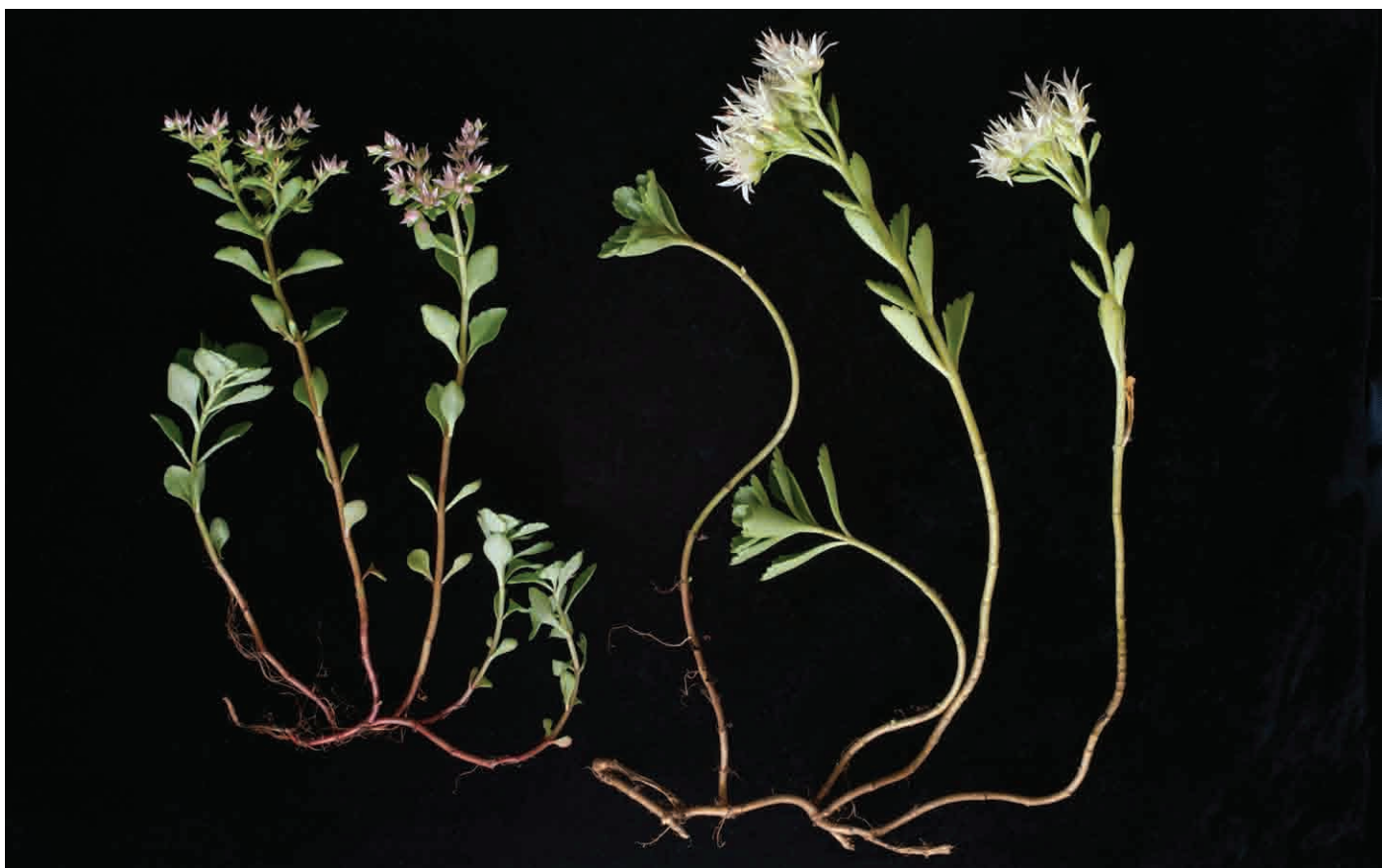
Abb. 7: Phedimus stoloniferus (links, von Lichtenberg) und weiß blühende Form von Phedimus spurius (rechts, von Pöstlingberg beide 6.7.2010).