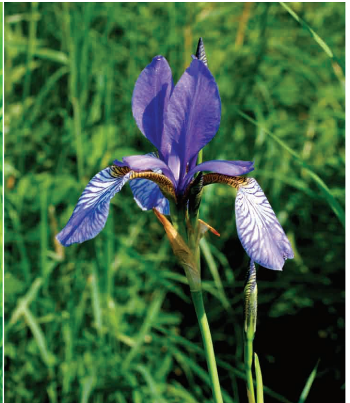
Abb. 3: Iris sibirica mit papierartig braunen Hochblättern und unscharf abgegrenztem weißen Farbfeld an den Perigonblättern (Feldaisttal in Kefermarkt 31.5.2011)