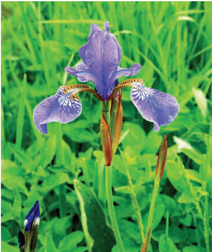
Abb. 2: Iris sanguinea mit grün bis rötlichen Hochblättern und scharf abgegrenztem weißen Farbfeld an den Perigonblättern (Hussenberg 7.6.2011).