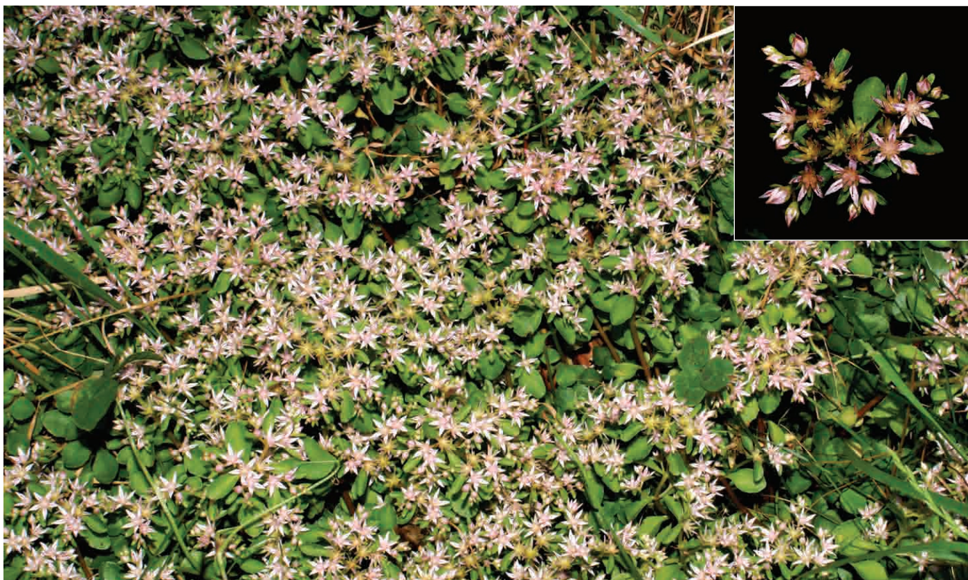
Abb. 6: Flächendeckender Bestand von Phedimus stoloniferus (Lichtenberg, 28.6.2010).