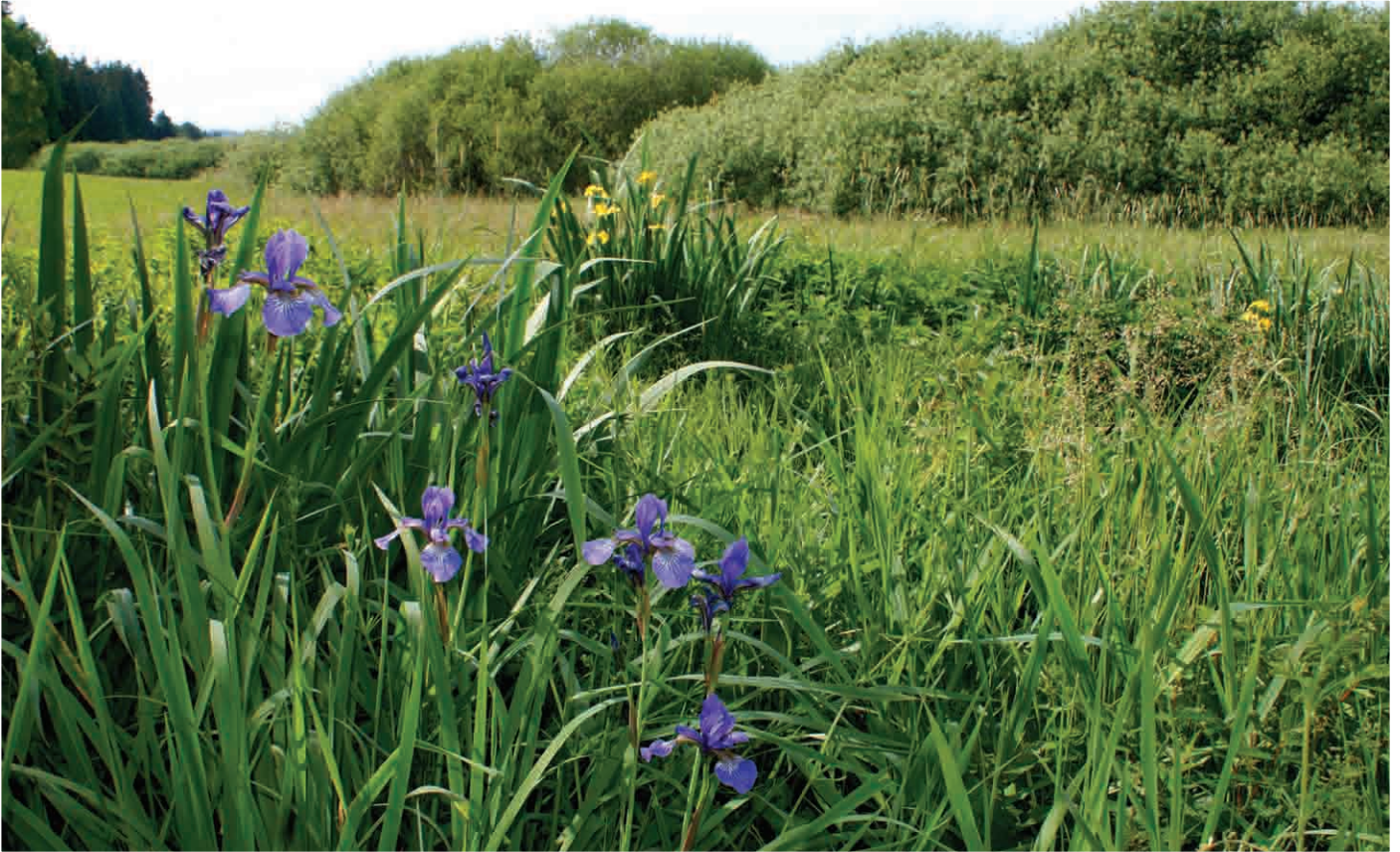
Abb. 1: Feuchtwiese an der Maltzsch bei Hussenberg mit Iris sanguinea und Iris pseudacorus nahe der Staatsgrenze zu Tschechien (7.6.2011).