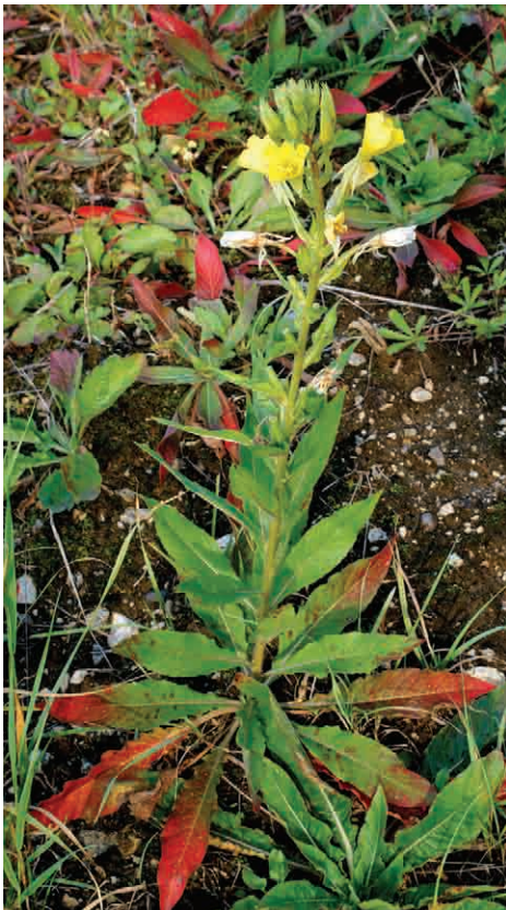
Abb. 4: Oenothera punctulata ( Oe. biennis × Oe. pycnocarpa ) konnte vom Verfasser aus allen drei Großregionen Oberösterreichs belegt werden (SE vom Bahnhof Rottenegg, 30.9.2010).