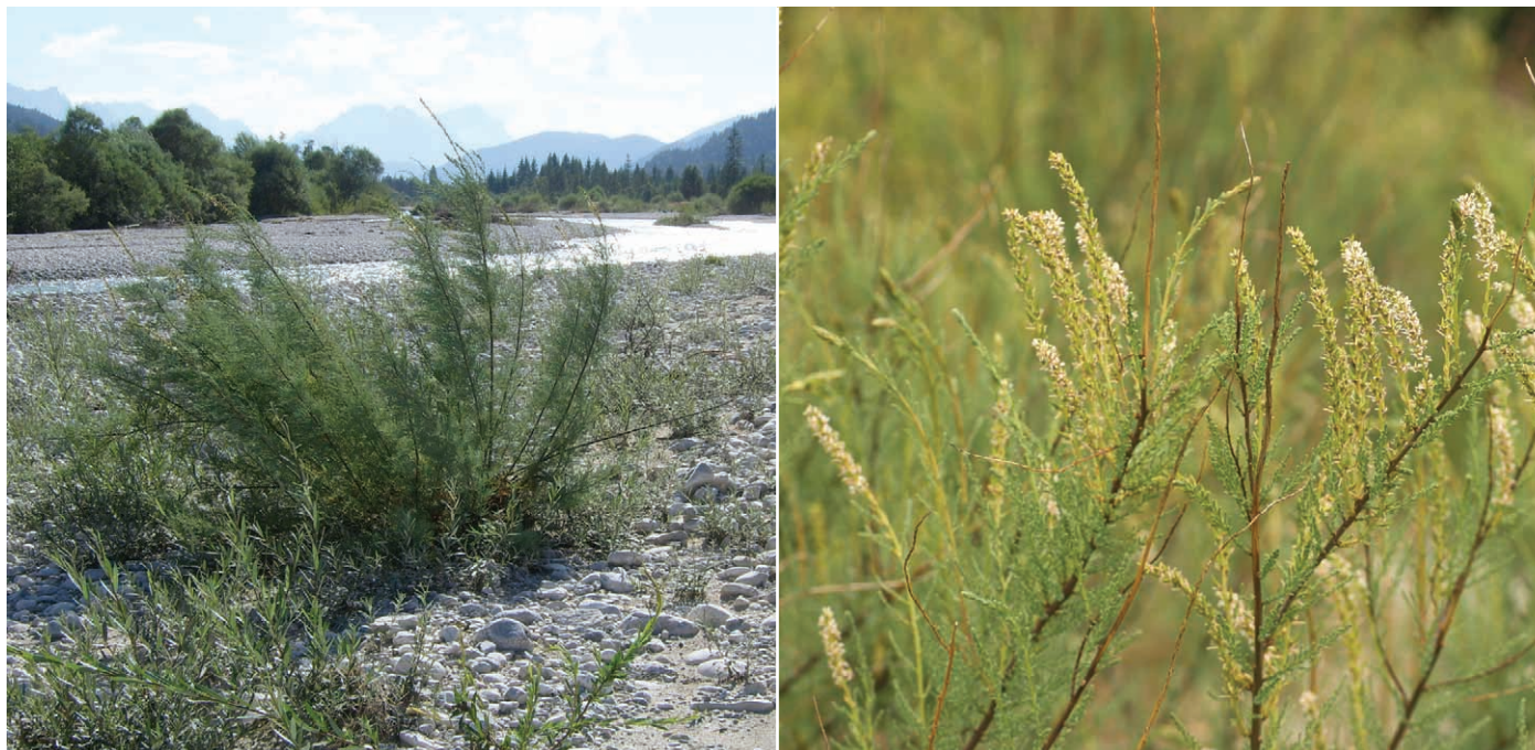
Abb. 1: links: Wuchsform – ausdauernder Strauch mit basaler Verzweigung rutenförmiger Äste; rechts: Blütenstände und Kurztriebe.

Dabei bilden Weiden-Tamarisken-Gebüsche, zusammengefasst als „3230 Alpine Flüsse mit Ufergehölzen von Myricaria germanica “, den zentralen Habitattyp für die europäischen Bergregionen. Die Ufer-Tamariske selbst kann dabei als Indikatorart für naturnahe sand- und schotterreiche Flussalluvione charakterisiert werden.