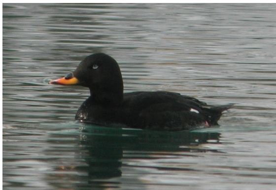
Samtente, Stau Plankenau/St. Johann am 31.01.2010