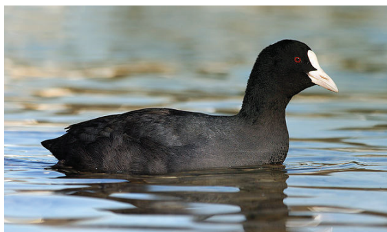
Blässhuhn; Foto: Richard Bartz (CC BY-SA 2.5-Lizenz)

Um die Zahlen richtig zu deuten, ist es vielleicht zweckmäßig sich wieder unsere zwei, neben der Stockente, häufigsten Schwimmvogelarten, nämlich das Blässhuhn und die Reiherente genauer anzuschauen.