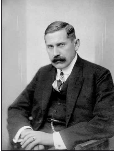
Abb. 1: Othenio ABEL, der Begründer der „Paläobiologie“. – Fig. 1: Othenio ABEL, founder of palaeobiology.

Im Juni 1911 verwendete der damals 36-jährige Othenio ABEL als tit. ord. Professor für Paläontologie an der Universität Wien erstmals den Begriff Paläobiologie in seinem Manuskript für das im Jahr 1912 erschienene Werk „Grundzüge der Paläobiologie der Wirbeltiere“ (Stuttgart, Schweizerbart'sche Verlagsbuchhandlung). Daher gilt das Jahr 1912 als Gründungsjahr der Paläobiologie. Das Buch ist Louis DOLLO, dem damaligen Konservator am Königlichen Naturhistorischen Museum in Brüssel (Belgien) gewidmet, der im Jahr 1910 den Begriff „Paléontologie éthologique“ für seine Arbeitsrichtung geprägt hatte. Ein Begriff, der sich jedoch international nicht durchsetzen sollte.