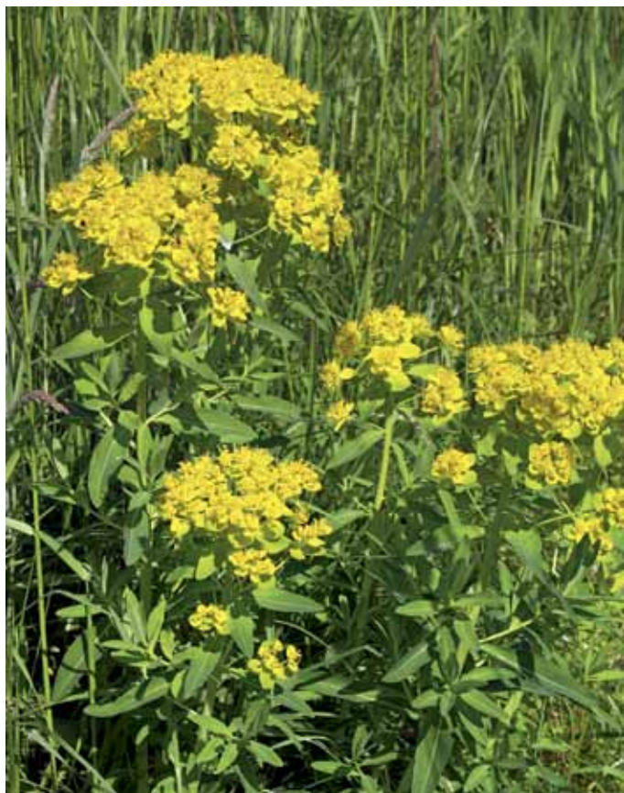
Slika 10. Euphorbia palustris L.

Nahajališča močvirske logarice v Prekmurju so dobro znana (GODICL, 1992; ACCETTO, 1990; idr.). Zanimivo je njeno pojavljanje na dveh, popolnoma različnih habitatih: v svetlih, delno zamočvirjenih gozdovih in na srednje do slabo dognojevanih vlažnih travnikih. Primarna rastišča tega evropskega elementa (HORVÁTH et al., 1995) so bili poplavni gozdovi in ACCETTO (1990) jo je celo opredelil kot značilnico oz. razlikovalnico (1985) v združbi Ulmo-Quercetum , redkeje pa naj bi se pojavljala tudi v združbi Quercus roboris- Carpinetum (kot je npr. Hraščički gozd), lahko pa tudi v asociaciji Carici elongatae-Alnetum glutinosae , kot je npr. Črni log pri Veliki