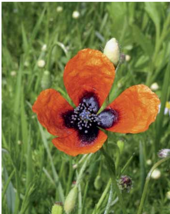
Slika 16. Papaver argemone L.