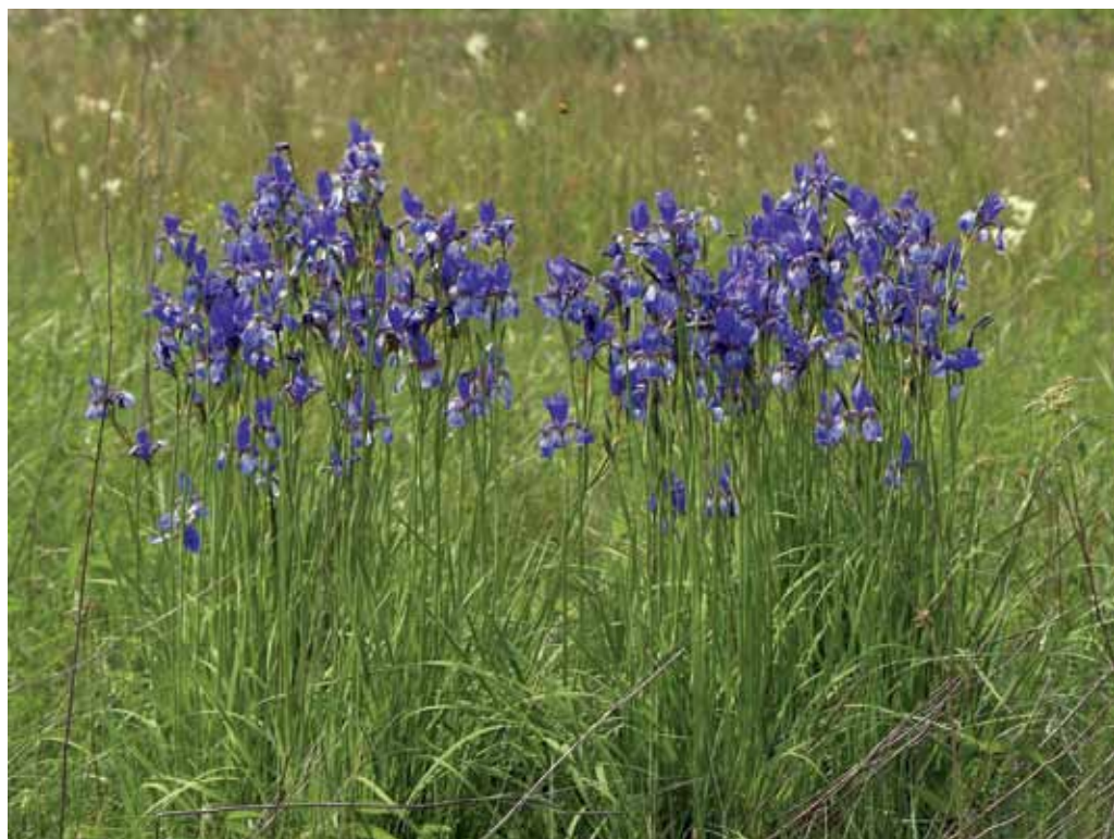
Slika 31. Travniki z močvirskim sviščem in sibirsko peruniko pri Gančanih.

Večina omenjenih travnikov pripada zvezama Molinion in Calthion , vmes pa se pojavljajo tudi družbe iz zvez Deschampsion cespitosae in Magnocaricion , bolj dognojevani travniki pa pripadajo zvezi Arrhenatherion . Med zanimivejše vrste teh močvirnih travnikov spadajo Ranunculus flammula , Trifolium fragiferum , T. dubium , Peucedanum palustre , Mentha pulegium ,