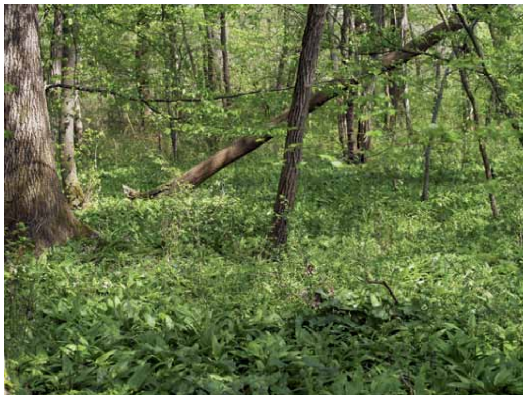
Slika 27. Spomladanska vegetacija v gozdu ob Muri.

Mrtvice in mrtve rokave v zahodnem delu Dolinskega ogrožajo predvsem trenutni posegi v prostor, kot je sečnja dreves v zimskem času, zasipanje s smetmi (še posebej z gradbenim materialom, azbestnimi ploščami ter raznimi aparaturnami), ali pa dolgosežni, kot so npr. neustrezne mediacije. V zadnjem času se ponovno odpira vprašanje energijskega izkoristka pretoka reke Mure in načrtovano izgradnjo pretočnih HE. Mokrišča ob reki Muri bi to gotovo močno ogrozilo, če ne popolnoma uničilo, saj še vedni ni pravih analiz o tem, kako bi dvig/padec vode v rečni strugi vplival na obrežno vegetacijo in na vegetacijo v zaledju obstoječih nasipov.