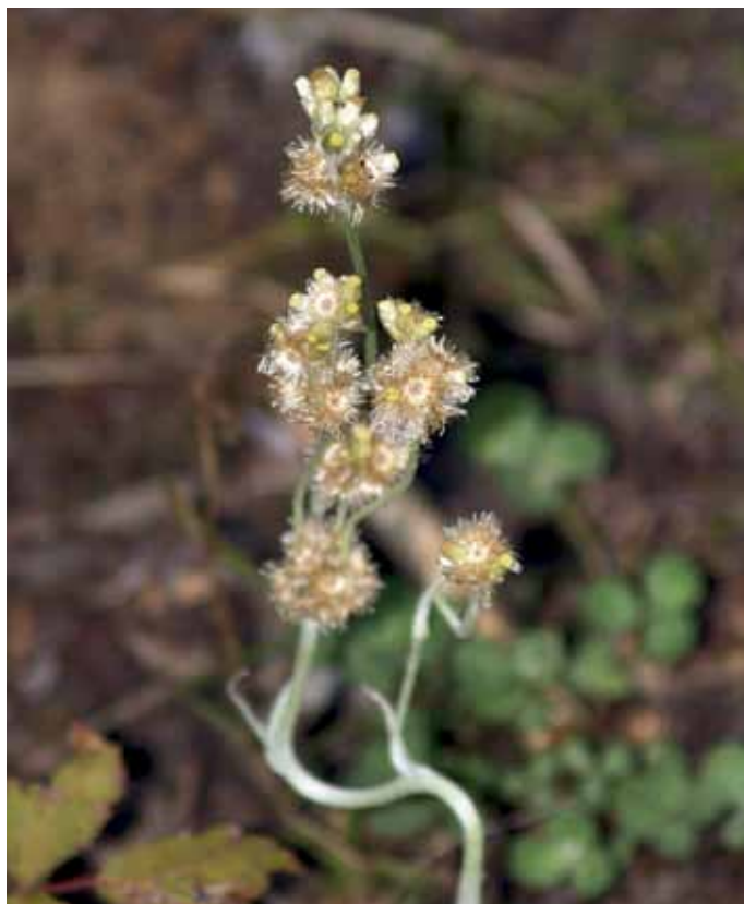
Slika 12. Gnaphalium luteoalbum L.

Novejših podatkov o pojavljanju te vrste v Sloveniji ni bilo kar nekaj časa (WRABER v MARTINČIČ et al., 2007), zato je naša navedba za gramoznico pri Gančanih ena prvih v zadnjih