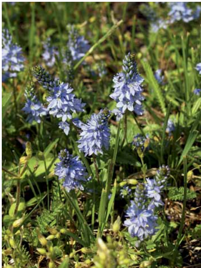
Slika 23. Veronica prostrata L.

Navedb o poleglem jetičniku za Slovenijo je zelo malo (JOGAN et al., 2001), v Prekmurju pa še ni bil opažen (BAKAN, 2006). Uspeval naj bi na suhih traviščih kolinskega pasu (ADLER et al., 1994) in na pašnikih (Fischer v Martinčič et al., 2007). Nekaj bogato cvetočih primerkov smo našli na manjši zelenici ob bencinski črpalki na začetku Črenšovcev. Glede na bližino ceste in antropogeno rastišče (košena trata) lahko sklepamo, da je zanešena s transportnim prometom. Avstrijska flora (ADLER et al., 1994) jo obravnava kot zmerno pogosto v panonskem delu države, sicer pa velja za zelo redko.