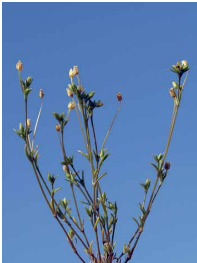
Slika 20. Sagina apetala Ard. subsp. apetala