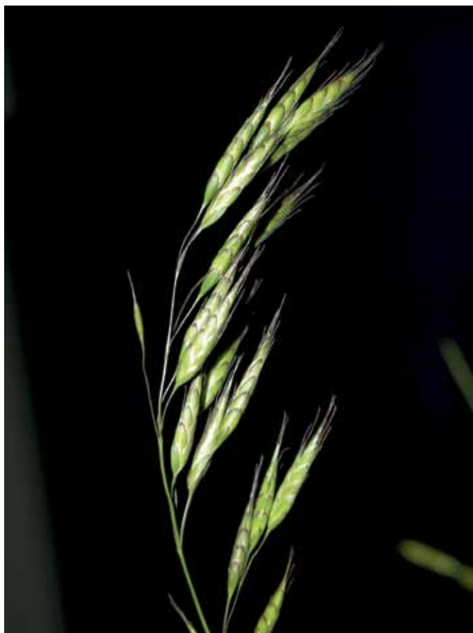
Slika 4. Bromus squarrosus L.

O tej vrsti znanih podatkov za SV Slovenijo zaenkrat ni, drugod po Sloveniji pa je razširjena le na Primorskem (JOGAN et al., 2001). Vezana je na suha ruderalna mesta (JOGAN v MARTINČIČ et al., 2007), zato bi jo lahko na prehodnih rastiščih pričakovali tudi drugod po državi. Vrsto smo našli na peščenem rastišču blizu krožišča pri AC blizu vasi Hraščice, kjer je skoraj prevladovala med