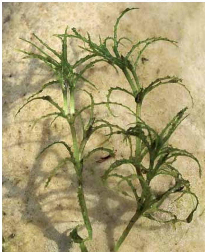
Slika 15. Najas minor All.

Poleg male podvodnice se v gramoznicah in mlakah vzdolž Mure raztreseno pojavlja tudi velika podvodnica ( N. marina L.) (BAKAN, 2006). Za širše območje Štajerske malo podvodnico