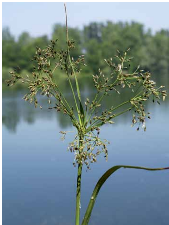
Slika 21. Scirpus radicans Schkuhr