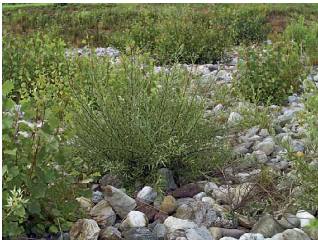
Slika 29. Nadomestni prodni habitat pri Lipovcih ob avtocesti.

Ob Ledavi, severno od vasi Gančani in blizu vasi Hraščice in Renkovci, se nahaja dobrih 360 ha velik Hraščički log. Tvori jo ga naravni hrastovo-gabrovi sestoji, vmes pa najdemo tudi zasaditvene odseke z gladkim borom ( Pinus strobus ), predvsem v vzhodnem delu pa je gosto zasajevan tudi rdeči bor ( Pinus sylvestris ). Flora Hraščičkovega loga je bogata in pestra, tipična za ta prostor, popisali pa smo več zanimivih in redkih vrst: Fritillaria meleagris , Gagea spathacea , Dryopteris dilatata , Pulmonaria mollis , Scilla bifolia , Epipactis helleborine , idr. Pred dobrima