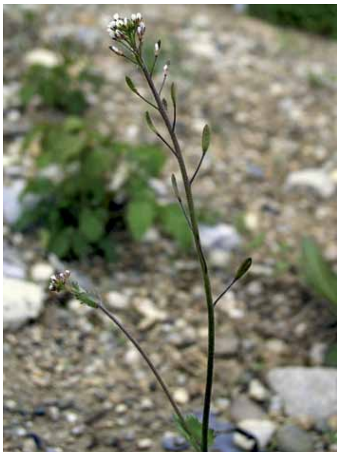
Slika 8. Draba muralis L.

HAYEK (1923) navaja za okolico Radgone pozidno g. ( Draba muralis L.), prav tako redko vrsto gladnice, katere uspevanje pa v tem delu Slovenije že dolgo ni bilo potrjeno.