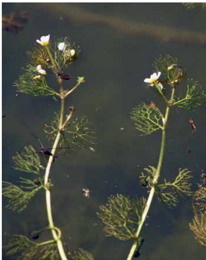
Slika 18. Ranunculus trichophyllus Chaix subsp. trichophyllus

O lasastolistni vodni zlatici za SV Slovenijo podatkov praktično ni (JOGAN et al., 2001), čeprav naj bi uspevala v stoječih in počasi tekočih vodah po vsej Sloveniji (PODOBNIK v MARTINČIČ et al.,