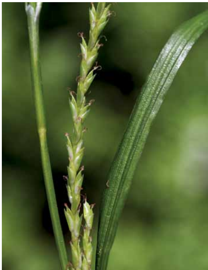
Slika 7. Carex strigosa Huds.

Ozoklasi šaš je eden redkih atlantsko-submediteranskih elementov (HORVÁTH et al., 1995), ki se pojavlja v tem delu Slovenije. Da gre za v slovenskem merilu redko vrsto, ki je opredeljena kot prizadeta (E) (ANON., 2002), kažejo izjemno redke najdbe (JOGAN et al., 1999; 2001), ki v veliki meri izhajajo iz 19. stoletja (JOGAN et al., 1999). Razlog temu je morda tudi zamenjava z zelo pogosto vrsto C. sylvatica , s katero si ne deli le podoben habitus, ampak tudi podobna rastišča. Ozoklasi šaš smo popisali v poplavnem logu ob Muri med Ižakovci – brodom in farmo Nemščak, našli pa smo ga tudi v manjšem hrastovem sestoju blizu Dolnje Bistrice (Orlovšček). Uspeva na senčnih, nekoliko vlažnejših tleh v gozdovih ali ob potokih (TRČAK v MARTINČIČ et al., 2007), pogosto je več šopov na posamezni lokaciji. Po pravilniku (ANON., 2002) je vrsta opredeljena kot prizadeta (E), na Madžarskem pa je tudi zavarovana (KIRÁLY, 2007).