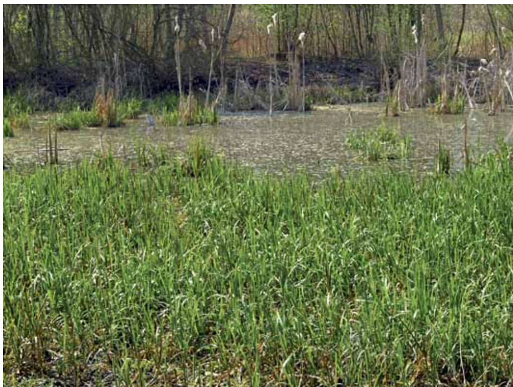
Slika 24. Mrtvi rokav blizu Dokležovja.

Manj znana mrtvica se nahaja tik ob farmi Nemščak, ki se v južnem delu zarašča z veliko sladiko ( Glyceria maxima ), ob zahodnem robu pa s trstičevjem ( Phragmites australis ). Predvsem