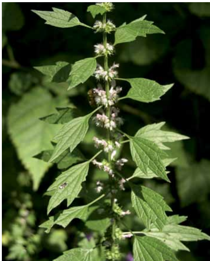
Slika 14. Leonurus cardiaca L.