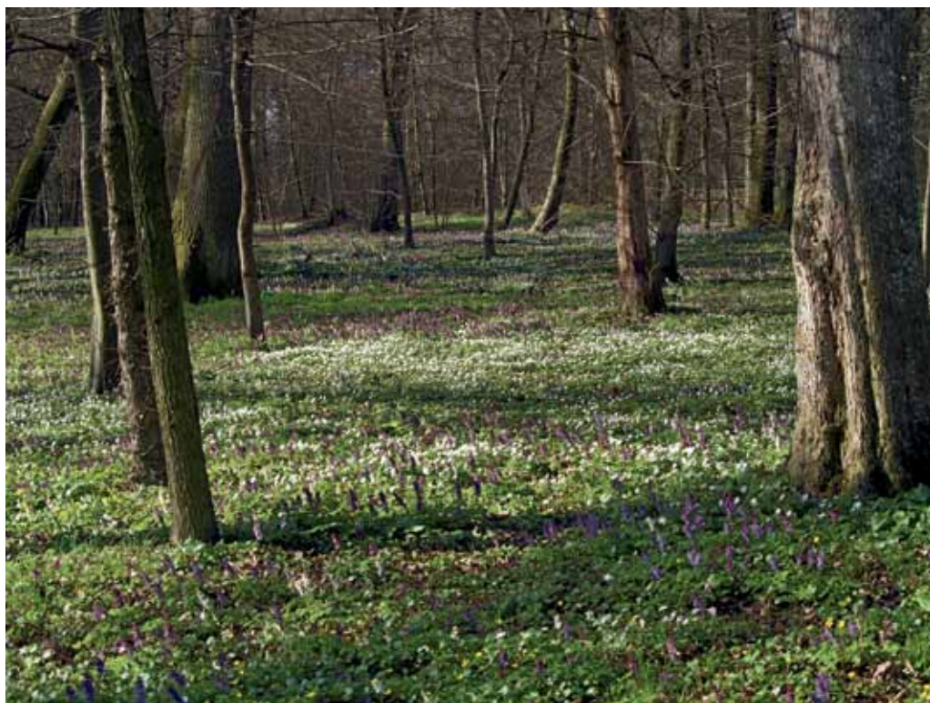
Slika 28. Hraščički log.

Z vidika ohranjanja in varovanja pa so pomembni tudi poplavni gozdovi ob Muri. Ti so se ohranili zgolj v ozkem, dober kilometer širokem pasu, v glavnem pa gre za fragmente nekadanjih obsežnih dobovo-gabrovih gozdov ( Querceto robori-Carpinetum ) z bogato in pestro zeliščno floro. Poleg doba in gabra je pomembna lesna vrsta teh gozdov dolgocepljati brest ( Ulmus laevis ), ki pa ga včasih nadomestijo s topoli in jesenom. Značilna in zelo pogosta vrsta teh gozdov, ki je drugod po Sloveniji redka, je spomladanska torilnica ( Omphalodes scorpioides ) ob kateri uspevajo tudi druge, manj ali bolj pogoste vrste, npr. Scilla bifolia , Helleborus dumetorum , Allium