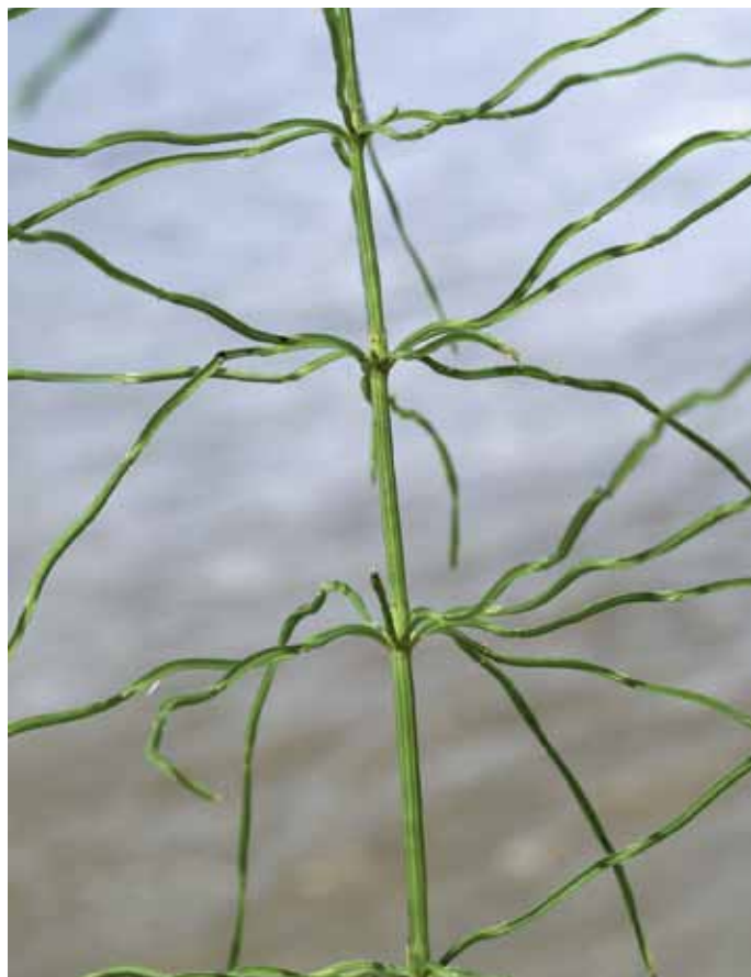
Slika 9. Equisetum pratense Ehrh.