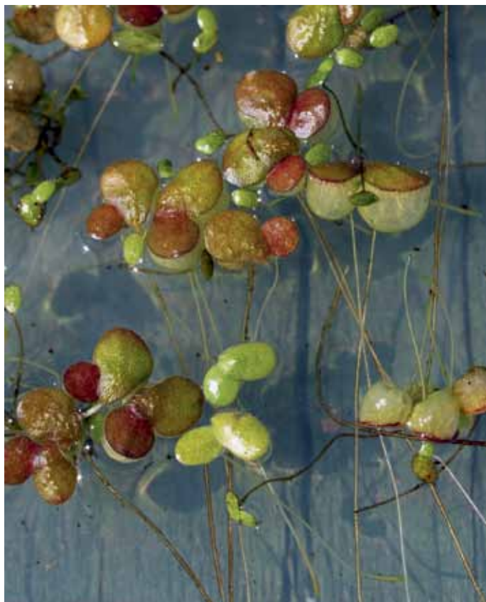
Slika 13. Lemna gibba L.