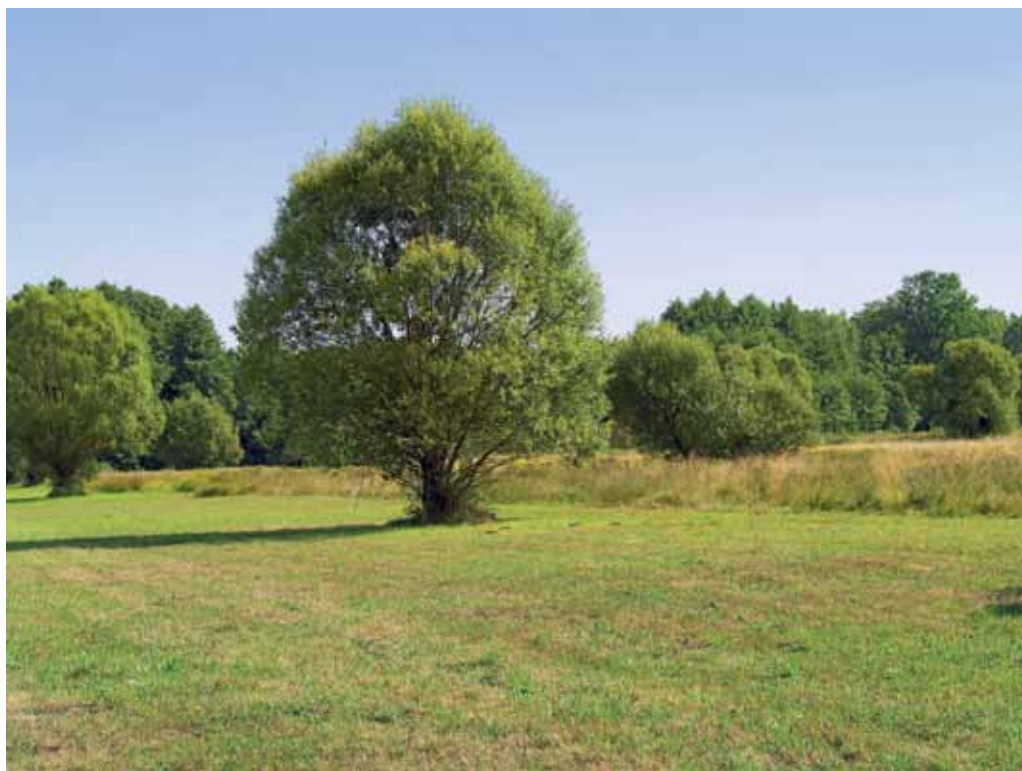
Slika 30. Mokrotni travniki med Črenšovci in Srednjo Bistrico.

Pri tem se nam zastavlja vprašanje na kakšen način bi bilo smotrno ohranjati motena rastišča, kot so obcestni jarki, zapuščenata smetišča, opustele njive, nadomestni habitati, ki so vzpostavljeni ob avtocesti, zasipališča, ipd., kot mesta, kjer se prehodno pojavljajo tudi redke in ogrožene vrste. Posebej zanimivo rastišče za razne vrste predstavlja nadomestni habitat blizu avtoceste, na izvozu pri Lipovcih. V dobrih štirih letih so se tu razbohotile nekatere lesne vrste, npr. Salix eleagnos , S. purpurea in Populus alba , zelo pogosta vrsta pa je tudi Chamerion dodonaei . Med drugimi zanimivimi vrstami, ki smo jih popisali na tej lokaciji in ob železniški progi blizu silosev, ki je le kakih 50 m vstran, so Verbascum lychnitis , Centaurea macroptilon , C. rhenana , Spergularia