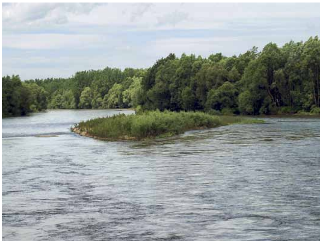
Slika 26. Eno od prodišč na reki Muri.

Z vidika ohranjanja floristične pestrosti se nam zdi pomembna tudi gramoznica pri Melincih, ki jo lastnik stalno preureja in izkorišča. Tu smo našli nekatere redke vrste kot so Rumex palustris , Veronica catenata , Myriophyllum verticillatum , Cyperus glomeratus , Myosotis cespitosa , Crepis setosa , Rorippa amphibia , Potentilla supina , Eleocharis acicularis , idr., v neposredni bližini gramoznice pa se nahaja peščena stena z gnezdišči breguljk ( Riparia riparia ), ki je kvalifikacijska