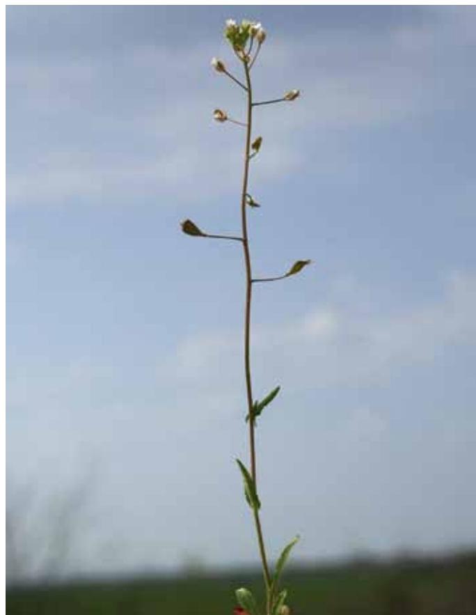
Slika 6. Capsella rubella L.

Podatki o pojavljanju rdečkastega plešca, ki izvira iz mediteranskega prostora (WRABER v MARTINČIČ et al., 2007) in se nekako širi na vzhod, izhajajo iz štajerskega in primorskega konca Slovenije (JOGAN et al., 2001). Uspeva na obdelanih tleh, peščenih mestih in ob poteh (WRABER v MARTINČIČ et al., 2007), našli pa smo ga blizu železniške postaje Lipovci. Zaradi podobnosti z navadnim pleščem ga lahko zlahka spregledamo in je morda pogostejši kot se zdi.