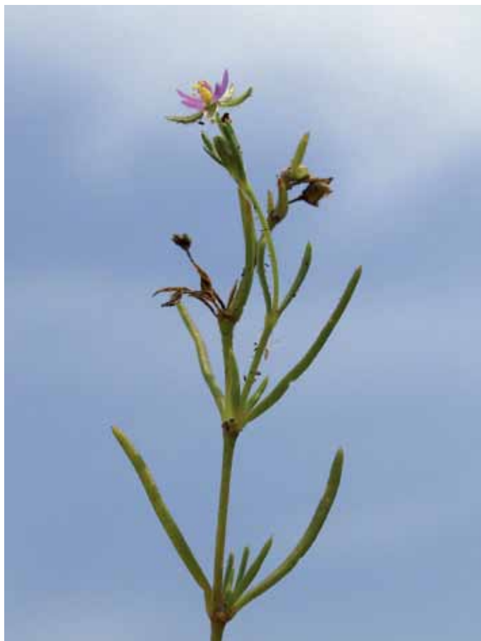
Slika 22. Spargularia marina (L.) Besser