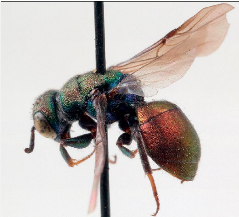
Slika 21: Hedychridium coriaceum , samica iz Podčetrška, zbirka PMSL