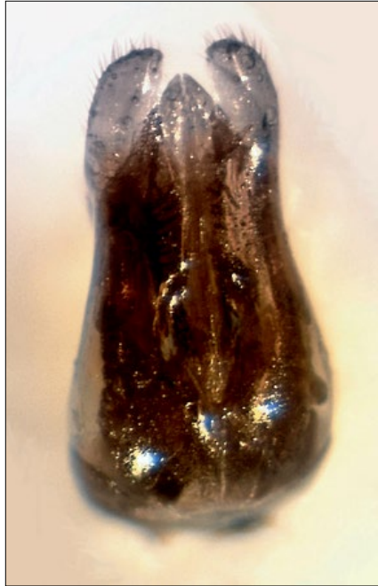
Slika 28: Hedychridium valesiense , genitalije samca iz Lukovice, zbirka PMSL