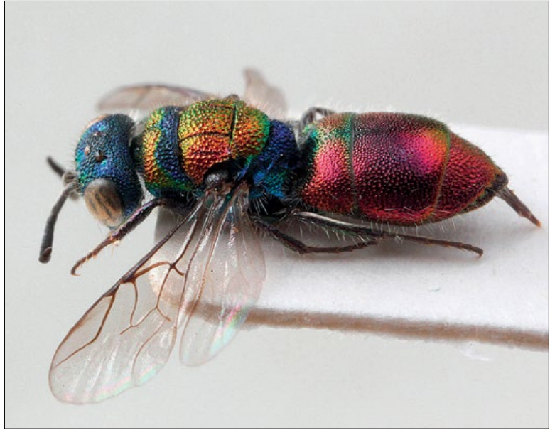
Slika 44: Chrysis germari , samica iz Kregolišča, zbirka PMSL