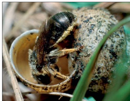
Slika 2: Levo zlata osa Chrysura laevigata , desno rdečedlaka dišavka ( Osmia rufohirta ) v svojem gnezdu, hišici polža Pomatias elegans . Brje pri Komnu, julija 1989.