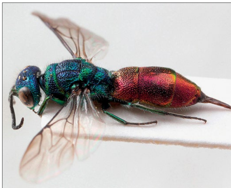
Slika 56: Chrysis angustula , samica s Korenskega sedla, zbirka PMSL

West Palaeartic species. Collected in the sub- Mediterranean region of Slovenia.