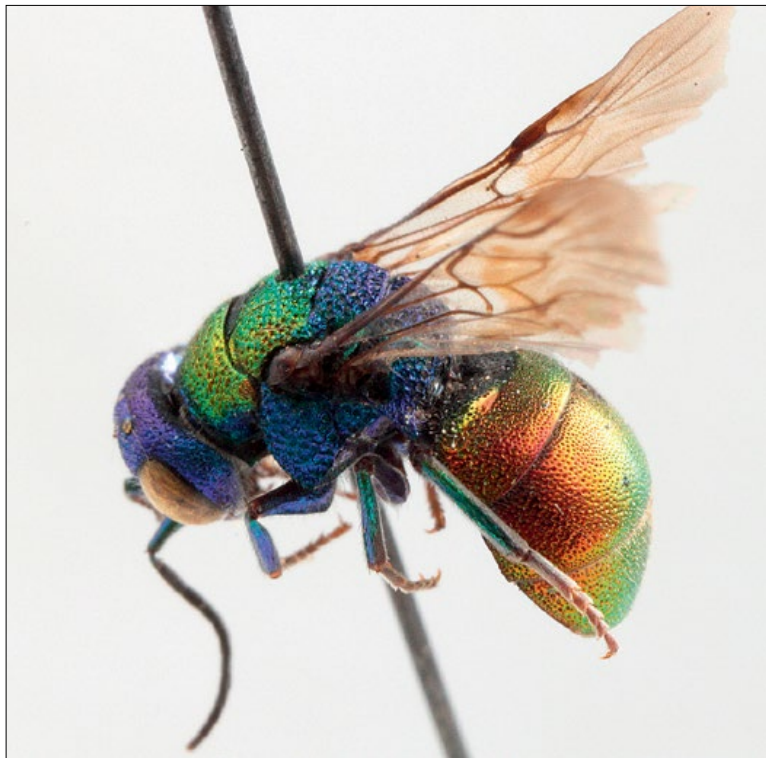
Slika 13: Holopyga chrysonota , samec iz Podčetrтка, zbirka PMSL