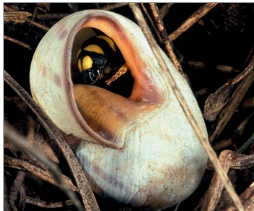
Slika 3: Levo zlata osa vrste Chrysura refulgens , desno samec čebele smolarke ( Rhodanthidium septemdentatum ) v polžji hišici iz rodu Cepaea . Brje pri Komnu, junija 1992.