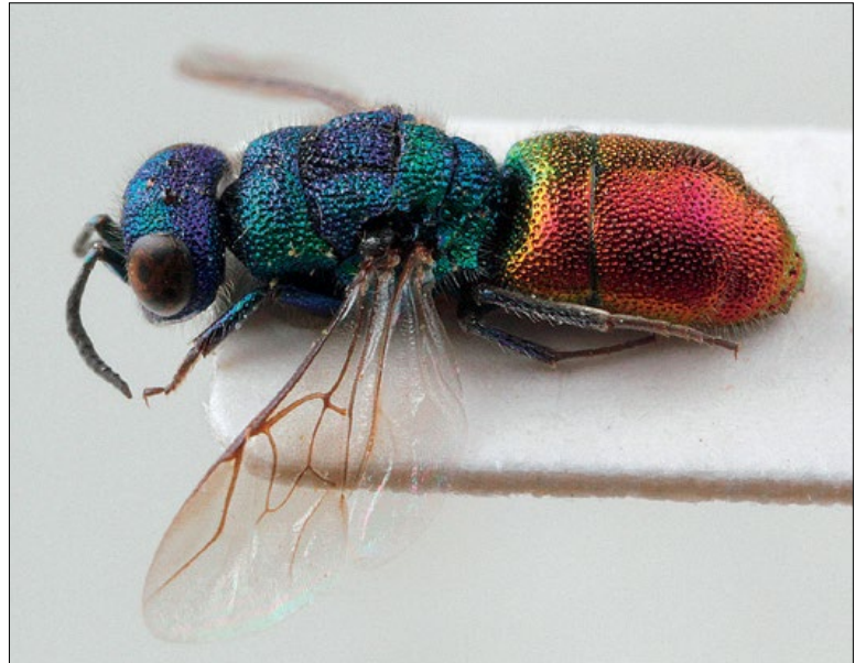
Slika 47: Chrysis interjecta , samica iz Brij, zbirka PMSL

Mediterranean species. Collected in the sub- Mediterranean region of Slovenia.