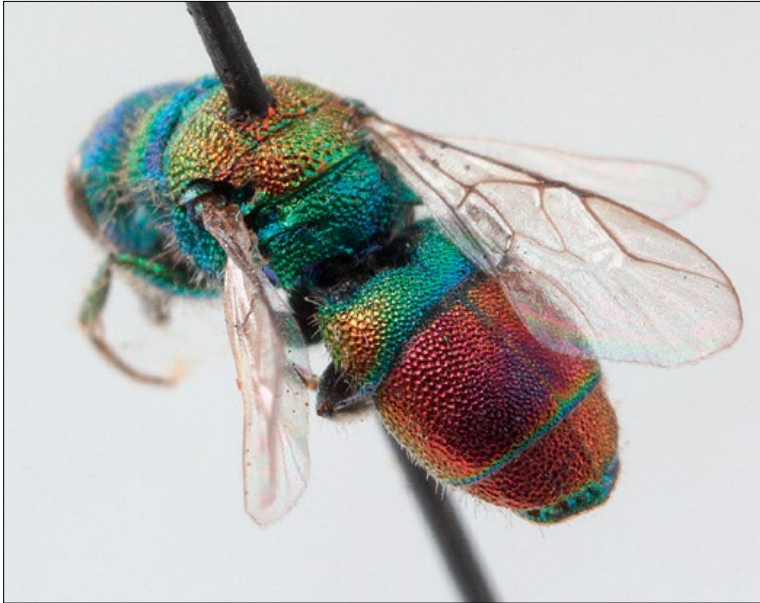
Slika 46: Chrysis leachii , samec iz Podčetrтка, zbirka PMSL