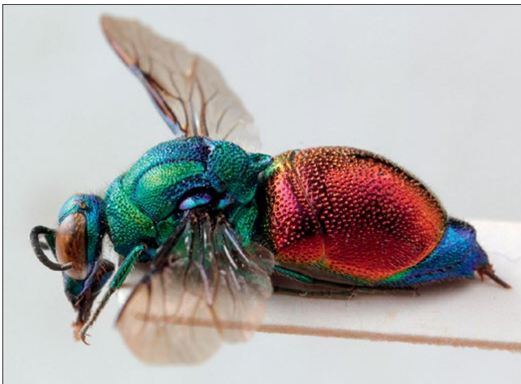
Slika 72: Stilbum calens , samica iz Brij, zbirka PMSL

Hr/Cro: Bakar, 10. 7. 1910, 1♂, A. Taubert leg., PMSL (slika/fig. 73)