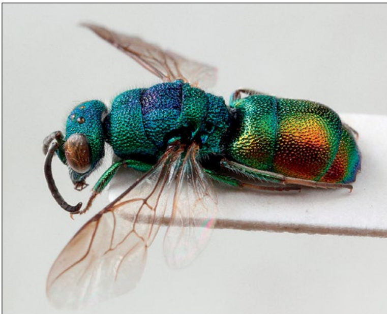
Slika 50: Chrysis marginata , samec iz Tubelj, zbirka PMSL

West Palaearctic species. Collected in the sub-Mediterranean and sub-Pannonian regions of Slovenia.