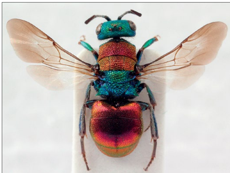
Slika 17: Hedychrum niemelai , samica iz Črnuč, zbirka PMSL