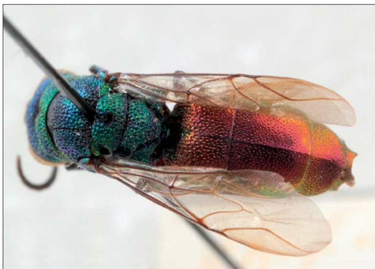
Fig. 58: Chrysis corusca female from Planina Vogar, coll. PMSL.