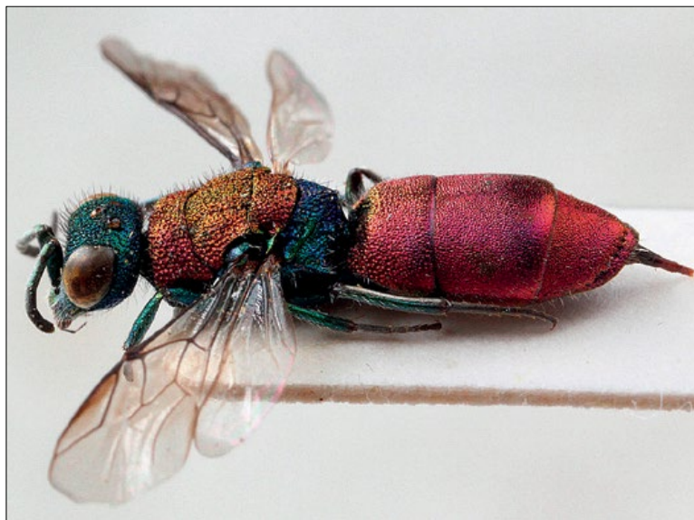
Slika 32: Chrysura dichroa , samica iz Brij, zbirka PMSL

East Mediterranean species. Collected in the sub-Pannonian region of Slovenia. Small and very slender species. Host is not known, but if it is a megachilid bee, species of Chelostoma and Heriades come into consideration due to similar body shape.