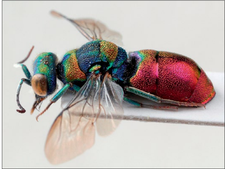
Slika 71: Spinolia lamprosoma , samec iz Strunjana, zbirka PMSL