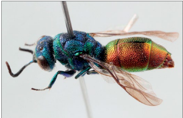
Fig. 59: Chrysis ignita female from Koritnice, coll. NMPO

Slika 60: Chrysis impressa , samica s Planine Vogar, zbirka PMSL