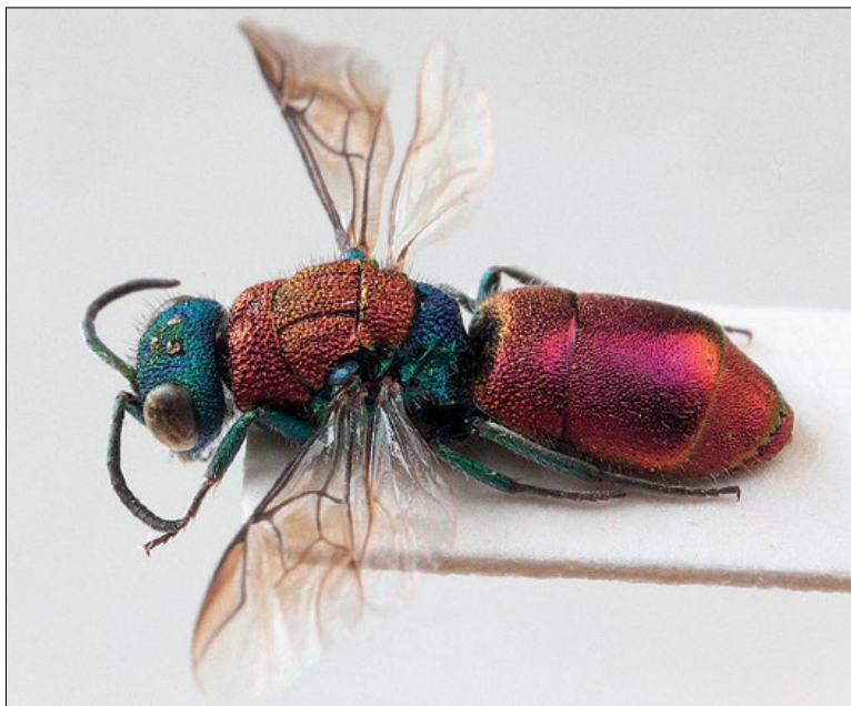
Fig. 34: Chrysur laevigata female from Brje, coll. PMSL