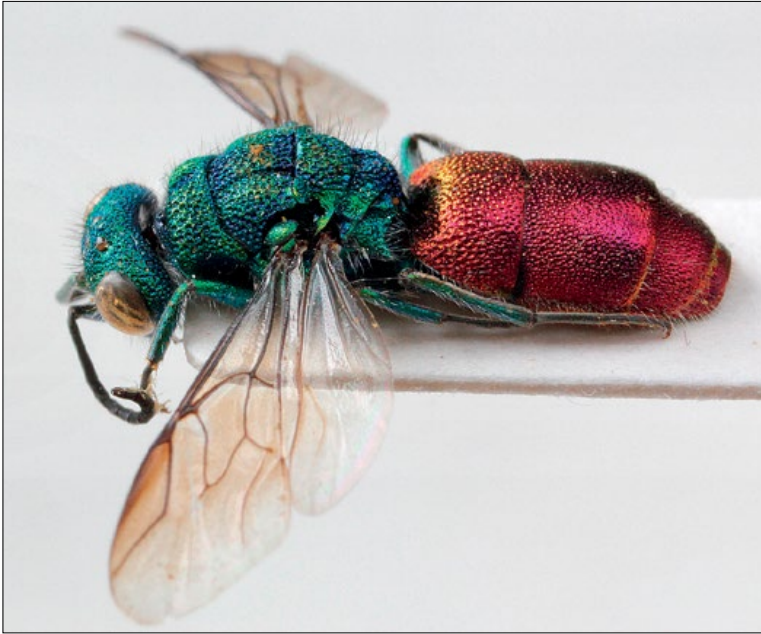
Slika 36: Chrysura radians , samica s Slavnika, zbirka PMSL