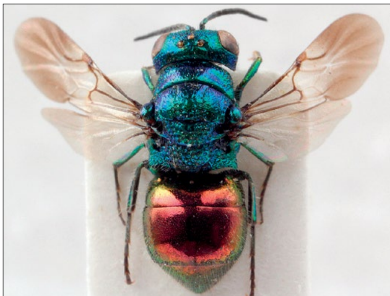
Slika 8: Pseudomalus auratus , samica iz Dragonje, zbirka PMSL