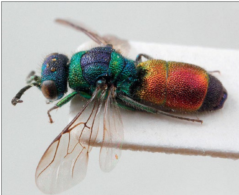
Slika 52: Chrysis rutilans , samec iz Brij, zbirka PMSL

Palaearctic species. Collected in the sub- Mediterranean and sub-Pannonian regions of Slovenia.