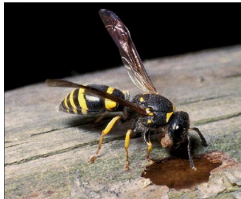
Slika 4: Levo zlata osa vrste Chrysis terminata , desno osa zidarka ( Ancistrocerus nigricornis ) z blatom za gradnjo pri vhodu v svoje gnezdo. Brje pri Komnu, maja 1989.