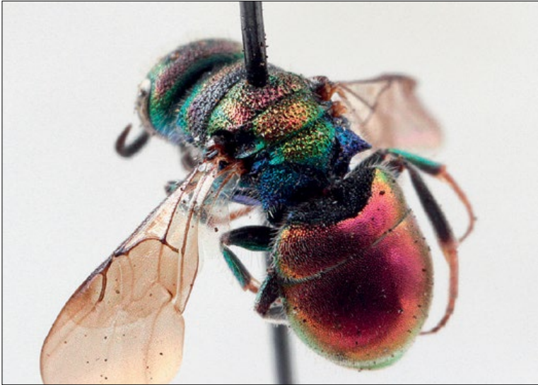
Slika 20: Hedychridium ardens , samec iz Podčetrška, zbirka PMSL