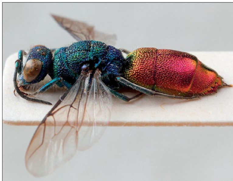
Slika 66: Chrysis subcoriacea , samica iz Brij, zbirka PMSL

Palaeartic species. Collected in the sub-Mediterranean region of Slovenia.