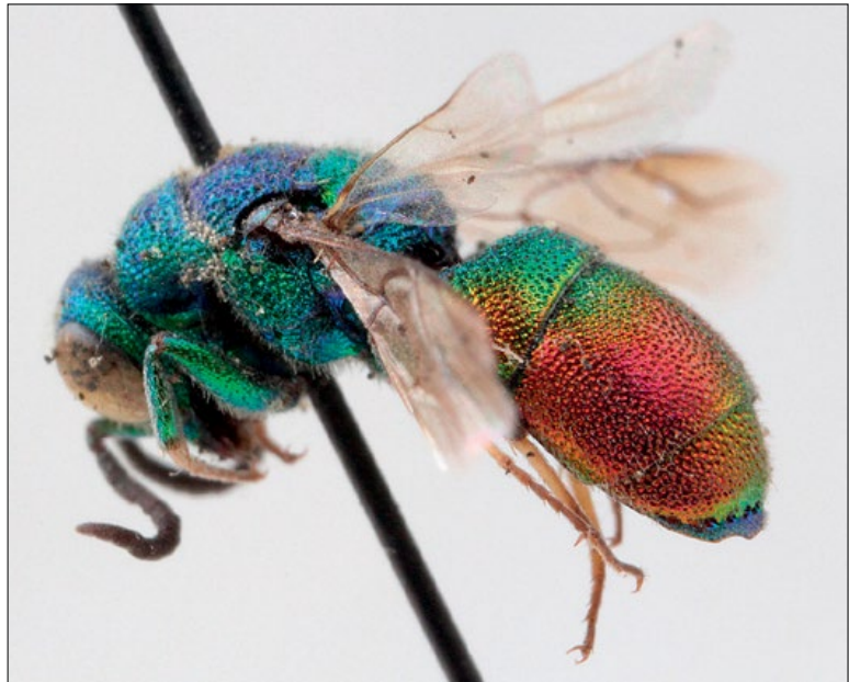
Slika 55: Chrysis graelsii , samec iz Podčetrтка, zbirka PMSL

West Palaearctic species. Collected in the sub-Pannonian region of Slovenia.