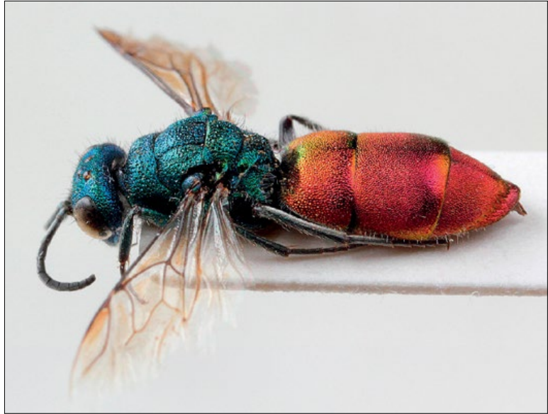
Slika 38: Chrysurina trimaculata , samica iz Vonarj, zbirka PMSL