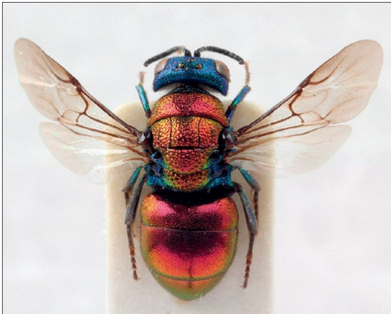
Slika 12: Holopyga austrialis , samica iz Lukovice, zbirka PMSL

West Palaearctic species. Collected in the Alpine and sub-Pannonian regions of Slovenia.