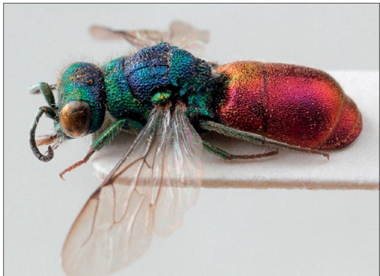
Slika 69: Pseudospinolia neglecta , samec iz Lukovice, zbirka PMSL

Palaeartic species. Collected in the pre-Alpine region of Slovenia.