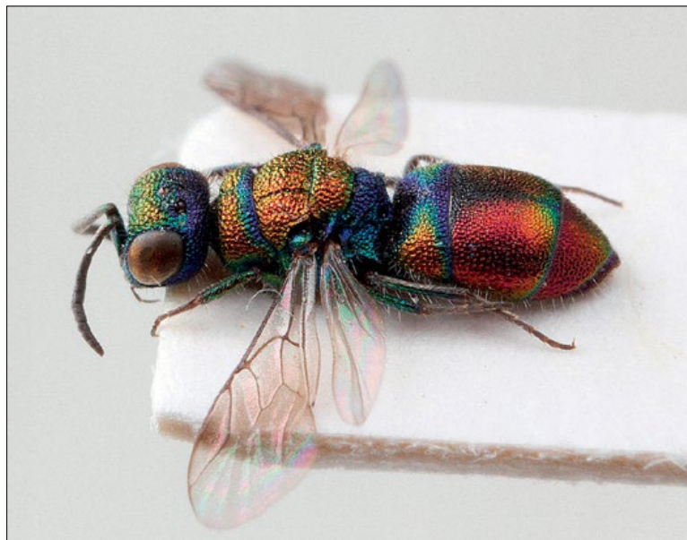
Slika 43: Chrysis auriceps , samica iz Brij, zbirka PMSL

West Palaearctic species. Collected in the sub- Pannonian and sub-Mediterranean regions of Slovenia.