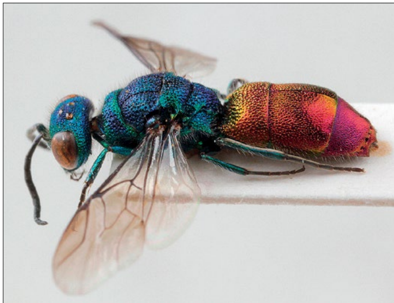
Fig. 65: Chrysis solida female from Planina Vogar, coll. PMSL