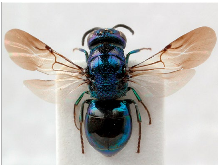
Slika 7: Omalus puncticollis , samica iz Zaplane, zbirka PMSL