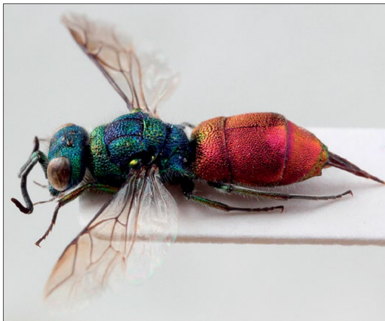
Slika 63: Chrysis ruddii , samica iz Rakitovca, zbirka PMSL