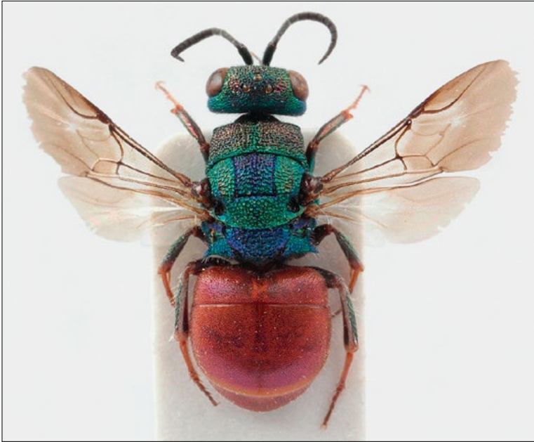
Slika 24: Hedychridium capitaureum , samica iz Lukovice, zbirka PMSL