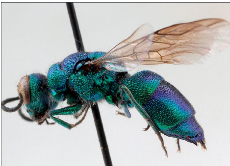
Slika 61: Chrysis indigotea , samica iz Miljane, zbirka PMSL

European species. Collected in the Alpine and sub-Mediterranean regions of Slovenia.