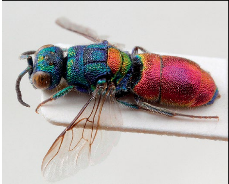
Slika 51: Chrysis scutellaris , samica iz Brij, zbirka PMSL