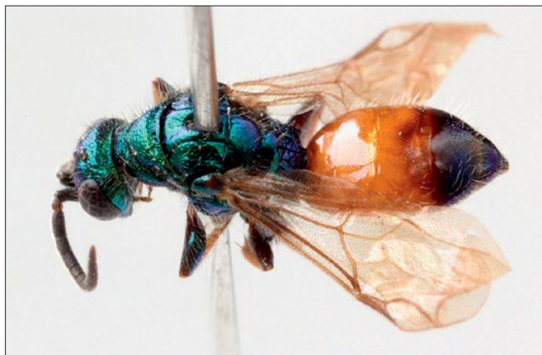
Slika 5: Cleptes semiauratus , samec iz Postojne, zbirka NMPO

Hosts: Nematus spp., Pristiphora spp. (Tenthredinidae) (KIMSEY & BOHART 1991) Palaearctic species. Collected in the sub- Pannonian and Dinaric regions of Slovenia. Previously known as C. semiauratus , but when found to be synonymous with C. pallipes , ROSA, FORSHAGE, PAUKKUNEN & SOON (2015) described it as a new species.