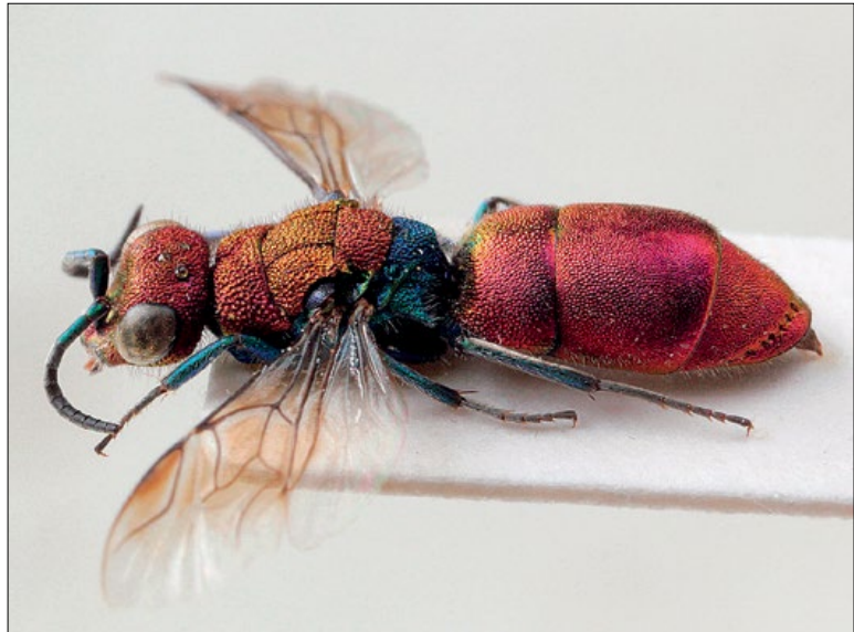
Slika 31: Chrysura cuprea , samica iz Brij, zbirka PMSL.

Europeo-Mediterranean species. Collected in the sub-Mediterranean region of Slovenia.