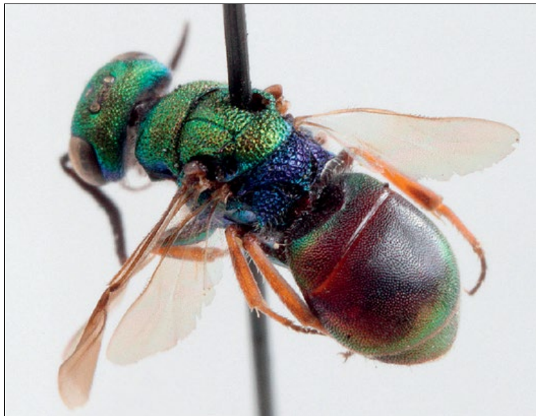
Slika 22: Hedychridium femoratum , samica iz Podčetrška, zbirka PMSL