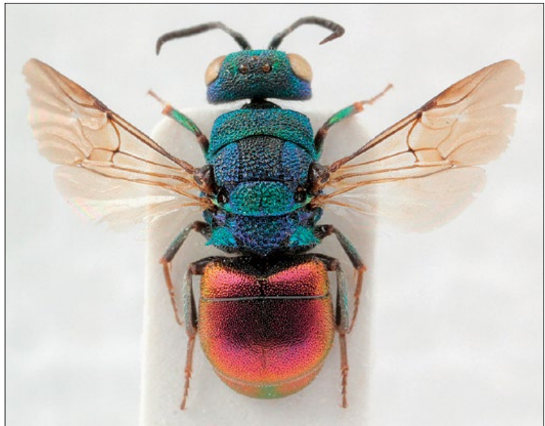
Fig. 27: Hedychridium valesiense male from Lukovica, coll. PMSL