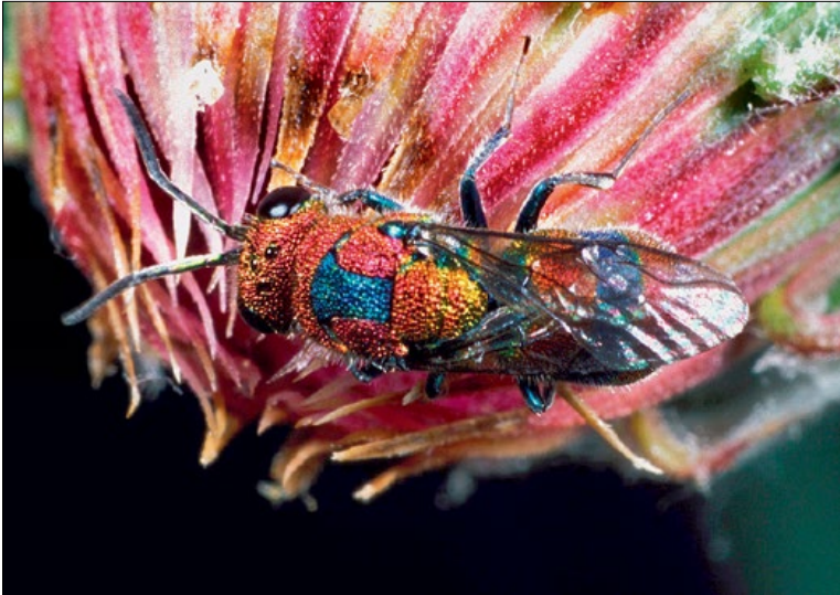
Slika 41: Chrysis jucunda na socvetju mehkodlakave jurjevine ( Jurinea mollis ), Golec