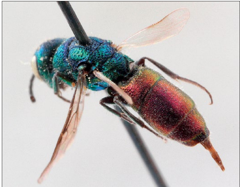
Fig. 40: Chrysis gracillima female from Podčetrtek, coll. PMSL