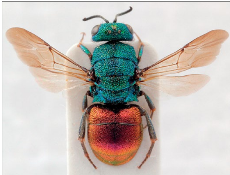
Slika 16: Hedychrum gerstaeckeri , samec iz Koštabone, zbirka PMSL