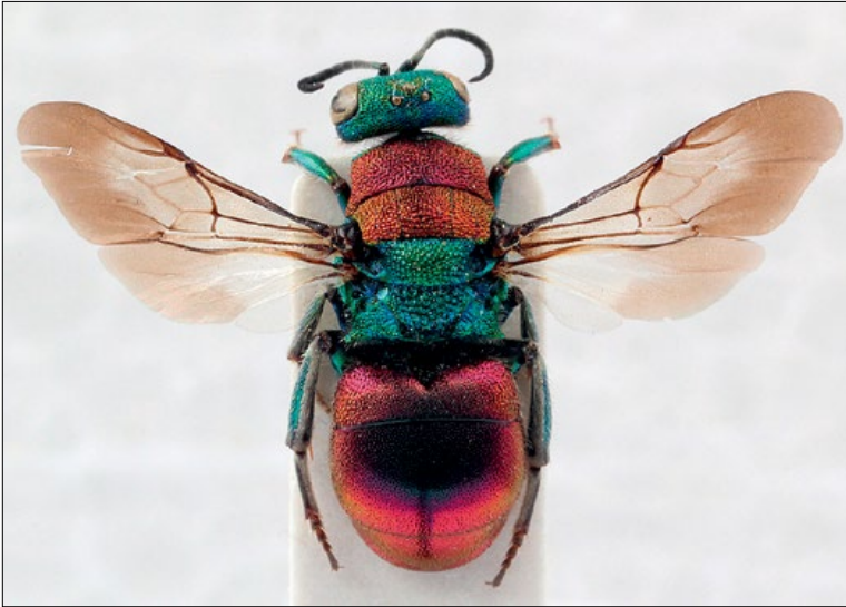
Slika 18: Hedychrum nobile , samica iz Sp. Brnika, zbirka PMSL