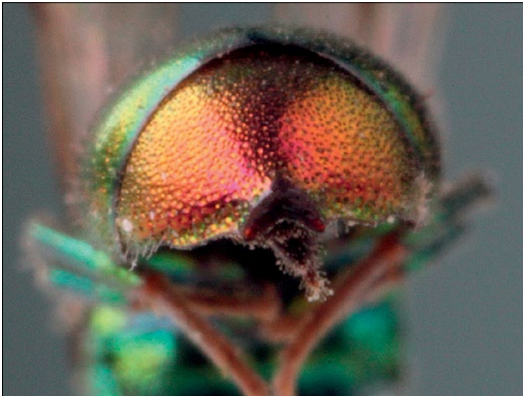
Slika 10: Elampus constrictus , tretji tergiti samice iz Podčetrka, zbirka PMSL