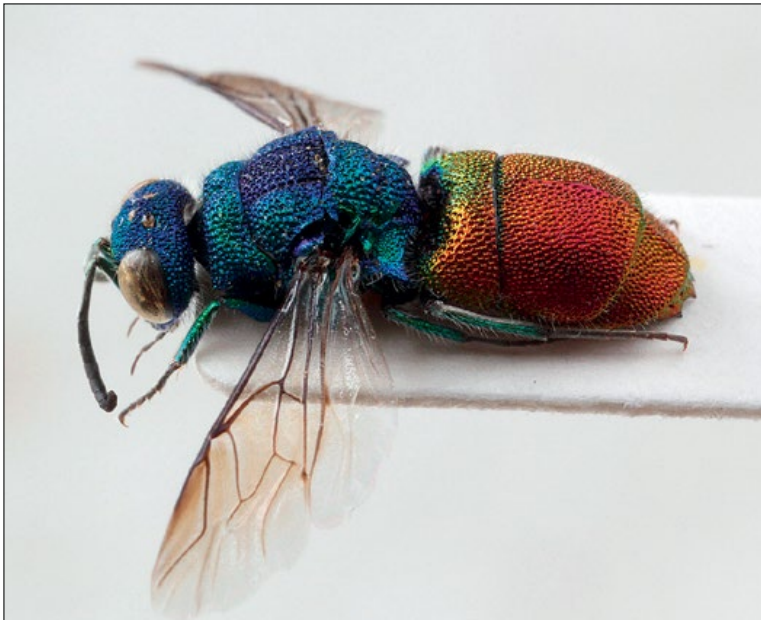
Slika 54: Chrysis inaequalis , samec iz Brij, zbirka PMSL

Palaeartic species. Collected in the sub- Mediterranean and sub-Pannonian regions of Slovenia.