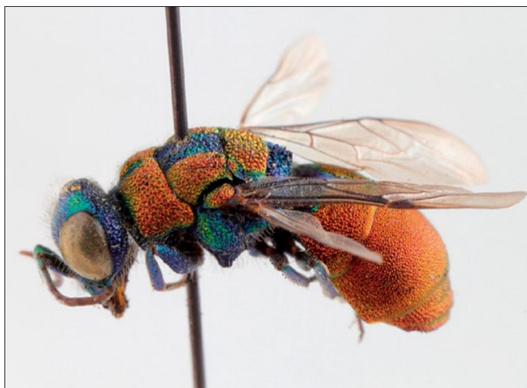
Slika 70: Spinolia dallatorreana , samec iz Bistrice ob Sotli (?), zbirka PMSL

East Mediterranean species, the West Mediterranean form is treated as a distinct species S. segusiana . Collected in the sub-Mediterranean region of Slovenia.