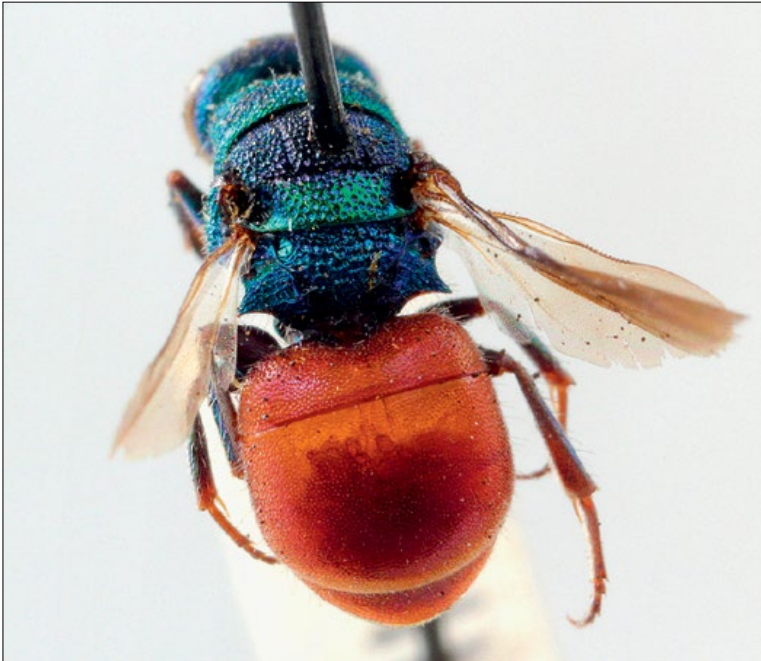
Slika 25: Hedychridium roseum , samica iz Miljane, zbirka PMSL