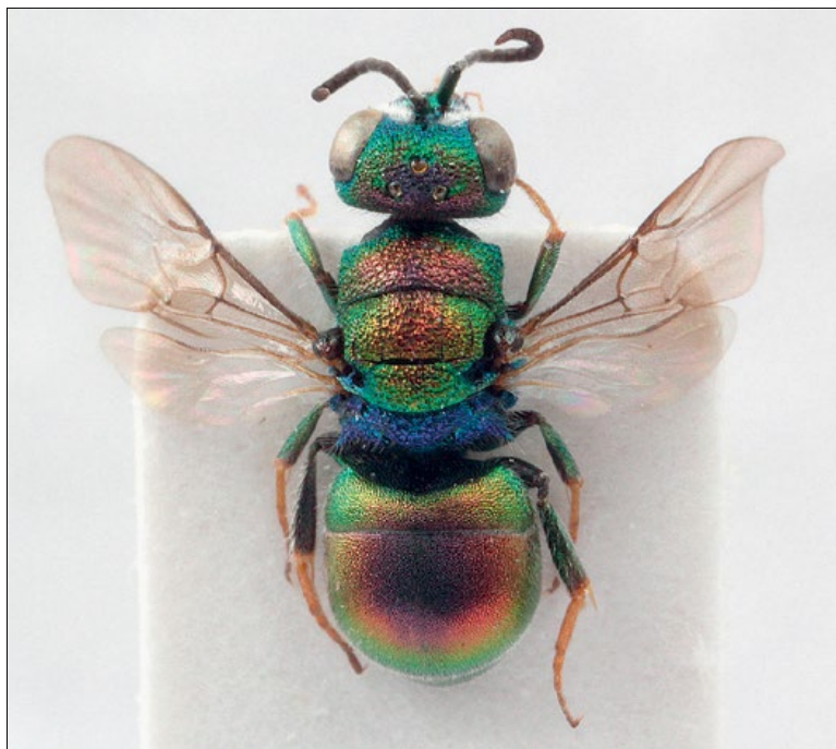
Slika 23: Hedychridium jucundum , samec iz Kregolišča, zbirka PMSL