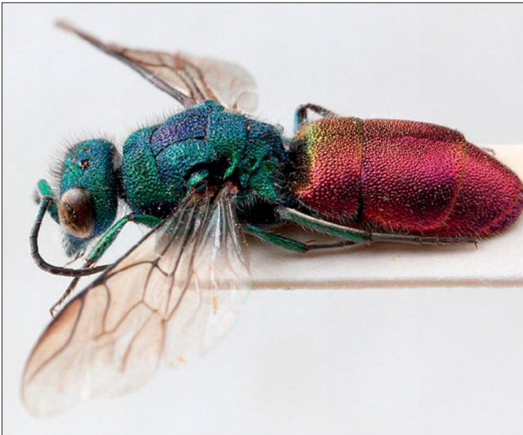
Slika 37: Chrysura refulgens , samec iz Brij, zbirka PMSL