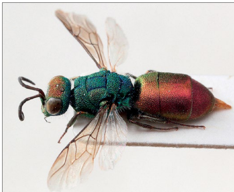
Slika 30: Chrysura ignifrons , samica s Štange, zbirka PMSL

Mediterranean species. Collected in the sub-Mediterranean region of Slovenia.