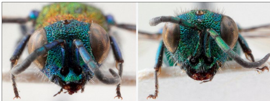
Slika 35: Glava samic vrst Chrysura dichroa (levo) in Chrysura laevigata (desno).

LINSENMAIER (1959) wrote: »Die bisherige mitteleuropäische dichroa existiert in zwei Spezies, die fast gleiche Verbreitung haben ...« But while C. dichroa , as well as C. cuprea and C. trimaculata , is found only on calcareous ground (KUNZ 1994), C. laevigata may not be as strictly limited as it was found also in the Sotla valley. C. laevigata can be distinguished from C. dichroa easily by the longer malar space and different shape of the third tergum in a female (ARENS 2001).