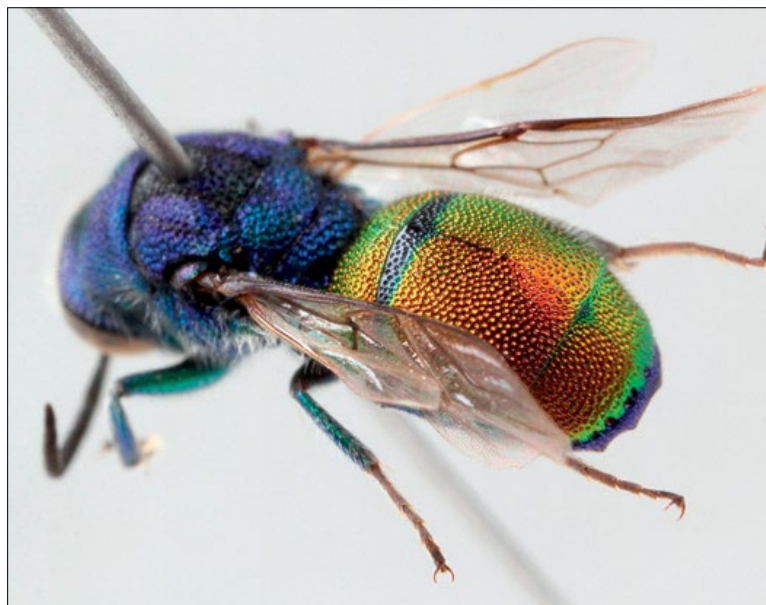
Slika 48: Chrysis analis , samec iz Koritnic, zbirka NMPO

Mediterranean species. Collected in the sub- Mediterranean and pre-Alpine regions of Slovenia.