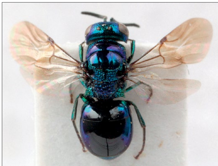
Slika 6: Omalus aeneus , samica iz Gorjanskega, zbirka PMSL

West Palaeartic species. Collected in the sub-Mediterranean region of Slovenia.