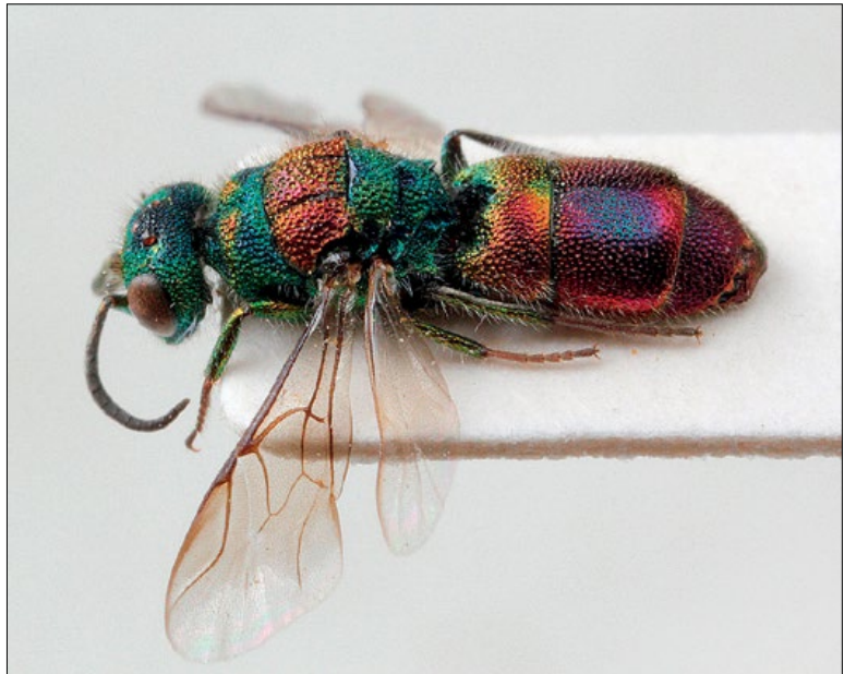
Slika 45: Chrysis illigeri , samec iz Lukovice, zbirka PMSL