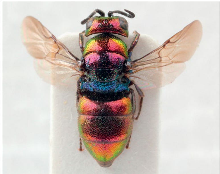
Slika 11: Holopyga fervida , samica iz Sp. Branice, zbirka PMSL

West Palaeartic species. Collected in the sub-Mediterranean and sub-Pannonian regions of Slovenia. Sexually dimorphic species.