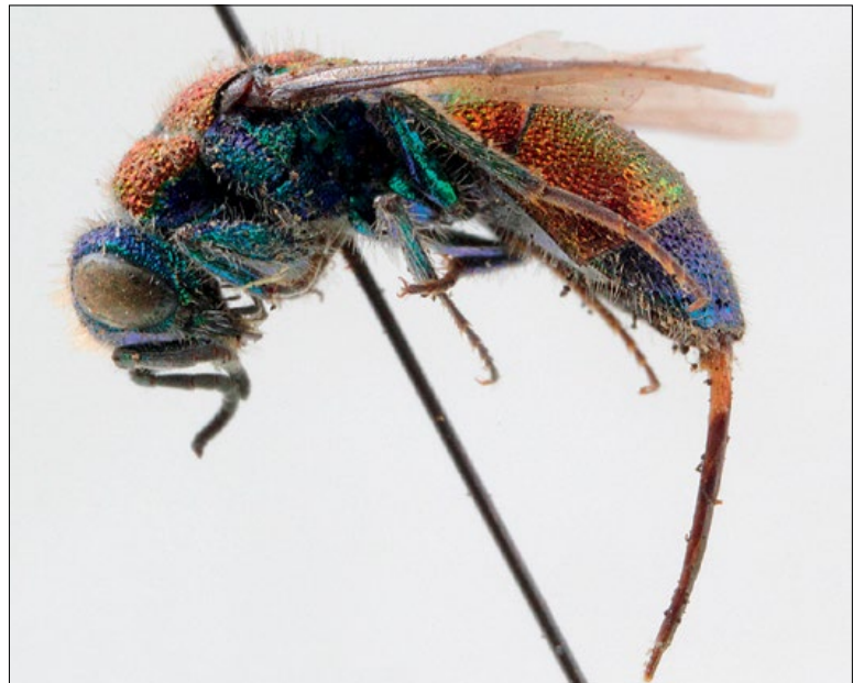
Slika 53: Chrysis viridula , samica iz Kranjske Gore, zbirka PMSL

Palaeartic species. Collected in the Alpine region of Slovenia.