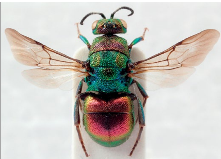
Slika 19: Hedychrum rutilans , samica iz Mihalovca, zbirka PMSL