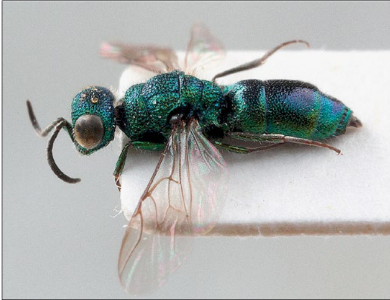
Slika 39: Trichrysis cyanea , samica iz Brij, zbirka PMSL