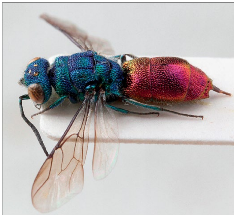
Slika 67: Chrysis terminata , samica iz Brij, zbirka PMSL

Host: Ancistrocerus nigricornis (Vespididae) which nests in cavities in dead wood (PAUKKUNEN et al. 2015, own observation) West Palaearctic species. Collected in the pre-Alpine, sub-Pannonian, Dinaric and sub-Mediterranean regions of Slovenia.