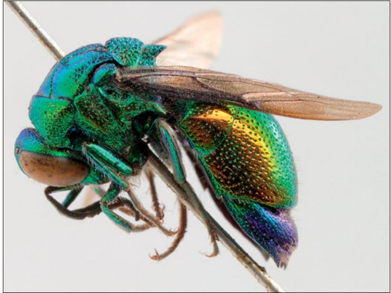
Slika 73: Stilbum cyanurum , samec iz Bakra, Hrvaška, zbirka PMSL