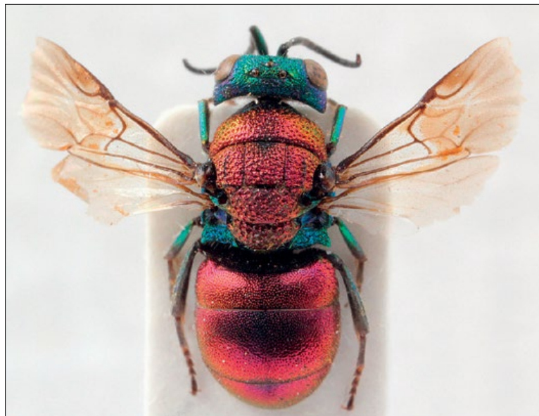
Slika 15: Holopyga inflammata , samec z Nanosa, zbirka PMSL

West Palaeartic species. Collected in the Dinaric and sub-Mediterranean regions of Slovenia. Sexually dimorphic species.