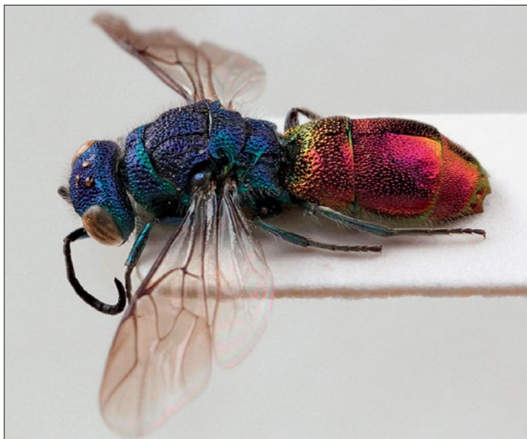
Slika 62: Chrysis mediata , samica iz Ponikve, zbirka PMSL