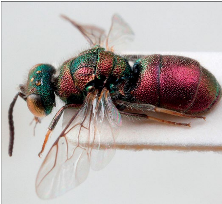
Slika 68: Spintharina versicolor , samec iz Brestovice, zbirka PMSL

Mediterranean species. Collected in the sub- Mediterranean region of Slovenia.