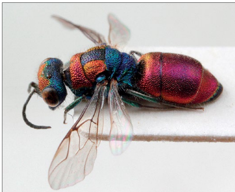
Slika 29: Chrysur candens , samica iz Brij, zbirka PMSL

South European species. Collected in the sub-Mediterranean region of Slovenia.