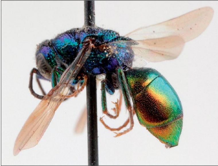
Slika 9: Elampus constrictus , samica iz Podčetrka, zbirka PMSL