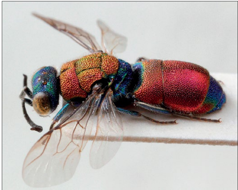
Fig. 49: Chrysis chryso stigma male from Gorjansko, coll. PMSL