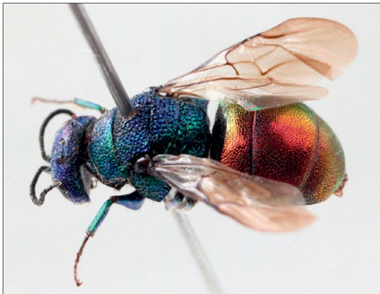
Slika 14: Holopyga ignicollis , samec iz Cerknice, zbirka NMPO