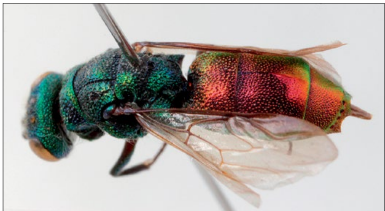
Fig. 60: Chrysis impressa female from Planina Vogar, coll. PMSL

Slika 60: Chrysis impressa , samica s Planine Vogar, zbirka PMSL