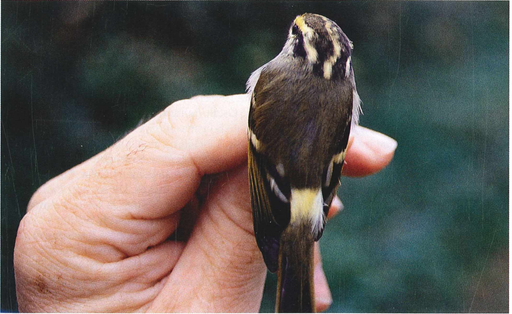
Slika 3: Izrazito rumena trtica Figure 3: Explicitly yellow rump