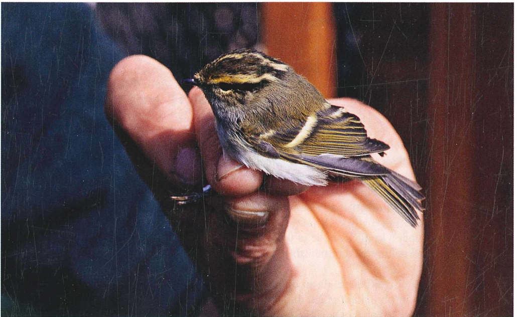
Slika 4: Dve rumeni progji na perutih Figure 4: Two yellow wing-bars