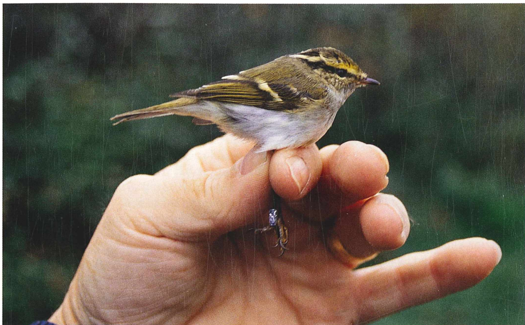
Slika 2: Značilno rumena nadočesna proga