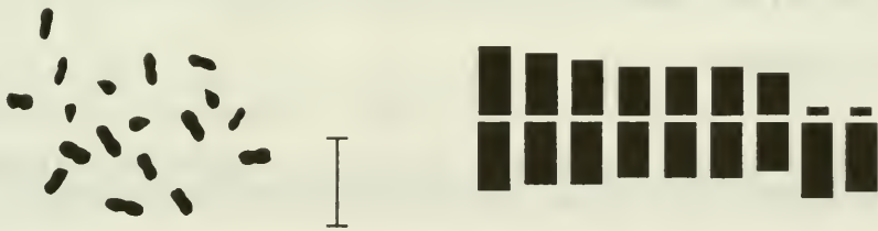
Abb. 1 Metaphaseplatte und Karyogramm von C. campanae Phil. Maßstab: 5 µm

Ein möglicher Grundtyp (Abb. 1), bestehend aus sieben bzw. acht ± metazentrischen und einem bzw. zwei akrozentrischen Chromosomenpaaren, scheint für die meisten Arten zutreffend zu sein. Bei mehreren Arten lassen sich auch Mikrosatelliten beobachten. Eine Gruppierung der Arten zu bestimmten Karyotypen oder gar eine genaue Zuordnung eines Karyotyps zu einer Art ist mit den momentan zur Verfügung stehenden Hilfsmitteln nicht oder nur sehr unbefriedigend möglich.