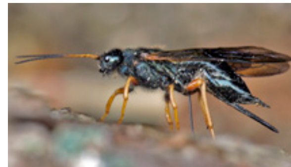
Abb.2: Sirex juvenicus bei der Eiablage, Rothwald.

Im Tiefland nur punktuell, im Mittelgebirge häufiger, manchmal schädlich, an Abies alba , Pinus sylvestris (Taeger et al. 1998); Rote Liste Deutschland: mäßig häufig, ungefährdet (Liston et al. 2011). Rothwald: 3 ♀♀ (24.8.1999, leg. Ressler; 8.8.1998, leg. Kust, 17.8.2000, leg. Kust, alle det. Schedl, coll. NÖLM), Kust & Ressler (2001).