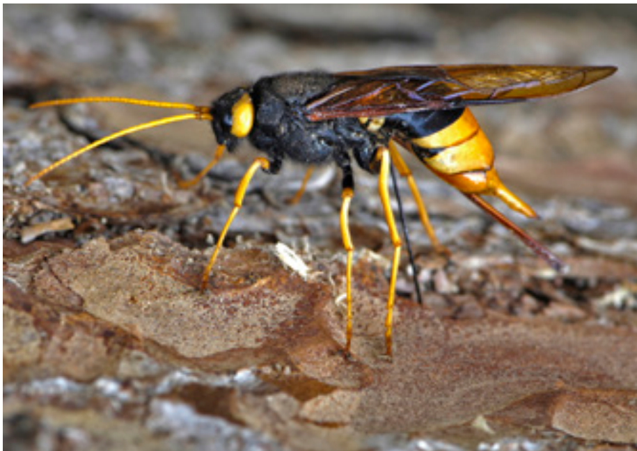
Abb.3: Uroceras gigas bei der Eiablage, Rothwald.

Häufig in charakteristischen Lebensräumen (Taeger et al. 1998, Liston et al. 2011). Rothwald, ♀ (12.7.1999, leg. Kust, det. Schedl, coll. NÖLM), Kust & Ressler (2001).