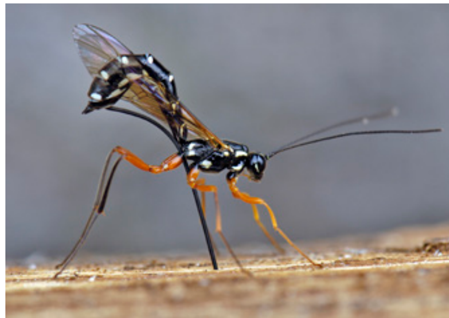
Abb.5: Rhyssa persuasoria bei der Eiablage, Rothwald.

Megarhyssa -Arten (Hymenoptera, Apocrita, Ichneumonidae/Schlupfwespen) sind in Mitteleuropa selten oder nur lokal häufig. M. rixator ist ein Parasitoid von Sirex und Uroceras (siehe 1.4) und kommt vor allem in ursprünglichen Nadelwaldgebieten (Schwarzwald, Alpen) vor (Horstmann 1998). In Österreich gilt die Art als großräumig verbreitet, wird aber selten gefunden und publiziert. Wo größere Bestände absterbender Bäume einer natürli-