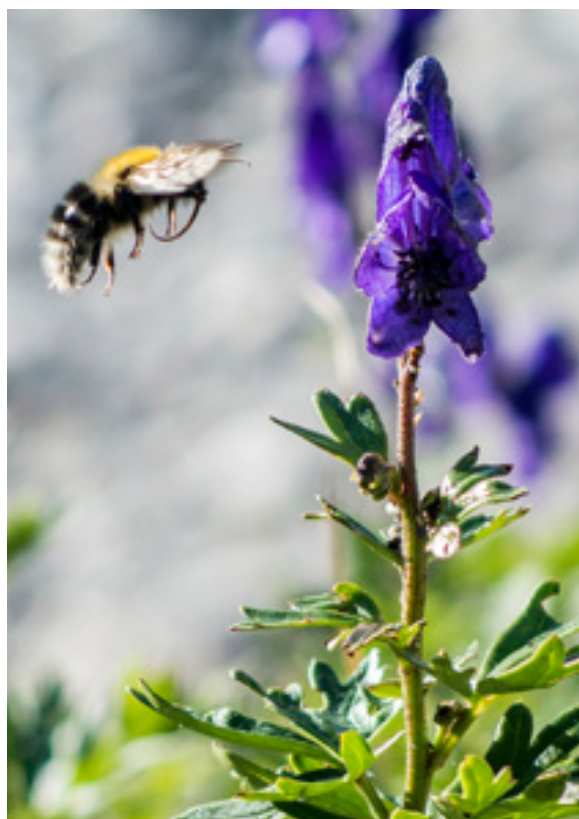
Abb.10: Bombus gerstaeckeri beim Landeanflug auf Aconitum napellus , Dürrenstein-N-Seite.

(Westrich et al. 2011). Aus der Umgebung des Wildnisgebietes gemeldet – Thaleralm und Hochkar (Ressler 1995), aus dem Dürrensteingebiet (Kust 2004) sowie aus dem Nationalpark Gesäuse (Neumayer 2009). Im Wildnisgebiet aus der Umgebung Rothwald nachgewiesen (Kust & Ressler 2001). Da speziell die Arbeiterinnen von B. cryptarum stark denen von B. lucorum ähneln, ist die Unterscheidung oft kaum möglich.