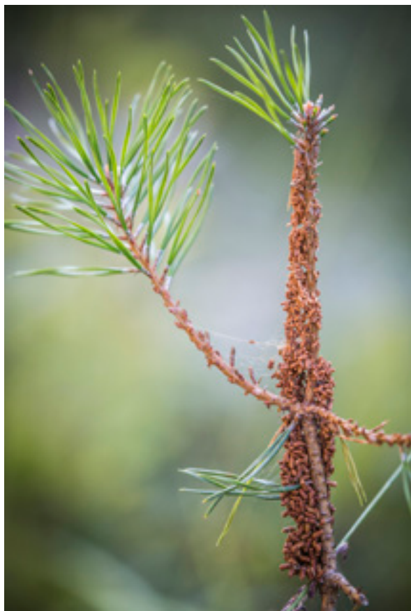
Abb.1: Kotsäcke einer Kieferngespinstblattwespe, Hundsau.