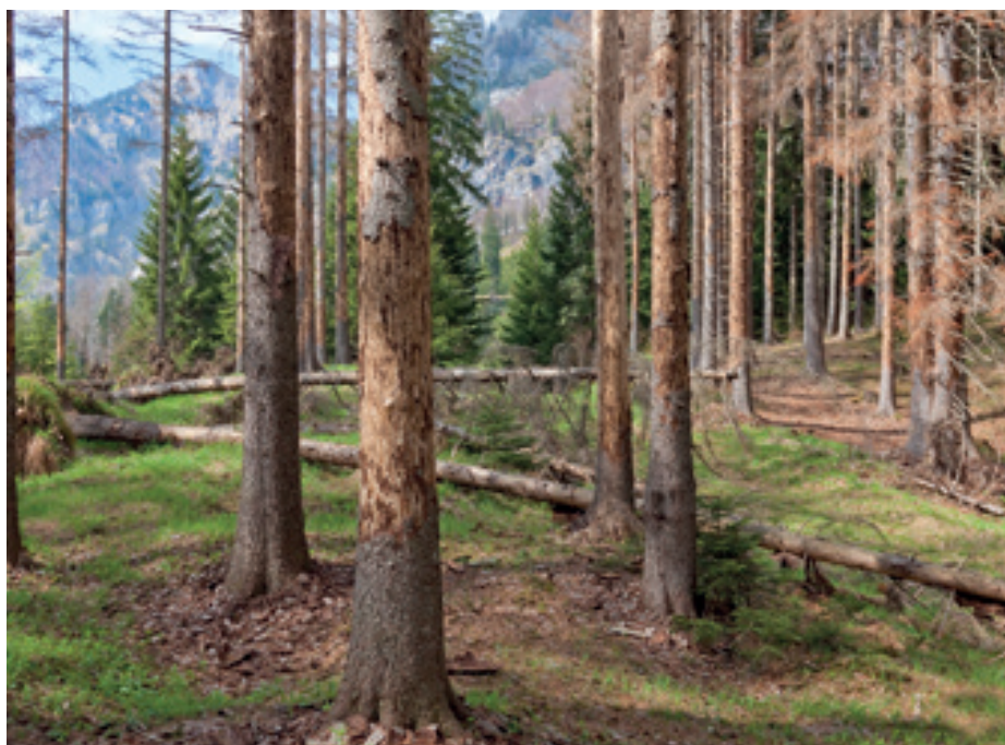
Abb.8: Lebensraum von Megarhyssa rixator , Hundsau.

Hummeln sind neben den Honigbienen die bedeutendsten Bestäuber in der Paläarktis. Während die Honigbiene in der Kulturlandschaft durch den Menschen intensiv kultiviert wird und daher weit- aus häufiger ist, als sie ohne Bienenzucht wäre, sind Honigbienen im Wildnisgebiet kaum anzutreffen und sind hier als Nahrungskonkurrenten zu Hummeln und Wildbienen unbedeutend. Daher sind Hummeln hier die effektivsten Bestäuber, vom Beginn der Vegetationsperiode bis in den Herbst. Zwar werden sie als Blütenbesucher zahlenmäßig oft von Fliegen, Käfern, Ameisen und Schmetter-