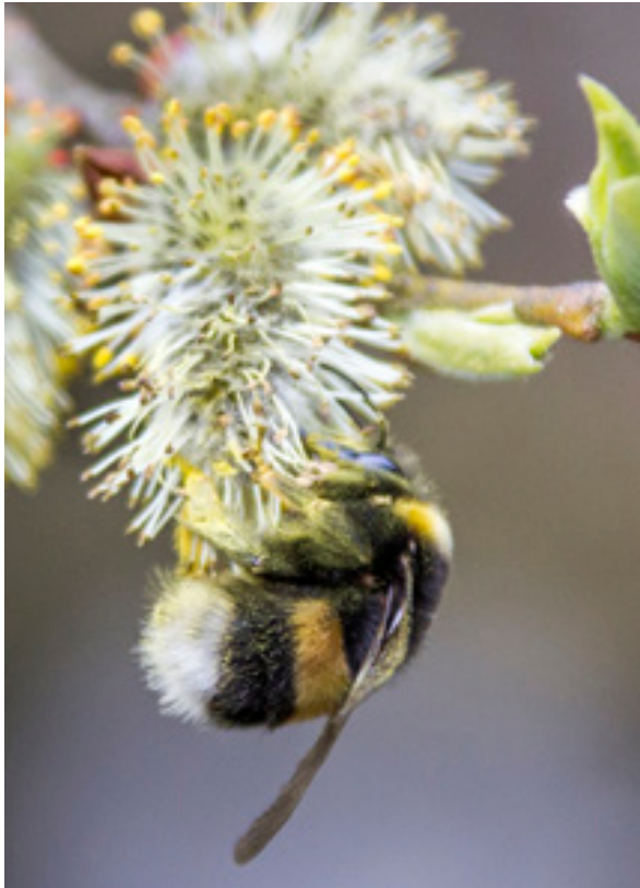
Abb.18: Eine Königin von Bombus lucorum beim Blütenbesuch auf Salix , Hundsau.