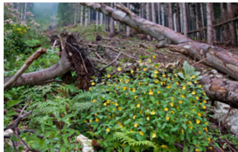
Abb.4: Vorkommen von Impatiens-noli-tangere im Lawinengang, Hundsau 2009.

Allgemein verbreitet, in typischen Lebensräumen recht häufig, vor allem im Mittelgebirge (Taeger et al. 1998); Rote Liste Deutschland: mäßig häufig, ungefährdet (Liston et al. 2011). Hundsau, ♀ (20.6.1999, leg. Kust, det. Schedl), Kust & Ressler (2001, 2015). Mit starken Populationsschwankungen, auf Impatiens noli-tangere (Abb. 4), nicht auf den neophytischen Impatiens -Arten!