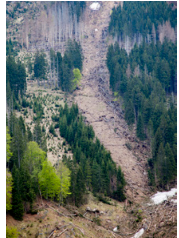
Abb.16: Der obere Verlauf des großen Lawinenabgangs von 2009 in der Hundsau.

Allen genannten Arten von Aconitum gemein ist die Ausbildung von langen Blütenröhren, wodurch das Erreichen des Nektars in der obersten Blüten Spitze nur Hummeln mit sehr langen Rüsseln möglich ist: ♀♀ der Eisenhuthummel