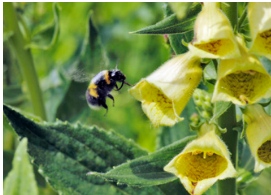
Abb.17: Bombus hortorum beim Landeanflug auf Digitalis , Hundsau.

Bis 2000 m verbreitet, im Mittelland Bestandsrückgang, nistet meist oberirdisch versteckt unter Grasbüscheln, Nestbauer (Amiet 1996). Ein Nachweis der Art aus dem Wildnisgebiet (Hundsau), leider ohne zusätzliche Detailinformation (Kust & Ressler 2001, Kust 2004). Im Nationalpark Gesäuse nicht zu erwarten (Neumayer 2009). Im langfristigen Bestandstrend in Deutschland stark rückgängig, gefährdet (Westrich et al. 2011). Anspruchsvolle, wärmeliebende Art, die südexponierte Hänge bevorzugt. Das Erscheinungsbild der Hummel ist farblich variabel, Verwechslungsmöglichkeit mit anderen Arten.