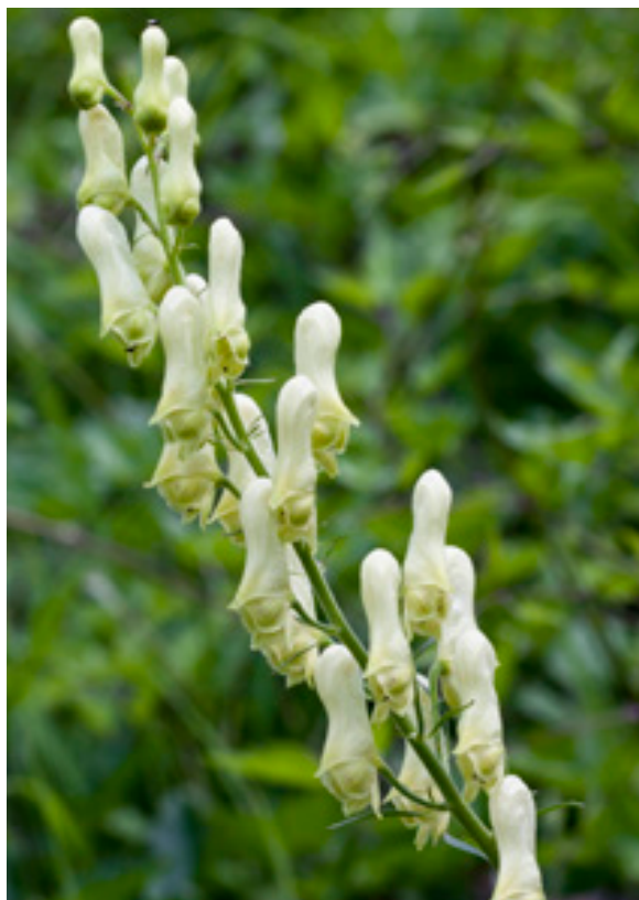
Abb.13: Aconitum vulparia , Hundsau.

zen angetroffen werden. Lebensräume sind lichte Wälder und Weiden, die Nester werden im Boden in alten Mäusenestern angelegt (Amiet 1996). Das Vorkommen der Art in Deutschland ist unverändert extrem selten (Westrich et al. 2011). B. gerstaeckeri ist aus dem gesamten Dürrensteingebiet bekannt (Ressler 1995, Kust 2004), aus dem Wildnisgebiet (Kust & Ressler 2001, Kust 2004) sowie aus dem Nationalpark Gesäuse (Neumayer 2009). - Belegfunde am NÖLM: Hundsau, ♀ (15.8.1998, leg. Kust, det.