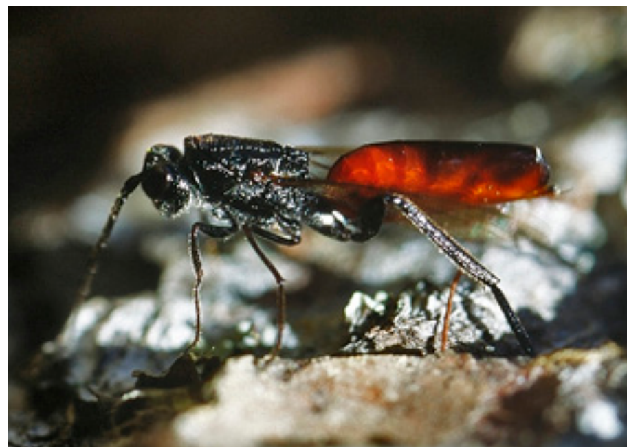
Abb.9.: Ibalia leucospoides bei der Suche nach dem Einstichkanal einer Holzwespe, Rothwald.