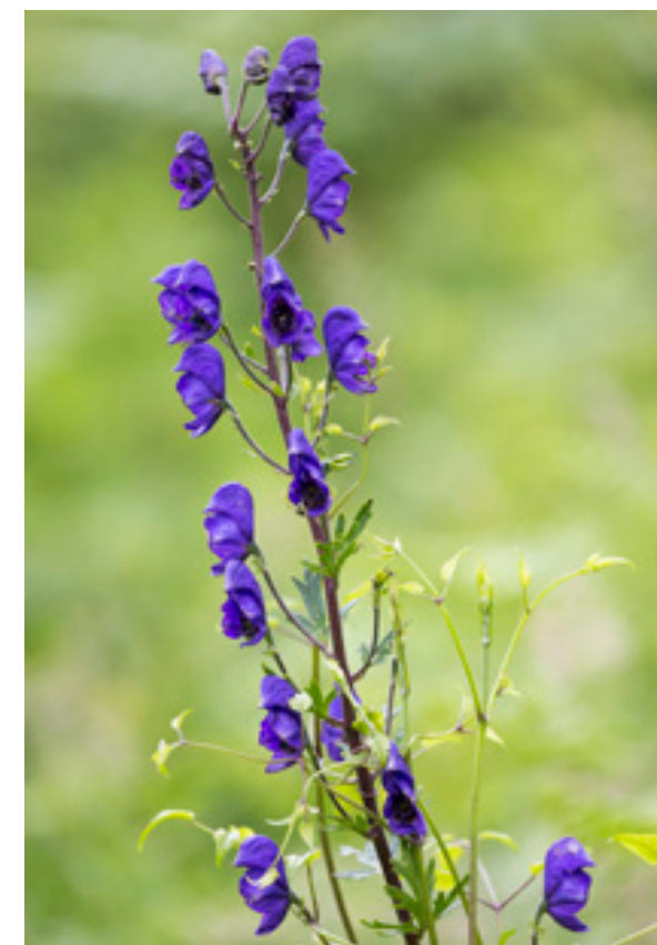
Abb.11: Aconitum napellus , Lawinengang, Hundsau.

In den Alpen bis 2000 m verbreitet, an Eisenhut ( Aconitum napellus , Abb. 10, 11; A. variegatum , A. vulparia , Abb. 12, 13) gebunden (= Oligolektie: Sämtliche Weibchen einer Art sammeln Pollen ausschließlich an einer Pflanzenart oder an nah verwandten Pflanzenarten), die Eisenhuthummel kann bei Nektaraufnahmen auch an anderen Pflan-