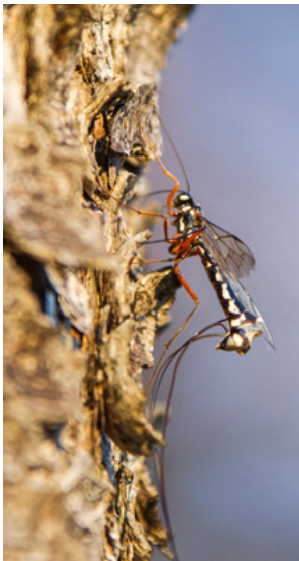
Abb.6: Megarhyssa rixator auf der Suche nach einer optimalen Einstichstelle für die Eiablage, Hundsau. Der lange Legebohrer ist nicht zur Gänze abgebildet.

chen Entwicklung unterliegen, ist mit dem sicheren Vorkommen von Megarhyssa -Arten zu rechnen.