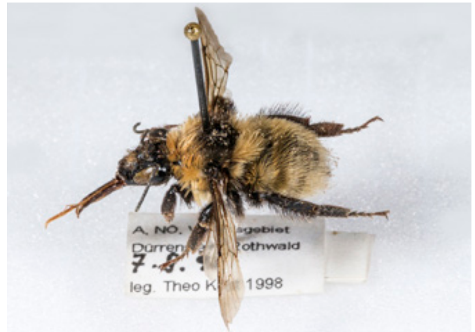
Abb.19: Belegfund (Präparat) von Bombus mesomelas , coll. Niederösterreichisches Landesmuseum.

1500 und 2700 m, nistet unterirdisch in alten Mäusenestern (Amiet 1996); in Deutschland selten, aber nicht gefährdet (Westrich et al. 2011). Die Männchen unternehmen von geeigneten Sitzwarten aus Kontrollflüge, wobei sogar größere vorbei fliegende Insekten „begutachtet“ werden. Von Ötscher (1893 m) und Hochkar (1808 m) gemeldet (Ressler 1995), ebenso aus den Gipfelregionen im Nationalpark Gesäuse (Neumayer 2009). In Kust (2004) für das Dürrensteingebiet angegeben, der Fund bezieht sich allerdings auf das Vorkommen am Hochkar. Im Wildnisgebiet Dürrenstein konnte bisher kein Nachweis gelingen, ein Vorkommen der Art wäre aber in den Gipfelregionen von Dürrenstein (1878 m) und Noten (1635 m) durchaus zu erwarten.