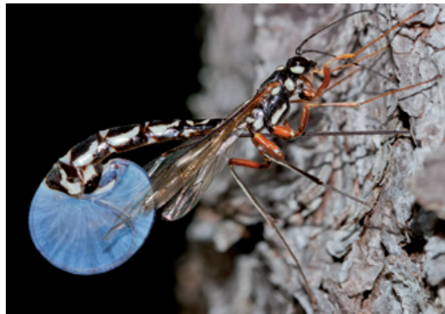
Abb.7: Megarhyssa rixator beim Einbohren in einen geschädigten Fichtenstamm, Hundsau. Charakteristisch für diese Art sind die stark aufgeblähten Intersegmentalhäute am Hinterleibsende während des Einstichvorganges. Der Vorgang der Eiablage konnte über 30 Minuten lang beobachtet werden.

Die Schlupfwespe M. rixator hat einen acht Zentimeter langen Legebohrer, der damit doppelt so lang ist wie der Körper – eine außergewöhnliche Besonderheit dieser Art, denn die meisten Schlupfwespenarten haben nur höchstens körperlange Legebohrer, z.B. die auf den ersten Blick leicht mit M. rixator verwechselbare, häufig anzutreffende Art Rhyssa persuasoria , Abb. 5. M. rixator zieht vor Beginn des Bohrvorgangs den Legebohrer (der in der Ruhelage nach hinten ausgestreckt ist und dem vier Zentimeter langen Tier dann eine Gesamtlänge von zwölf Zentimeter verleiht, Abb. 6) in den Hinterleib zurück und lässt ihn am Rücken zwischen den hinteren Segmenten als Schleife wieder austreten. Dabei spannt sich die Intersegmentalhaut sozusagen wie ein Tennisschläger auf. Erst jetzt kann die Wespe den Bohrer ansetzen und ins Holz treiben – Abb. 7. Das Weibchen von M. rixator spürt mittels Geruchssinn (wahrscheinlich auch durch die Wahrnehmung von Vibrationen) die sich im Holz entwickelnden Wirtslarven auf. Die geruchliche Wahrnehmung wird durch einen