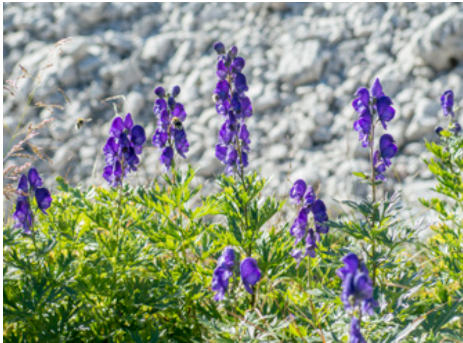
Abb.15: Aconitum napellus mit mehreren blütenbesuchenden Eisenhuthummeln, Dürrenstein-N-Seite.

nen Bereich, ist aber auf den Almen und Gipfelregionen die einzige Aconitum -Art und kann dort in größeren Ansammlungen vorkommen. Der Gelbe Eisenhut, auch Wolfseisenhut ( Aconitum vulparia ) kommt ebenfalls nur zerstreut von der Tallage bis in den subalpinen Bereich in lichterem Waldbereichen und Waldrändern vor. Ellmauer (2011) erwähnt in seiner Monographie der Blumen des Wildnisgebietes zwei Aconitum -Arten – A. napellus und A. lycoctonum . Letztere Art, der Gelbe Eisenhut, tritt in Mitteleuropa in zwei Unterarten auf: A. lycoctonum lycoctonum und A. l. vulparia . Eine genaue Unterscheidung dieser Unterarten war im Rahmen dieser Arbeit nicht möglich, so dass der Gelbe Eisenhut