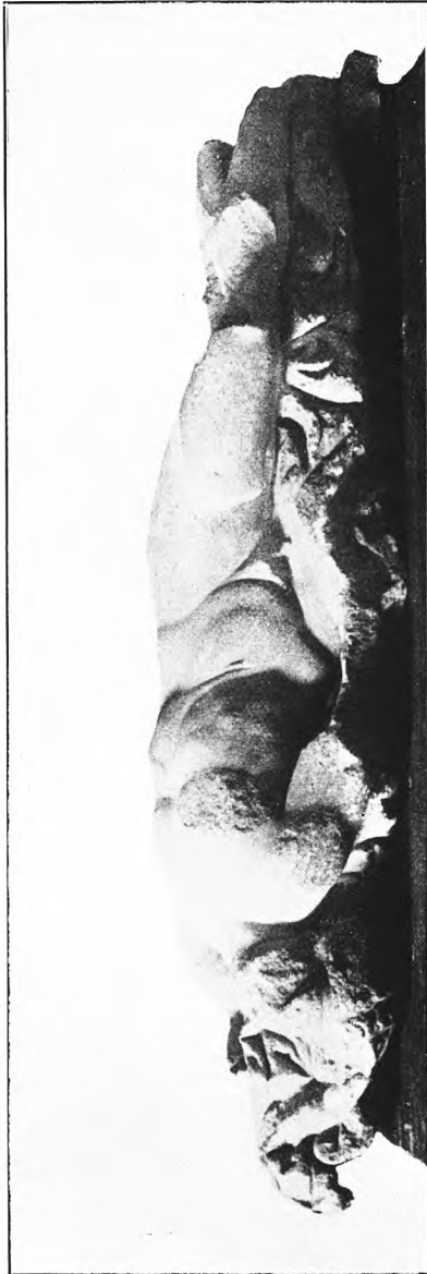
Giebelfigur im Museum zu Epidauros.