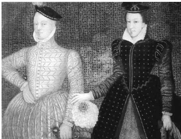
Maria Stuart (1542–1587) und ihr zweiter Ehemann, Henry Stuart, Lord Darnley (1545–1567), Anon., ca. 1565

Kernthese, ist ein politisches Zeitstück, ein drame à clef , Shakespeares melancholischer Dänenprinz ein Porträt des Schottenkönigs Jakob, der 1603 als Nachfolger Elisabeths den englischen Thron bestieg. Wie Hamlet verlor auch Jakob seinen Vater Lord Darnley durch Mord, 1567, und wie Gertrude bei Shakespeare heiratete seine Mutter, Maria Stuart, wenig später in «schnöder Hast» seinen Mörder ( Hamlet , 1.2). 39