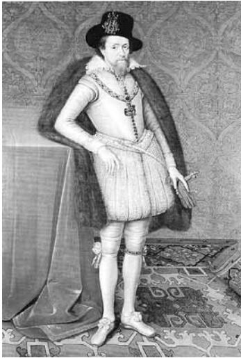
John de Critz, Jakob I. (um 1606)