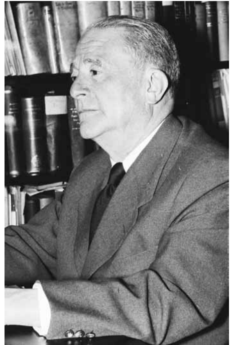
Carl Schmitt, Mitte der Fünfzigerjahre