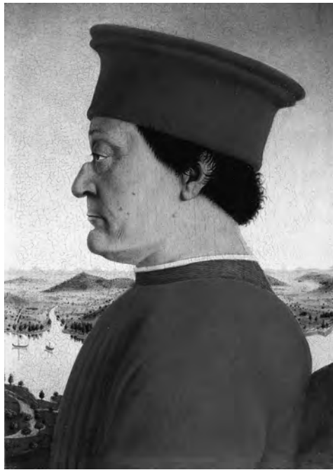
11 Piero della Francesca, Porträt des Federico da Montefeltro. Florenz, Uffizien

(Übersetzung nach Varchi 2013, S. 197; vgl. McHam 2013, S. 271). – Die Weiterführung des Topos kann hier nicht verfolgt werden; vgl. etwa Schmidt 2014.