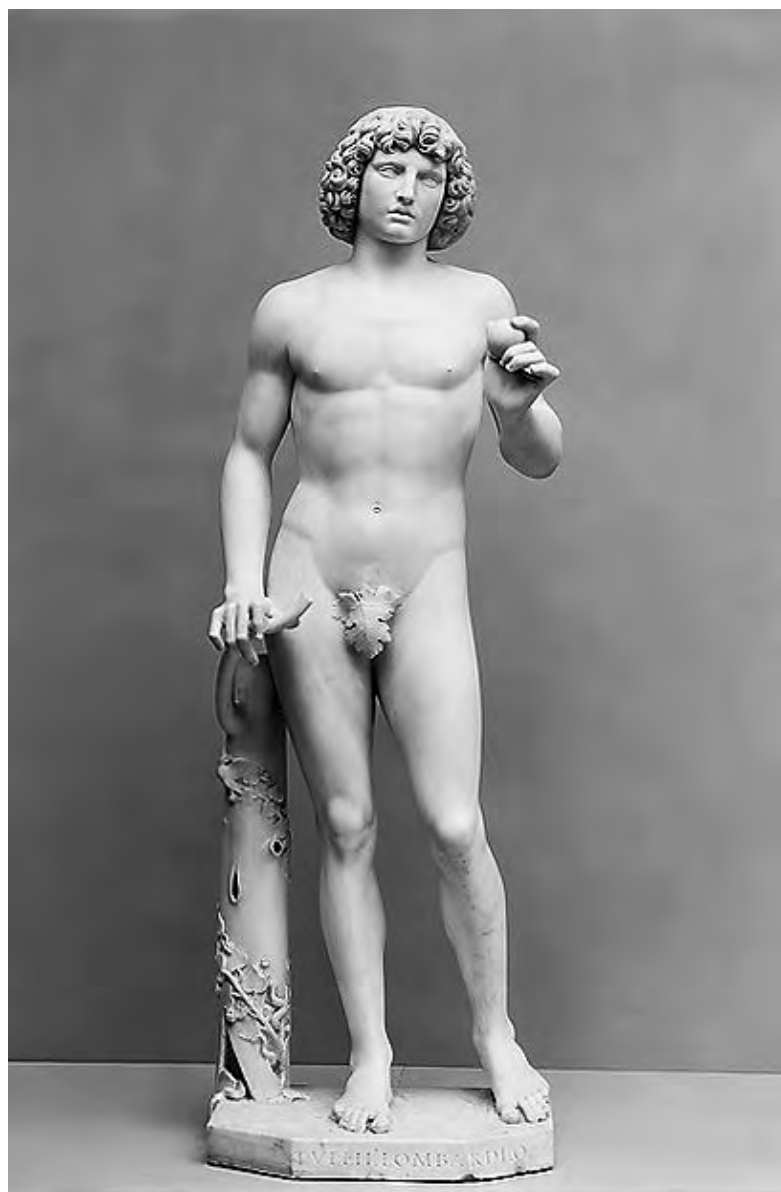
14 Tullio Lombardo, Adam. New York, The Metropolitan Museum of Art