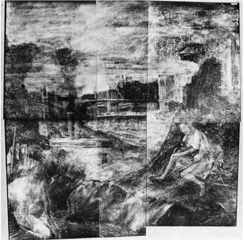
2 Giorgione, Tempesta . Röntgenaufnahme

Unter der Tempesta im heutigen Zustand verbirgt sich dann noch eine abweichende Fassung, die 1939 mit einer Röntgenaufnahme entdeckt wurde (Abb. 2): Der Sitzenden mit Kind war hier anstelle des jungen Mannes eine nackt am Ufer sitzende Frau beigesellt. Weitere Untersuchungen in den 80er Jahren bestätigten diese Figurenkonstellation – auf deren Deutung noch zurückzukommen sein wird – und erschlossen weitere Veränderungen, deren Interpretation zum Teil umstritten ist. 5