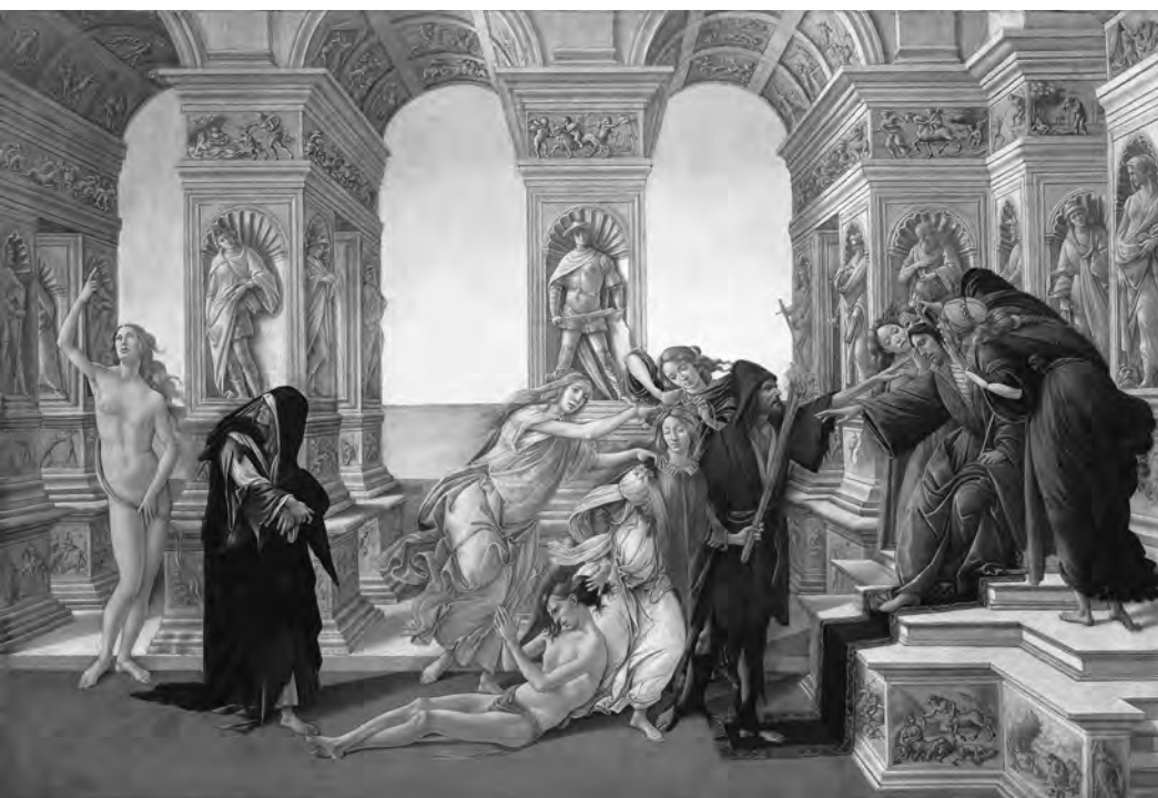
16 Botticelli, Die Verleumdung des Apelles . Florenz, Uffizien