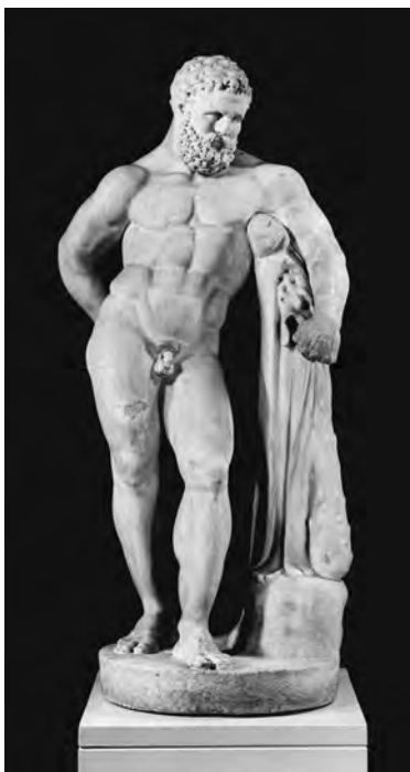
5 Lysipp, Herakles (römische Kopie). Leiden, Rijksmuseum van Oudheden

Paatz 1959. – Ihren Höhepunkt findet die Gestaltungsweise in Michelangelos Ignudi auf der 1508 bis 1512 entstandenen Decke der Sixtina mit ihren geradezu verspielten Positionen; hier wird der Einfluss der 1506 entdeckten Laokoongruppe deutlich. Vatikan, Sixtinische Kapelle, Decke; vgl. Himmelmann 1985, S. 33–35; Panofsky 2014, S. 173–177. Laokoon Vatikan 1059, 1064, 1067; vgl. Steinhart 2014, S. 47–57. Rezeption: Bober – Rubinstein 2010, S. 164–168 Nr. 122; McHam 2013a, S. 215–224.