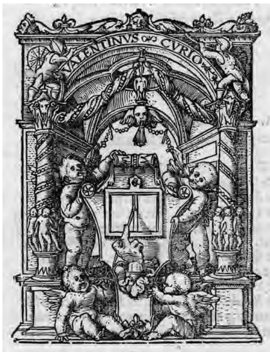
15 Holbein d. J., Buchmarke für Valentinus Curio. London, British Museum

[81] Reizvoll ist eine Begebenheit, die sich zwischen Protogenes und ihm abspielte. Jener lebte auf Rhodos; als Apelles dort gelandet war, begierig die Werke eines Mannes, der ihm nur dem Rufe nach bekannt war, kennen zu lernen, begab er sich sofort in dessen Werkstatt. Der Künstler selbst war abwesend, eine alte Frau aber bewachte eine auf der Staffelei stehende Tafel von beachtlicher Größe, die für das Malen zurechtgemacht war. «Die Frau» gab Bescheid, Protogenes sei fortgegangen, und fragte, wen sie als Besucher nennen solle. »Diesen«, sagte Apelles, nahm einen Pinsel und zog mit Farbe eine farbige Linie höchster Feinheit über die Tafel. [82] Nachdem Protogenes zurückgekehrt war, berichtete ihm die alte Frau, was sich ereignet hatte. Man erzählt, der Künstler habe die Feinheit «der Linie» betrachtet und sogleich gesagt,