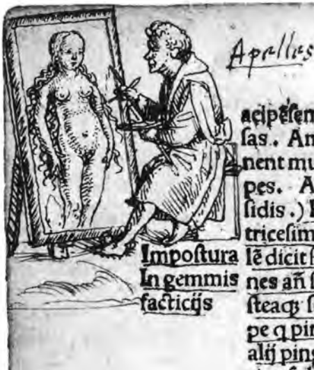
10 Holbein d. J., Apelles malt Aphrodite. Basel, Kupferstichkabinett

der am Textrand des 1515 erschienen «Lobes der Torheit» des Erasmus von Rotterdam (1466? – 1536) Apelles beim Malen wiedergegeben hat (Abb. 10); die Darstellung ist einer Erwähnung des Malers im Text geschuldet, die geradezu Auswüchse eines Künstlerkults erahnen lässt. 66