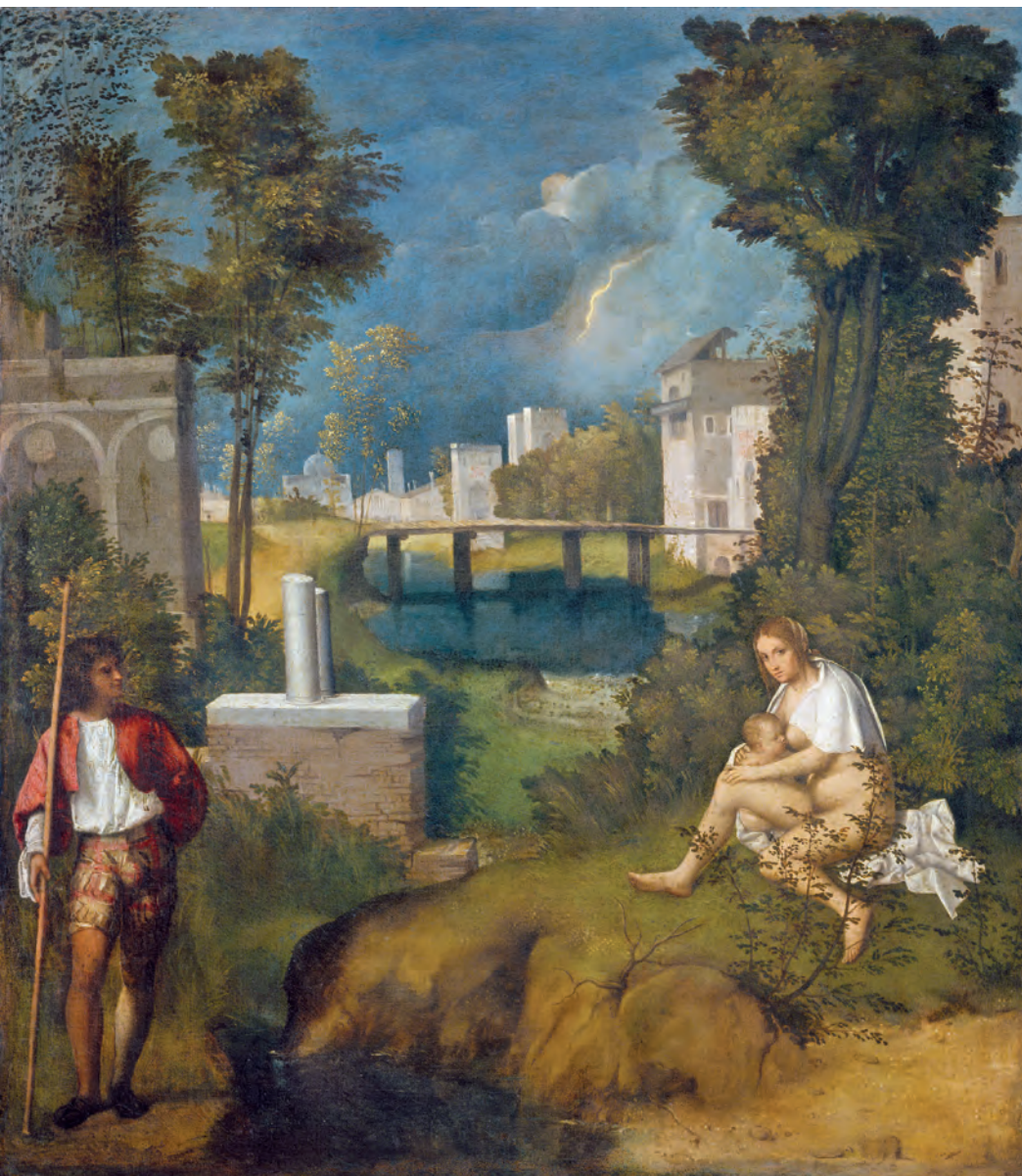
1 Giorgione, Tempesta . Venedig, Galleria dell'Accademia