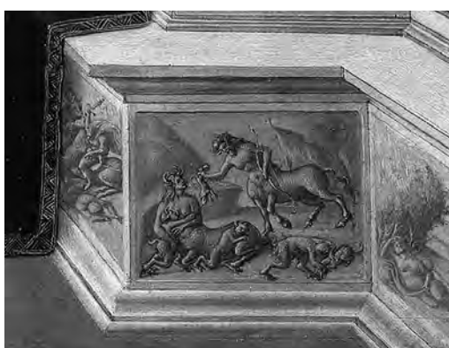
17 Botticelli, Die Verleumdung (Ausschnitt). Der Dornauszieher