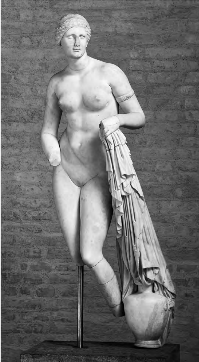
9 Praxiteles, Aphrodite von Knidos (römische Kopie). München, Glyptothek