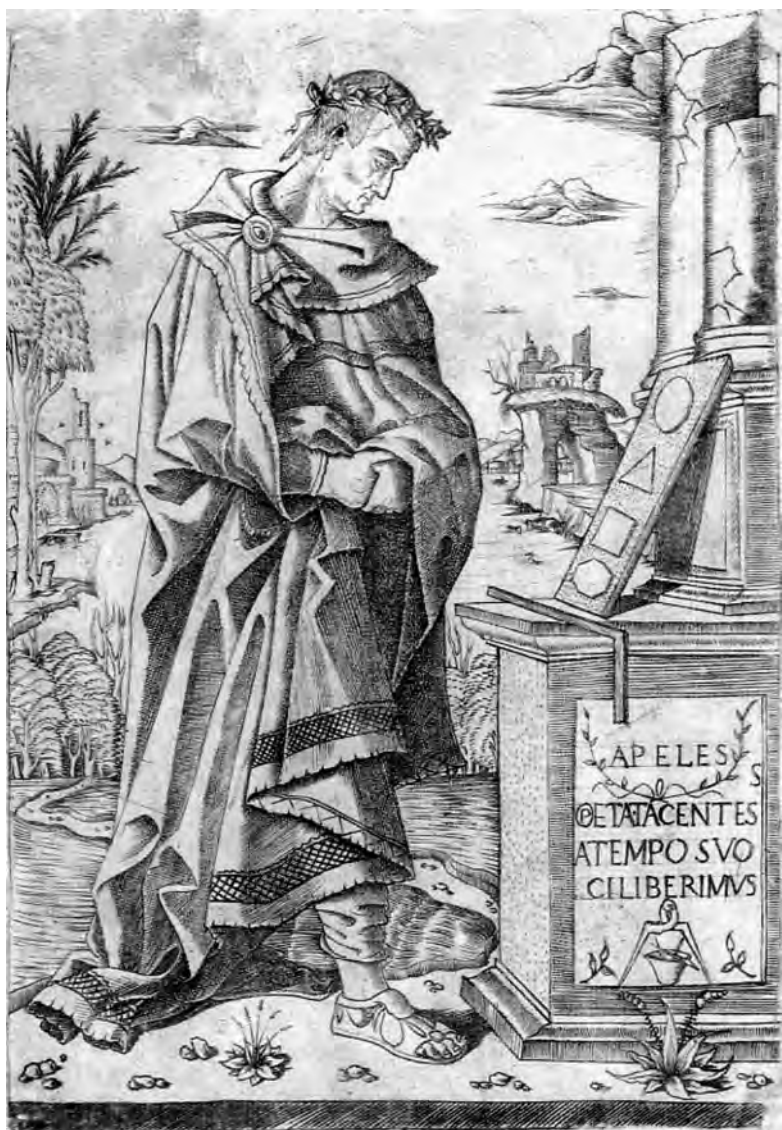
13 Nicoletto da Modena, Apelles. London, British Museum