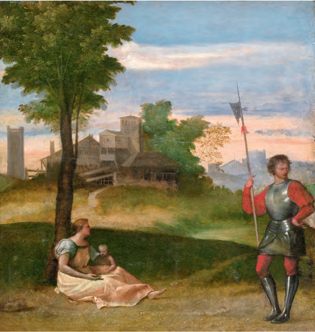
4 Titian, Soldat und Frau mit Kind. Harvard Art Museums