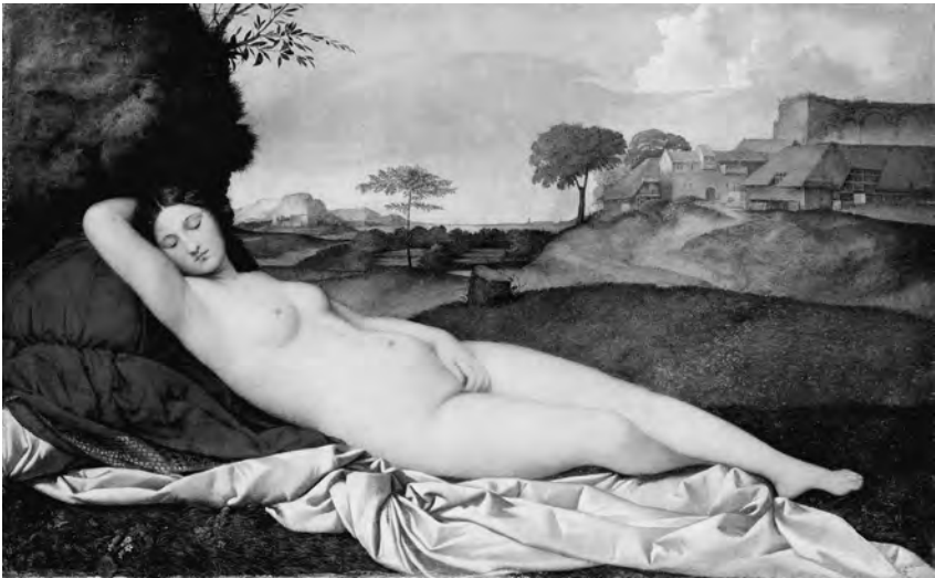
6 Giorgione, Venus. Dresden, Staatliche Kunstsammlungen