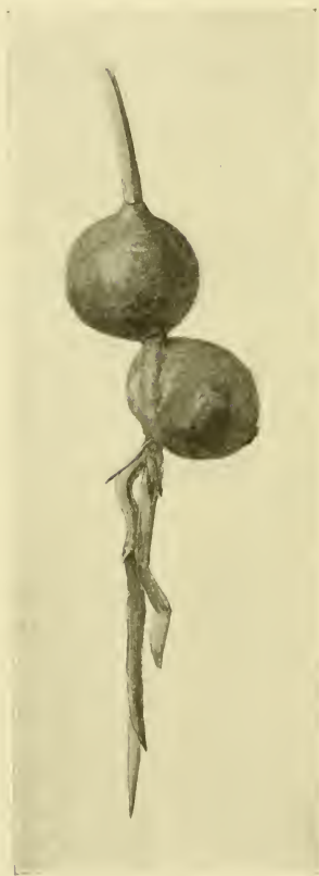
Fig. 1 1)

da sie nachgiebig ist, vor sich hergeschoben, d. h. eingebuchtet haben, und diese Einbuchtung müßte sich dann auch jetzt noch