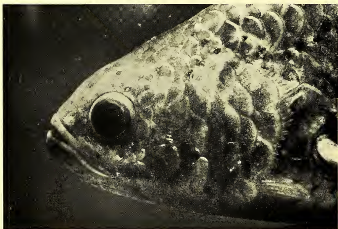
Abb. 4: Kopf eines erwachsenen Weibchens (14 cm), mit nur schwachen Andeutungen eines Dornenfelds. Head of an adult female (14 cm), with the patch of thorns only weakly developed.

nenschuppen kommen, die jedoch in der Stärke ihrer Ausprägung höchstens denen sehr kleiner Männchen entsprechen.