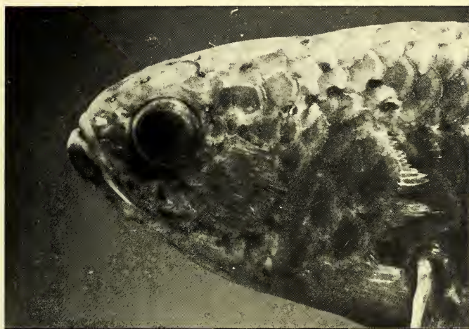
Abb. 2: Kopf eines erwachsenen Männchens (14 cm) von Ctenopoma multispinis , mit Dornenfeld hinter dem Auge.

Morphologisch ist Ctenopoma zunächst charakterisiert durch eine auffallend lange Dorsale (XIV-XX/7—12) und eine etwas kürzere Anale (VII—XI/7—12). Beide Flossen besitzen verlängerte weiche Strahlen und sind daher an ihren Hinterlappen leicht zugespitzt; die Caudale ist abgerundet. Die Ventrals weist einen Stachelstrahl und fünf Gliederstrahlen (I/5) auf. Der Rand des Kiemendeckels ist scharf gezähnt, ohne jedoch — wie bei Anabas — Stacheln zu tragen. Er hat zwei halbmondförmige Einschnitte und drei Lappen, von denen die beiden oberen dem Operculum, der untere dem Sub- und Interoperculum angehören; das Praeoperculum ist ungezähnt. Feine, gekrümmte Zähnchen sitzen auf den Kiefern; auch der Praevomer und die Seiten des Palatum sind bezahnt, wodurch sich diese Fischgruppe als carnivor ausweist. Vom Scheitel abgesehen sind die harten, rauhen Schuppen des Kopfes und Rumpfes an ihrem Hinterrand mit kammförmigen Zähnchen besetzt (Abb. 2); es handelt sich also um ausgeprägte Ctenoidschuppen. Die Seitenlinie ist unterbrochen (Abb. 5).