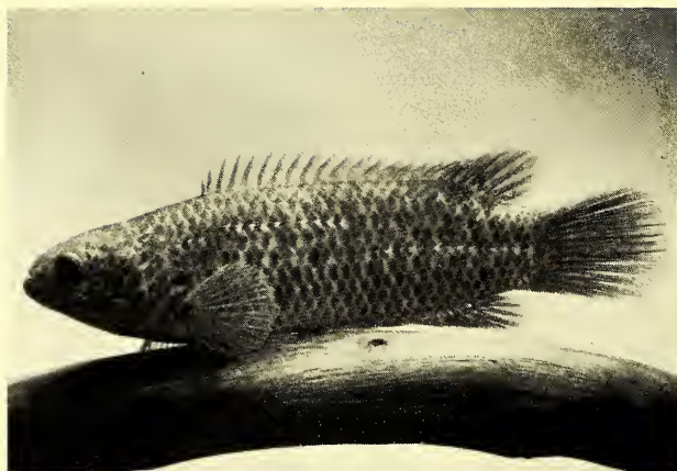
Abb. 5: Männchen von Ctenopoma multispinis (12 cm) in typischer Stellung; deutlich erkennt man die unterbrochene Seitenlinie. Male of Ctenopoma multispinis (12 cm) in its typical position; the interrupted lateral line can clearly be seen.

1971: 21). Außerdem zählt Ct. multispinis zur Ichthyofauna des Congo-Beckens (Angola, Zaïre), und schließlich kennt man den Fisch aus der Südafrikanischen Republik (Natal).