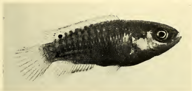
Abb. 6: Jungfisch (2,2 cm) mit ausgeprägtem Ocellus. Juvenile specimen (2,2 cm) with the characteristic ocellus.

dem am häufigsten zu beobachtenden, meist psychisch gesteuerten Farbwechsel brechen Grundfarbe und Musterung plötzlich unter der Seitenmitte ab und werden dort von einer hellbraunen, schmutziggelben bis silberweißen Tönung abgelöst, die sonst nur der Bauchseite eigen ist. Andererseits kann es, bei Anpassung an einen dunklen Unter- bzw. Hintergrund, zu einer fast einheitlichen Dunkelfärbung des Körpers kommen.