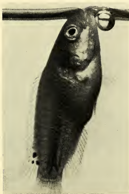
Abb. 7: Jungfisch von Ctenopoma multispinis (2,2 cm) beim Luftholen; der Mund durchstößt gerade die Wasseroberfläche. Rechts die vorher ausgespuckte Luftblase.

Zur Aufzucht der Brut wurden mehrmals täglich Artemia salina mittels eines Glasrohrs unter die Wasseroberfläche verteilt; staubfeines, auf die Oberfläche gestreutes Trockenfutter diente als Zusatznahrung. Nach einer Woche pipettierte man 60 bis 70 Jungtiere heraus und setzte sie in ein 10-Liter-Becken (Wassertemperatur 25° C). Dreieinhalb Wochen später schwammen die Fische in kurzen Abständen heftig atmend zur Oberfläche, um dort ihr neugebildetes Labyrinth mit Luft zu füllen. Die im Labyrinth verbrauchte Luft spukten sie anfänglich schon auf halbem Wege zur Oberfläche aus. (Schon 10 Tage zuvor hatten sie, trotz guter Durchlüftung, stark geatmet, was auf ihren Sauerstoffbedarf hinwies.) Nach einigen weiteren Tagen wurde die Luft erst unmittelbar unter der Oberfläche ausgespuckt (Abb. 7).