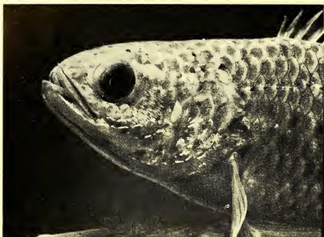
Abb. 3: Kopf eines jüngeren Männchens (9 cm). Head of a half-grown male (9 cm).