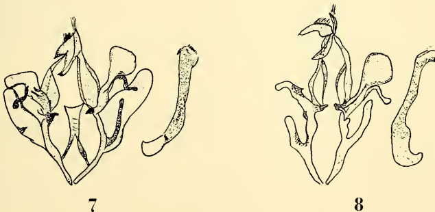
Fig. 7: Génitalia mâle de (Male genitalia of) Achaea nigristriata n. sp. (45 : 1).

Femelle : De taille identique à celle du ♂. Elle en diffère cependant par la couleur fondamentale des ailes antérieures plus noire. Lignes antémédiane, médiane, et subterminale présentes et soulignées d'une fine ligne blanc bleuâtre. Il y a à l'apex une importante tache marron clair, et au bord externe de l'aile il y