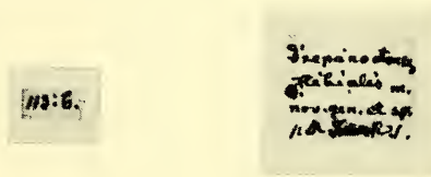
Abb.2: Drepanoctonus tibialis Pfank. Originaletiketten in der Handschrift Kriechbaumers.