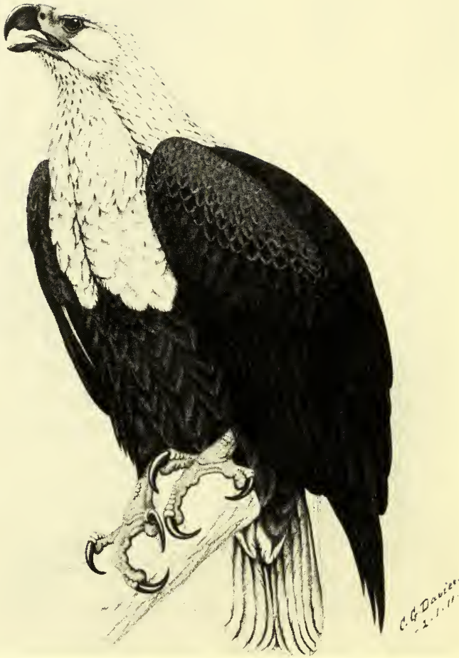
Abb. 3: Schreiseeadler, Haliaeetus vocifer . (Nach FINCH-DAVIES 1976)

zug auf die Flügellänge unterstreichen, wenn er in etwa gleicher Weise gemessen hat, wie es in späteren Werken geschah, nicht jedoch bei der Lauflänge. Die Umrechnung der in „pied du roi“ angegebenen Maße für H. albicilla und H. vocifer ergab in mm: