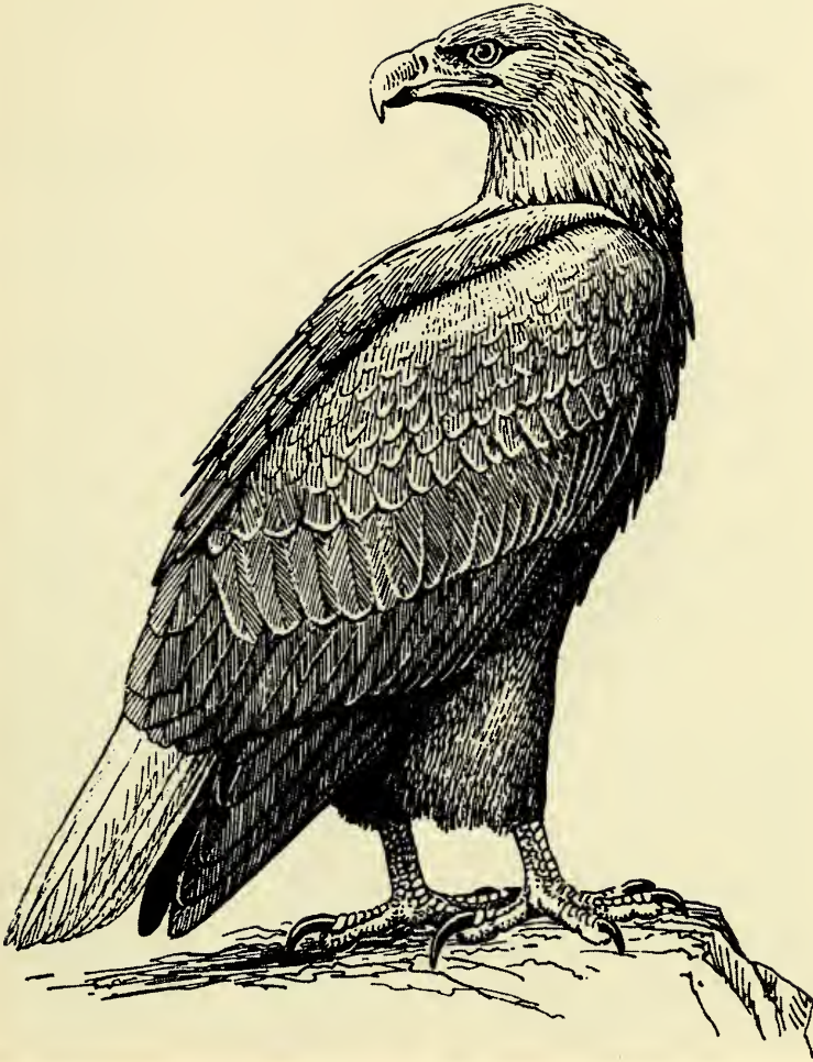
Abb. 2: Seeadler, Haliaeetus albicilla . (Nach ETCHÉCOPAR & HÜE 1967, 142)

Die mit 80 mm Länge auffallend geringe Größe des Tmt der von ihm untersuchte n Mumie war GAILLARD selbst aufgefallen: „Ils ont donc des dimensions sensiblement inferieures à celle des plus petits individus“ – von H. albicilla – „observés par M. Fatio“ (LORTET & GAILLARD 1903, 131). Mit dem Hinweis „Shelley considère la forme égyptienne comme une variété locale des pygargues d’Europe“, womit er eine kleinere Form meint, hält er die Bestimmung als H. albicilla offenbar für abgesichert. H. vocifer zieht er nicht in Erwägung. Dabei kannte SHELLEY diese angebliche kleinere Form des Seeadlers offenbar selbst nicht (1862, S. 204, 325), sondern beruft sich wiederum auf VON HEUGLIN. Dieser hervorragende Kenner der Vogelwelt Nordostafrikas war es, der vorsichtig ausgesagt hatte, daß der echte Seeadler Ägyptens „vielleicht als besondere, kleinere klimatische Varietät zu betrachten“ sei. VON HEUGLIN (1869, 52) gibt Maße für diese ägyptischen Seeadler an, die seine Ansicht vielleicht in be-