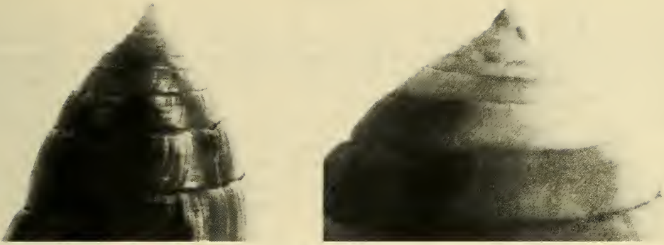
Abb. 2: Erste Spirarumgänge: links Conus granum spec. nov., rechts Conus tenuistriatus .