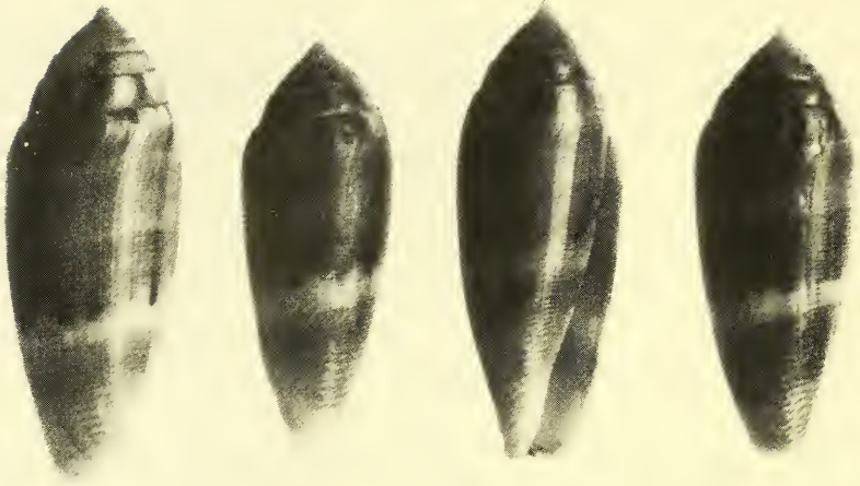
Abb. 1: Conus granum spec. nov., von links: Holotypus und 3 Paratypoide.