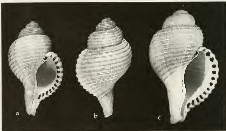
Abb. 2. Linatella pallida , spec. nov. Holotypus, 42.9 mm. a. Ventral view. b. Dorsal view. c. Paratypus 1, 48.1 mm.

Verbreitung. Die neue Art ist bislang außer von den genannten Fundorten nur von Oman (Beu 1986, S. 259, Abb. 30, 31) bekannt, wogegen Linatella (Gelagna) succincta (Linné 1771) vom roten Meer bis Hawaii verbreitet ist und von Bernard (1981) auch zum ersten Mal von der Westküste Afrikas (Port Gentil/Gabon) gemeldet wurde.