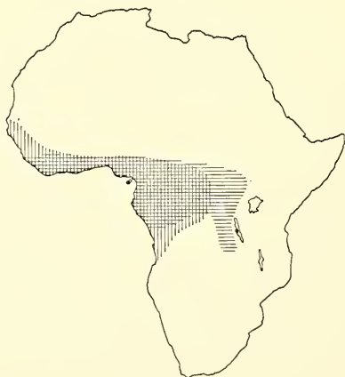
Abb. 1. Verbreitungsgebiet des Panzerkrokodils ( Crocodylus cataphractus ). Die senkrechte Schraffierung bezeichnet das bisher bekannte Vorkommen der Art; dunkle Punkte geben darüber hinaus nachgewiesene Fundorte wieder. Die waagerechte Schraffierung läßt die Ausdehnung des westafrikanischen tropischen Regenwaldes erkennen. — Nach NEILL 1971 (Fig. 138).

Die Verbreitung des Panzerkrokodils umfaßt im wesentlichen das westliche Afrika, doch liegen Belegstücke auch für den Tanganjika-See vor (Abb. 1). LOVERIDGE (1957) schließt daher dieses weitab östlich gelegene Gebiet in das Vorkommen der Art ein. Dem zuerst Genannten von uns (FUCHS) erscheint es jedoch fraglich, ob die Art tatsächlich noch heute am Tanganjika-See zu Hause ist, da er während seiner langjährigen Tätigkeit noch niemals Exemplare von dort erhielt. Künftigen Untersuchungen muß es daher vorbehalten bleiben, diese Frage zu klären.