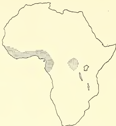
Abb. 2. Verbreitungsgebiet des Stumpfkrokodils ( Osteolaemus tetraspis ). Ob die Vorkommen der westlichen Form ( O. t. tetraspis ) und der östlichen Form ( O. t. osborni ) tatsächlich derart weit voneinander getrennt sind, müssen künftige Untersuchungen klären. — Nach NEILL 1971 (Fig. 142).

Demnach sind O. tetraspis und O. osborni zweifellos unterschiedliche Formen. Ob man sie nun als selbständige Arten oder als geographische Rassen der gleichen Art auffassen will, mag der persönlichen Ansicht jedes einzelnen überlassen bleiben. Aus den hier genannten Gründen betrachten wir die beiden Formen weiterhin als Unterarten ein und derselben Art.