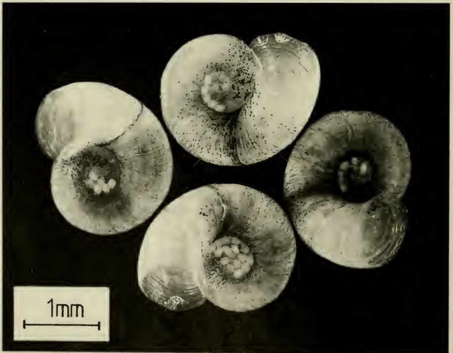
Abb. 2. Gyraulus crista -Gehäuse (in Alkohol konserviert) der Probe vom 10. Mai 1982 mit Cypria ophthalmica -Eiern in der Nabelregion. Der im Frühjahr neu gebildete hellere Gehäuseteil ist durch eine dunkle Grenzmarke vom Überwinterungsgehäuse deutlich unterscheidbar. – Foto: H. LUMPE.

Der Verlauf der ermittelten Durchschnittsgrößen läßt die Zeiten des Gehäusezuwachses erkennen. Eine erste deutliche Wachstumsphase weisen die im Frühsommer/Sommer geschlüpften Tiere von Mitte August bis Mitte Oktober auf. Die Größenzunahme betrug hier 10,7\text{--}13,6\ \mu\text{m} Breitenzuwachs/Tag. Bis Anfang Dezember erfolgte nur noch eine geringe Größenzunahme; danach stagnierte das Wachstum bis Mitte April 1983. Als durchschnittliche Überwinterungsgröße ergab sich eine Gehäusebreite von 1,8\ \text{mm} . Erneutes Wachstum findet im Frühjahr (April–Juni) statt. Die ermittelten Wachstumsraten betragen hier 5,2\text{--}11,4\ \mu\text{m} Breitenzuwachs/Tag.