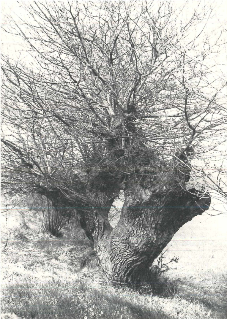
Abb. 1: Kopfgeschneitelte Alteichen am Außenrand einer Wallhecke bei Warendorf als ehemalige Stabilisierungsposten des Hecken-Flechtwerkes.

Im Verlaufe der Neuzeit, vermutlich aber schon im Mittelalter beginnend, zeichnen sich zunehmend zwei Modifikationen in der Laubheuwirtschaft ab, die sicherlich im Zusammenhang mit den Schneitelverböten in der gemeinen Mark, der vermehrten Wiesennutzung und dem Aufkommen der Hackfruchtfütterung im 18. Jahrhundert standen. Die erste zeigt eine allmähliche Reduzierung der Laubfütterung auf das Kleinvieh (Ziegen, Schafe), und die zweite eine zunehmende Verlagerung der Schneitelwirtschaft aus den Markenwäldern auf Einzelbäume,