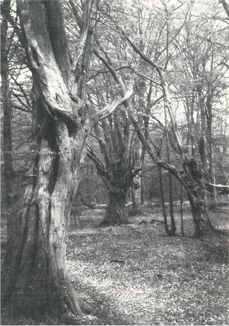
Abb. 4: Alte Kopfhainbuchen im Bentheimer Wald; letzter Abtrieb 1888.