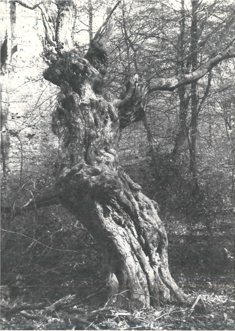
Abb. 2: Durch Schneitelung entstandene, verborkte Kallusbildungen an einer ca. 400 jährigen Hainbuche im Bentheimer Wald.

Verwendung von Ausschlaghölzern bei der Herstellung der Flechtwände. Sie bestanden nach KÖRBER-GROHNE (1967) z.B. auf der röm.-kaiserzeitlichen Wurt Feddersen-Wierde aus mehreren Holzarten mit überwiegender Weide.