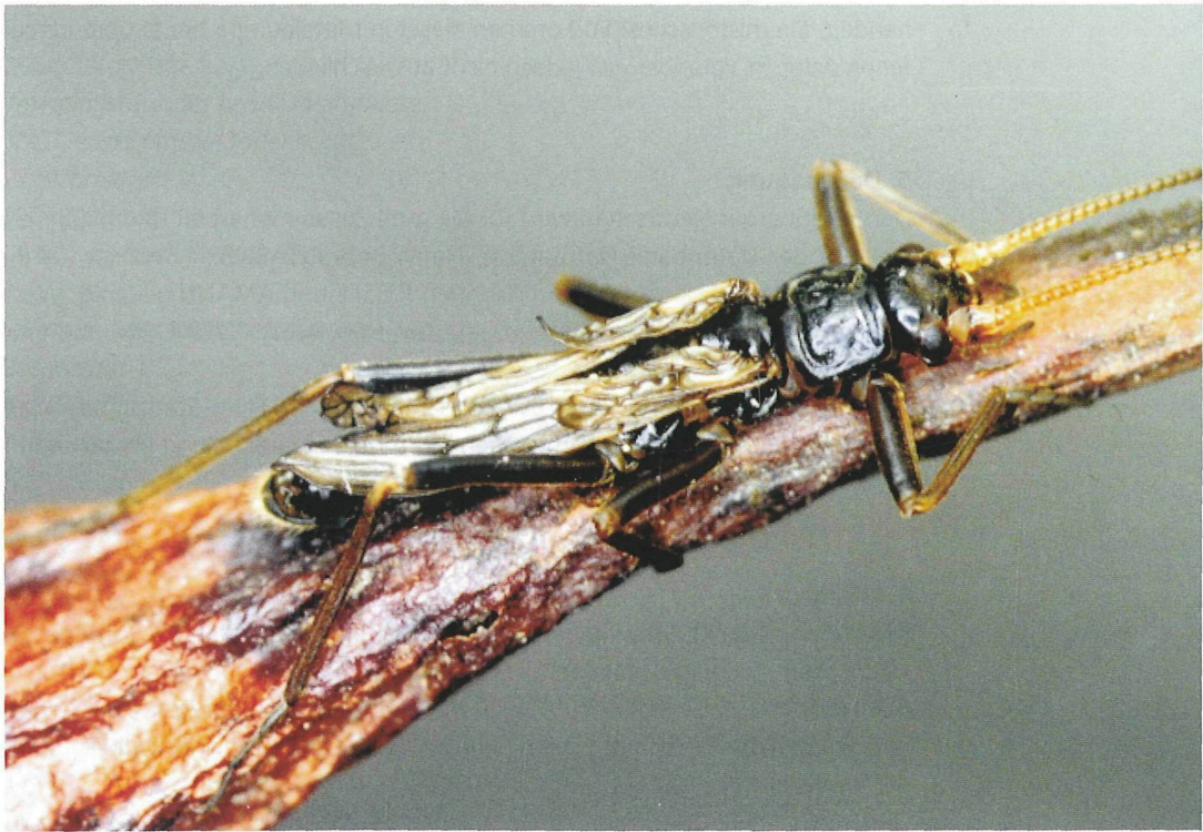
Abb. 1 (o.): Brachyptera risi vom Gwiggerbach, Hohenweiler