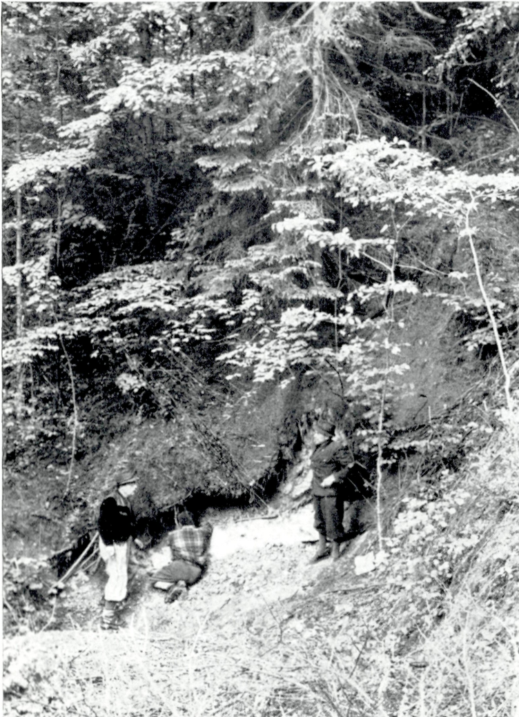
Abb. 1. Die Fundstelle bei Kohfidisch im Burgenland vor dem Beginn der Grabungen im Jahre 1955. Von rechts nach links Sepp Wölfer und Friedrich Kümel (kniend), die beiden Entdecker

planmäßigen Aufsuchung geologisch interessanter Aufschlüsse in der Umgebung gefunden und haben das Verdienst, diesen bemerkenswerten Fundpunkt entdeckt zu haben. Als wir im Jahre 1955 unter Führung der Entdecker zusammen mit Herrn R. H e l m e r diese Stelle besuchten, bot sich uns folgendes Bild: Im unübersichtlichen Waldgelände, wo man verschiedentlich im wechselnden Bodenrelief die Spuren alter Steinbruchstätigkeit erkennen kann, kommt unter Baumwurzeln und dichter Vegetation der tiefgründig gelbbraun verwitterte Fels in einer ganz kleinen Fläche zutage (Abb. 1). Es ist ein an frischen Bruchflächen grauer paläozoischer Kalk und Dolomit, der hier im Bereich der „Südburgenländischen Schwelle“ aus den geologisch viel jüngeren jungtertiären Meeresablagerungen aufragt. Hier aber ist er verwittert und von Klüften und Hohl-