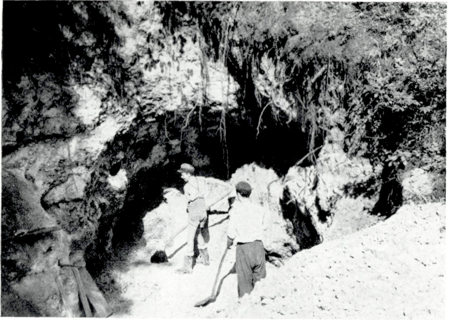
Abb. 2. Die Fundstelle nach den letzten Grabungen im Sommer 1958. Man erkennt bereits das Profil einer Höhle