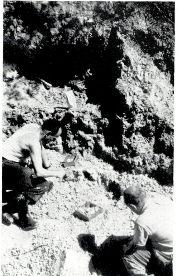
Abb. 3. Die Verfasser bei der sorgfältigen zonenweisen Ausgrabung