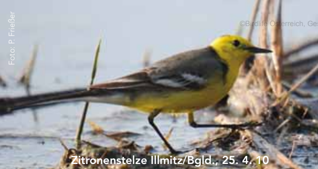
Zitronenstelze Illmitz/Bgld., 25. 4. 10