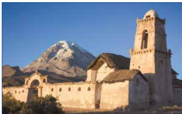
Bolivien, Tomarapi im Hochland