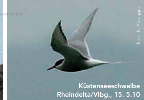
Küstenseeschwalbe Rheindelta/Vbg., 15. 5. 10