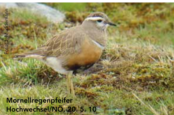
Mornellregenpfeifer Hochwechsel/NÖ, 20. 5. 10

Abkürzungen: ad.: adult (erwachsen), immat.: immatur, Kj.: Kalenderjahr, JK: Jugendkleid, PK: Prachtkleid, subad.: subadult, WK: Winterkleid, m: Männchen, w: Weibchen, sp.: Unterart