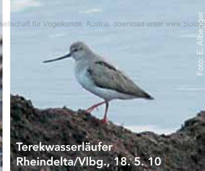
Terekwasserläufer Rheindelta/Vbg., 18. 5. 10