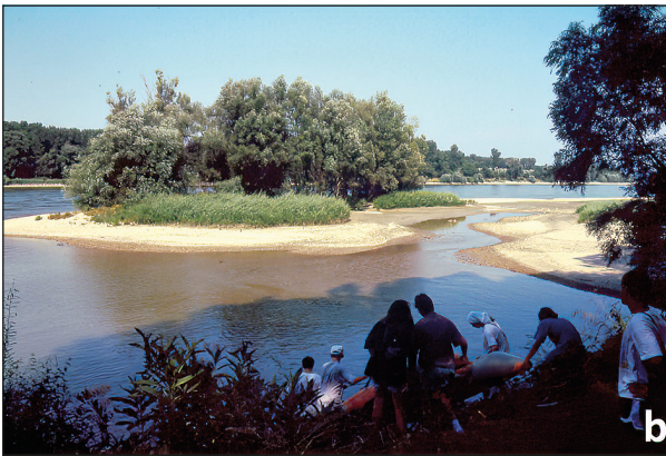
Abb. 5a u. b: Material der Uferentsteinung sollte nach Meinung des Erstautors zur Schaffung von Strukturen in der Nationalpark-Fließstrecke verwendet werden, die der Hebung der Pegel ebenso dienen könnten wie der Landschafts- und Artenvielfalt. – Fig. 5a and b: In the opinion of the first author, material from bank pitting should be used to create structures in the national park flow, which could serve to raise the water levels as well as the landscape and biodiversity.

Überschwemmungen, seichter und kleiner (Schiemer 1995, Hein et al. 2006, 2023, Reckendorfer et al. 2013b, Preiner et al. 2018).