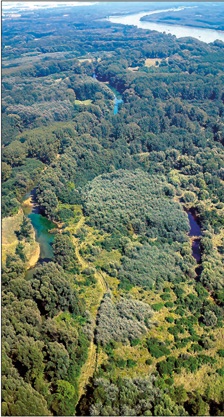
Abb. 1: Die Donauauen zwischen Wien und Hainburg – umkämpft, gerettet und dennoch bedroht ... – Fig. 1: The Danube floodplains between Vienna and Hainburg – fought over, saved and yet threatened ...