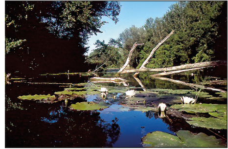
Abb. 2: Durch Regulierung und Hochwasserschutz entstehen vermehrt Stillgewässer, die bei mangelnder Durchströmung allmählich verlanden. – Fig. 2: Regulation and flood protection increasingly create still waters, which gradually silt up if there is a lack of flow.