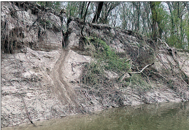
Abb. 4: Steilufer mit Biberutsche. Durch Gewässervernetzung gebildete Geländestrukturen gewährleisten hohe Biodiversität. – Fig. 4: Steep bank with beaver slide. Terrain structures formed by water networking ensure a high level of biodiversity.