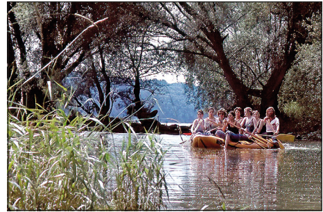
Abb. 3: Die Donauauen eignen sich hervorragend für Naturvermittlung und Umweltbildung. – Fig. 3: The Danube floodplains are ideal for nature education and environmental education.