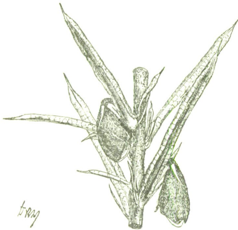
Fig. 3. Hovea pungens Benth. Zweigstück mit Blütenknospen. (Näheres im Texte.)

Hovea pungens Bth. ist ein aufrechter, wenig verzweigter Strauch von 1—2 Fuss Höhe, der ganz ausschliesslich in West-Australien vorkommt. 1) Das den folgenden Angaben zu Grunde liegende Materiale wurde von Preiss „in arenosis prope Pineapple“ (Perth) am 20. Juni 1839 gesammelt und unter Nr. 1054 vertheilt. Untersucht man einen in Blüthe stehenden Zweig, so findet man in den Achseln der linearen Blätter einzelne Blüthen stehend. Unmittelbar unterhalb des Kelches sind die hier besonders deutlichen Vorblätter inserirt, in der Achsel des erwähnten Laubblattes findet man zwei ganz ähnliche, die aber an Grösse bedeutend hinter diesem zurück-