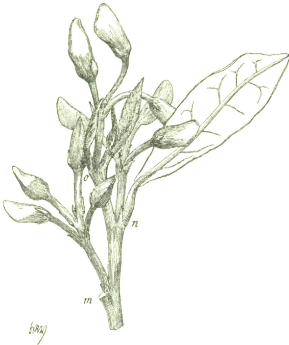
Fig. 6. Hovea Celsii Bpld.

Hypopodium zunächst in allen Fällen ein paar niederblattartiger kleiner Vorblätter folgt, die einander wenn nicht gerade opponirt stehen, so doch mit sehr geringem Abstände folgen, und aus deren Achseln sich je eine wenig-, gewöhnlich zweiblühthige Inflorescenz erhebt, deren Spitze von einer kleinen Laubknospe eingenommen wird; indessen habe ich ein Austreiben dieser Knospe in den Fällen