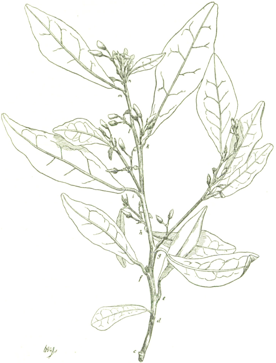
Fig. 5. Ast von Hovea Celsii Bpld. (Näheres im Texte.)