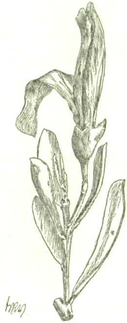
Fig. 2. Templetonia retusa R. Br.