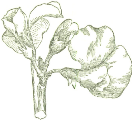
Fig. 4. Hovea Celsii Bpld.

womöglich aus dem Wege zu gehen, einen blüthentragenden Zweig (Fig. 4) und einen grösseren, der junge Blütenknospen trägt, abzubilden (Fig. 5). An dem ersteren sieht man drei Blüten mit ihren Bracteen; bei der mittleren, zu oberst inserirten und zuletzt aufgeblühten sind die inneren Theile abgetragen, um die eigenthümliche Form des in seiner Gestalt bei verschiedenen Arten wechselnden Kelches zu zeigen. An der Basis des Kelches sind die Bracteolae, die Vorblätter zu sehen, die übrigens bei dieser Art verhältnissmässig wenig hervortreten, da sie wie der Kelch von einem feinen braunen Indument bedeckt sind, das in der Federzeichnung zum Ausdruck zu bringen die geringe Grösse der Figur nicht erlaubte.