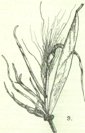
Acrocecidium der Pflanze bei Nr. 87.