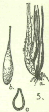
Pleurocecidium des Blattes bei Nr. 96