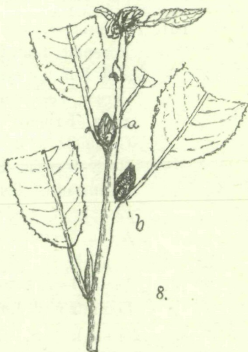
Acrocecidium der Knospe bei Nr. 155 b.

Bei a in Schuppen steckende Galle; bei b zerschnittene Knospe.