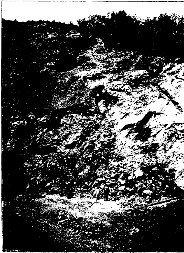
Fig. 2. Östlicher Teil des Steinbruches.