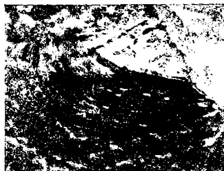
Inoceramus spec. ind.

halten, daß es eine nähere Bestimmung oder Vergleichung nicht zuläßt, obwohl die konzentrische Streifung mit Neigung zur Wulstung recht deutlich hervortritt. Die faserige Struktur der dünnen Schale wird erst unter der Lupe deutlich erkennbar. ( Inoceramus spec. ind. )